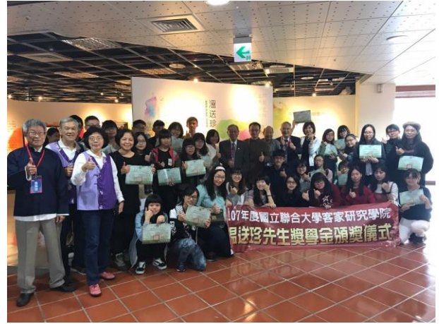
台北市客家文化主題公園 義民祭活動合照 客家文化主題公園