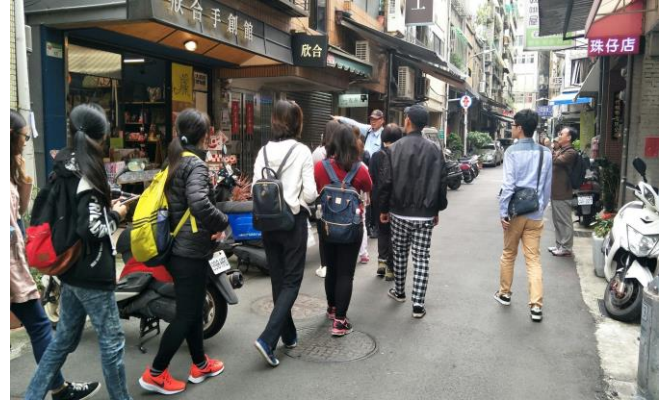
大稻埕進行實務導覽