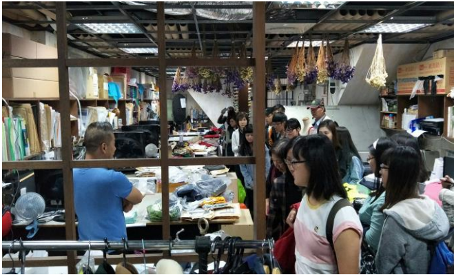
大稻埕進行實務導覽