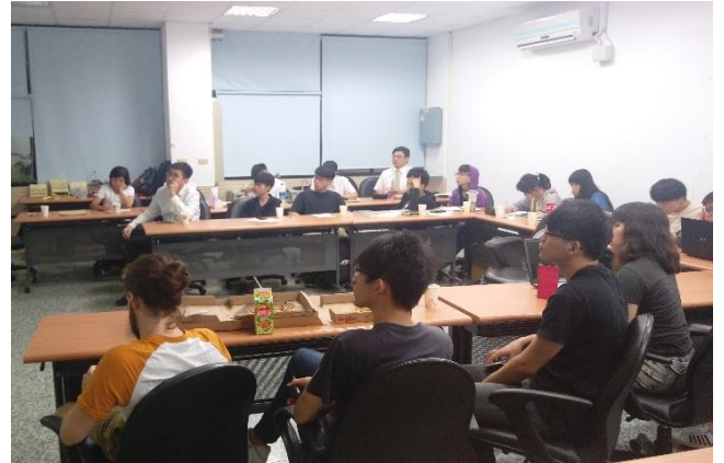
產業議題專題實作課程 (照護服務產業) 活動一隅