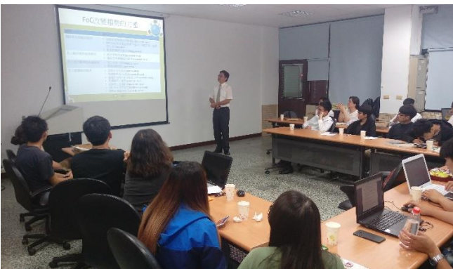
產業議題專題實作課程 (照護服務產業) 參與學生發表意見