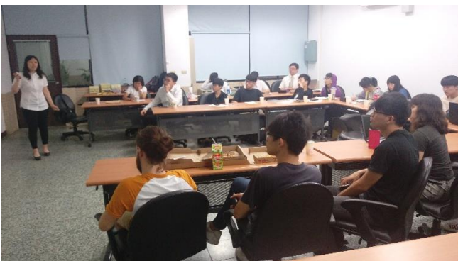
產業議題專題實作課程 (照護服務產業) 參與學生發表意見