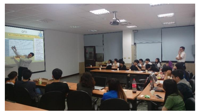
產業議題專題實作課程 (照護服務產業) 參與學生發表意見