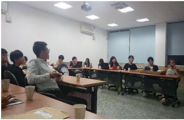
產業議題專題實作課程 (照護服務產業) 活動一隅