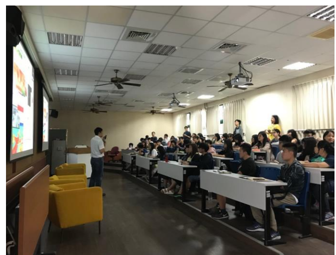
10/5 專題演講「建築人參與 永續校園環境改造之思考與策略」