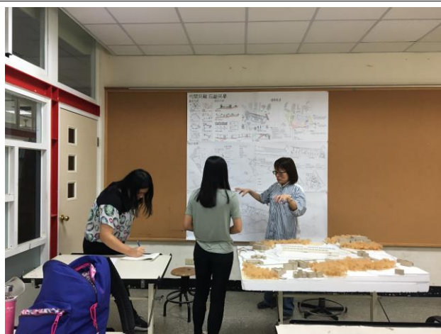
10/25(四) 永續校園設計討論剪影 3