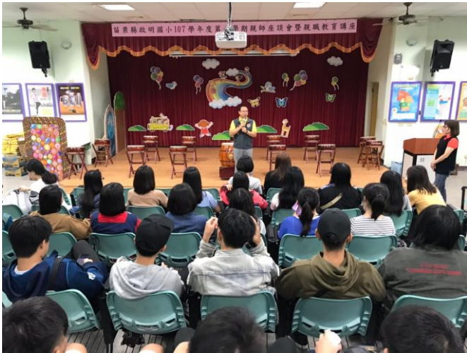
9/27(四) 赴啟明國小進行 基地勘查剪影 1