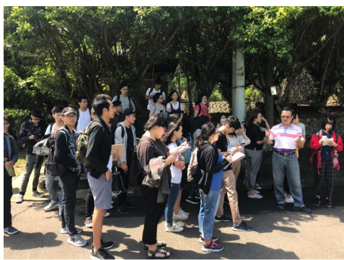
9/27(四) 赴龍坑國小進行 基地勘查剪影 2