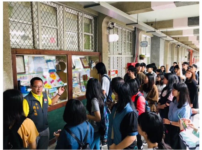
9/27(四) 赴啟明國小進行 基地勘查剪影 2