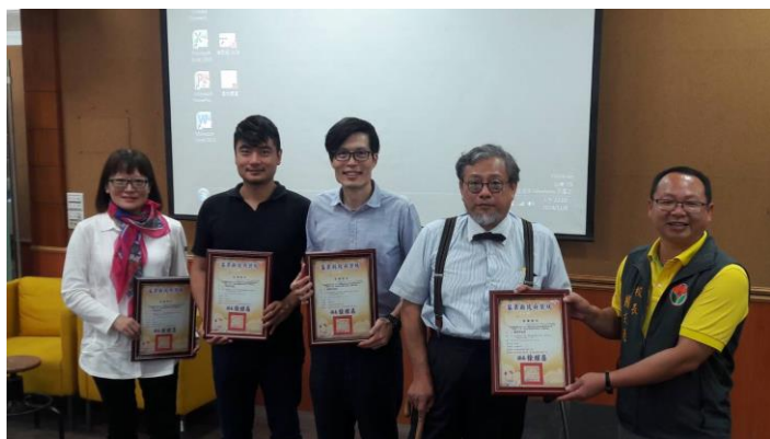
11/8(四) 成果發表會-啓明國小校長 致贈感謝狀予本系設計課指導老師