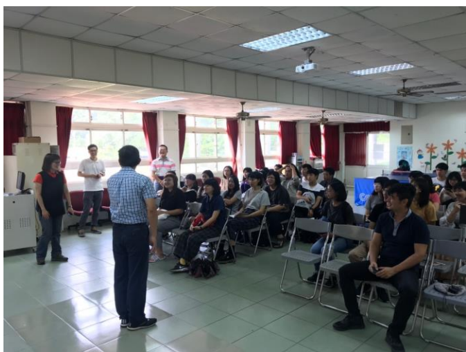
9/27(四) 赴龍坑國小進行 基地勘查剪影 1