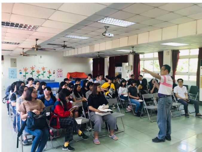
9/27(四) 赴龍坑國小進行 基地勘查剪影 3