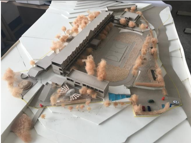
啓明國小基地模型