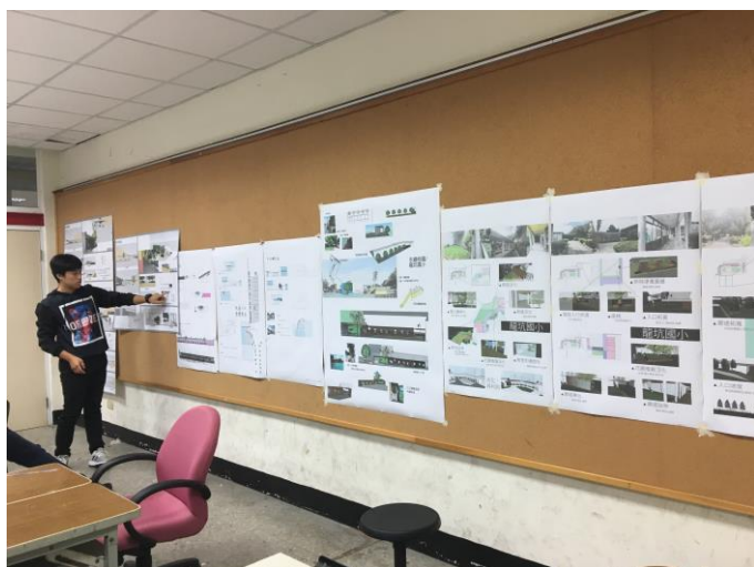
10/11(四) 永續校園設計討論剪影 1