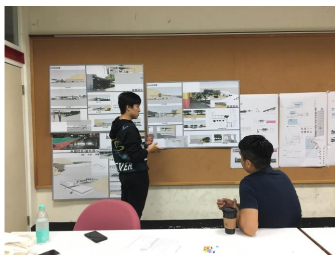
10/11(四) 永續校園設計討論剪影 2