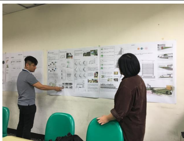
10/25(四) 永續校園設計討論剪影 4