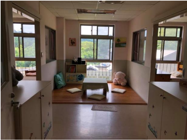
布置相當溫馨的房間與公共空間