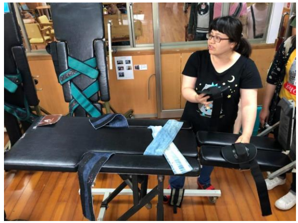
輔助站立適應的輔具