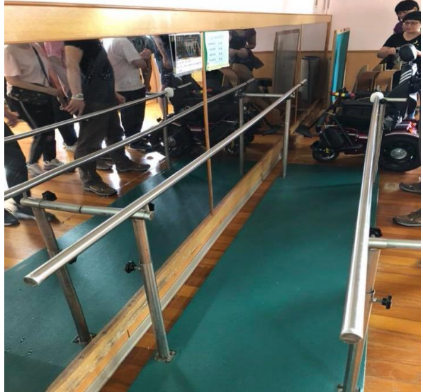
行走練習的平衡桿