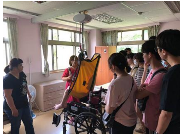
從輪椅移動至床面的軌道吊掛輔具