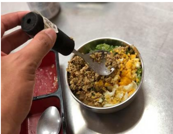
可折彎以配合手部變形患者用餐的湯匙設計