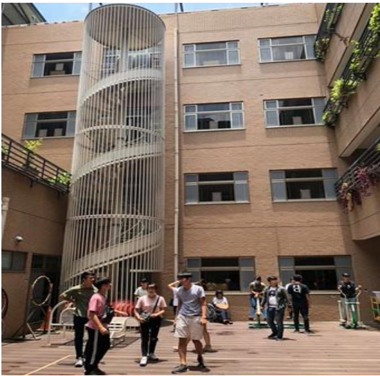
結合逃生梯與溜滑梯的設施