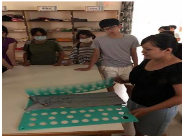
用以教導慢飛天使折衣的摺衣板