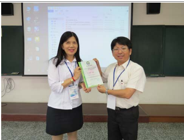
頒發論文發表證明