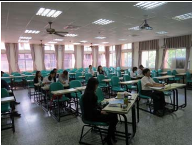
2018 產業研習發表會場