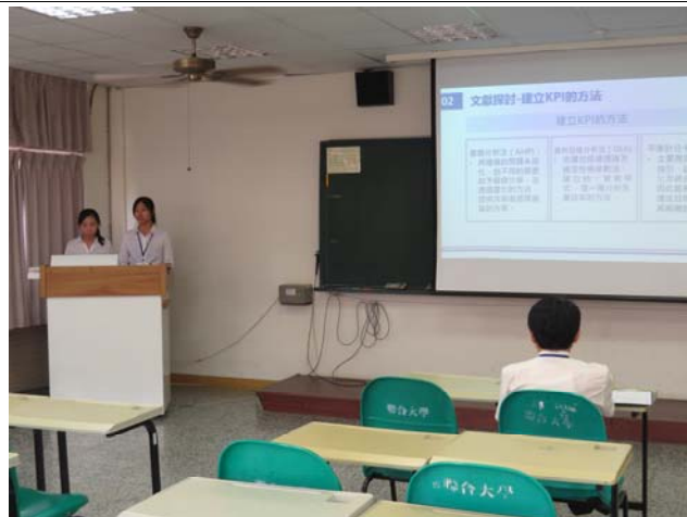
產業論文發表之一