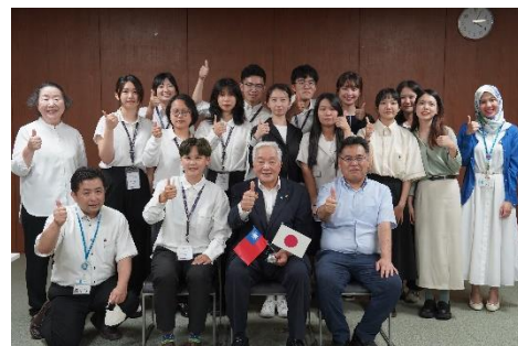
111學年度 短期交流學生與華文系實習生一同拜訪新居濱市市長，NHK、朝日新聞採訪報導於電視及網路新聞。