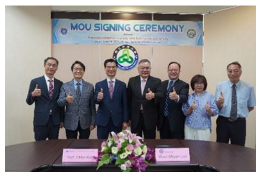
112. 06. 19 韓國三育大學師長與本校師長合影留念