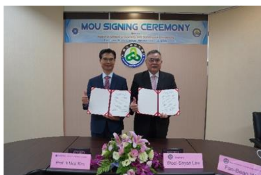
112. 06. 19 與韓國三育大學簽署合作協議書