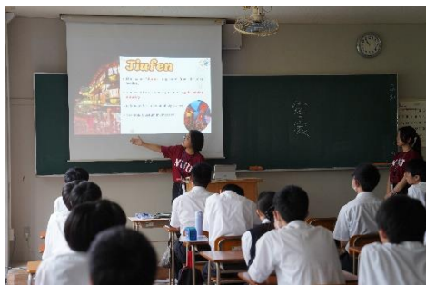
111學年度本校學生介紹臺灣文化、特色景點。

111學年度共6位學生赴外短期交流(2位文創系、2位機械系、1位財金系、1位工設系至日本新居濱高專短期交流)。