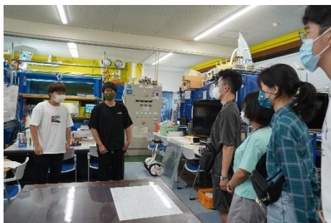
111學年度新居濱高專安里教授帶領同學參觀流體實驗室。