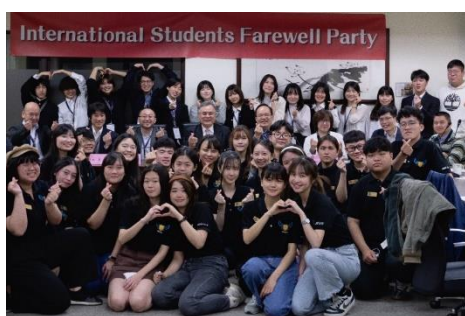
日本實習生與本校師長、世界青年志工團接待志工合影留念。