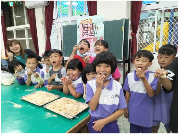
創意年糕手作課程讓小朋友體驗動手做的樂趣，玩得開心吃得也開心。