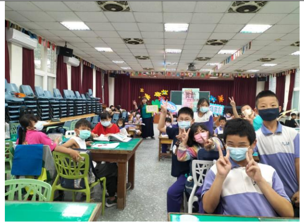
舞動客家擂台賽圓滿成功，大家都是最佳表演者。