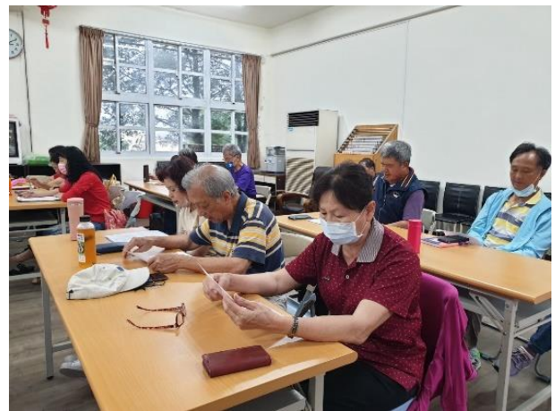
學生先熟悉客家本色歌詞