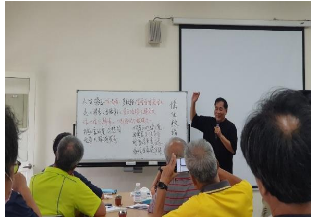
賴老師說明唱腔及曲調