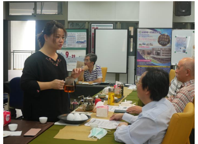
茶司介紹貓狸紅茶