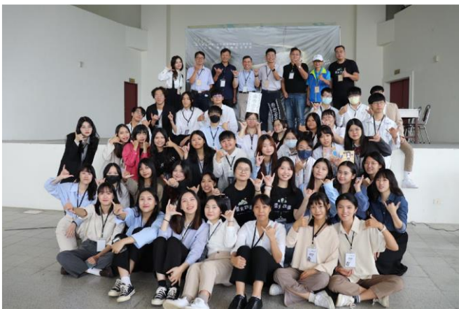
開幕活動結束後邀請師長以及與會來賓一同合影