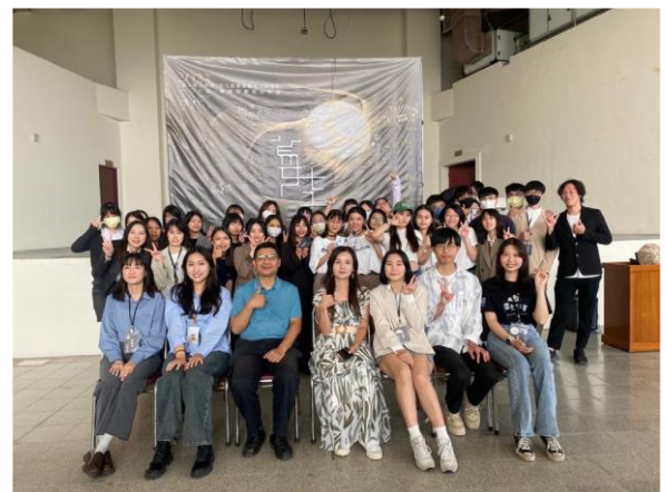
蔓生閉幕活動兼頒獎儀式後的全體大合照