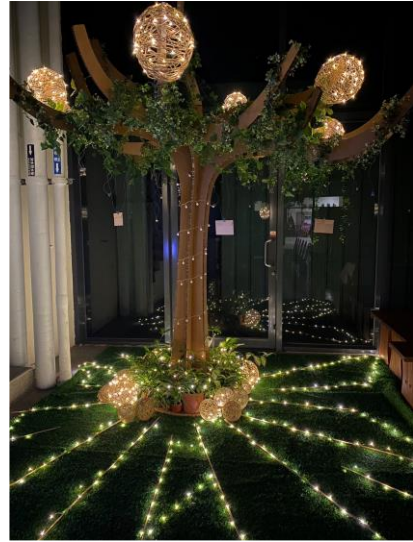
以生命之樹搭配串燈的表現形式呈現出 能量光點發散、匯聚的過程