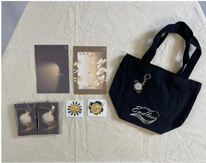
蔓生相關系列周邊