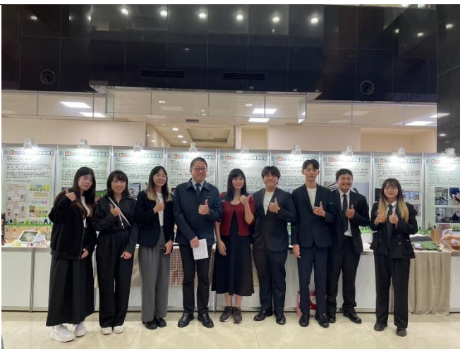
團隊與校長及指導老師於展櫃前合影