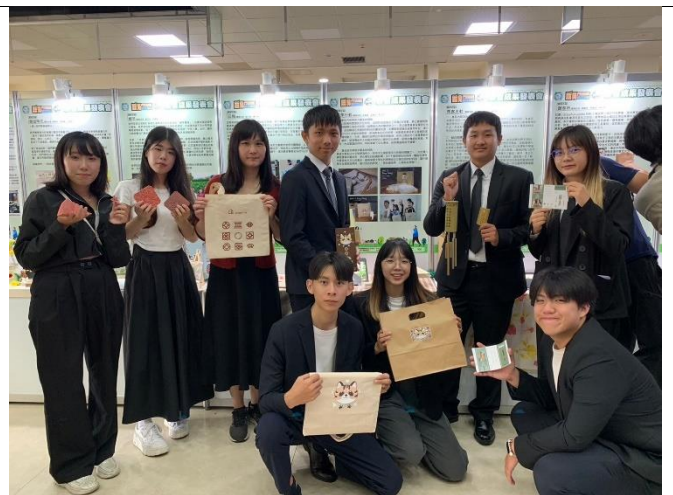
獲獎團隊與指導老師於展櫃前合影