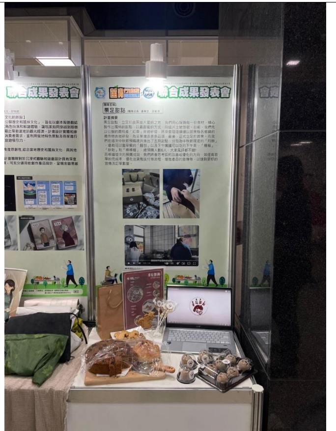
成果發表團隊展覽區