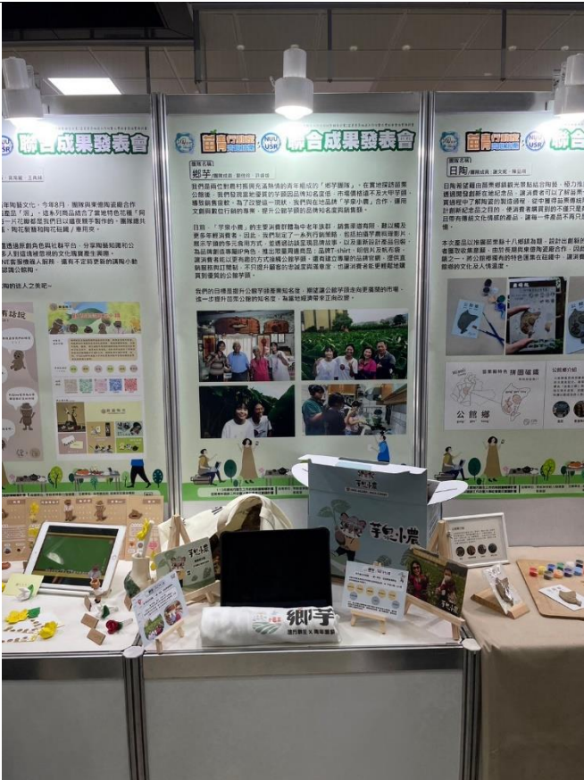
成果發表團隊展覽區