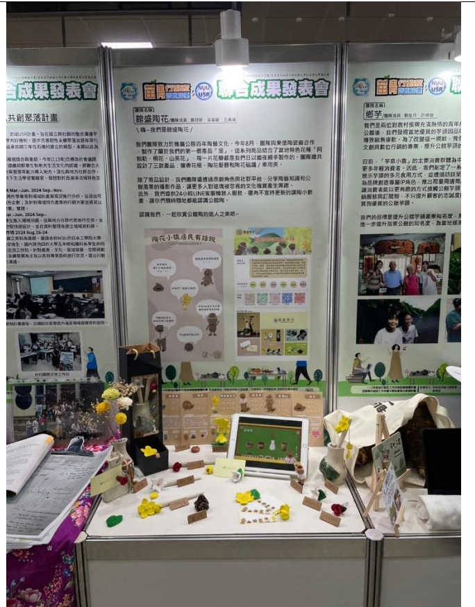
成果發表團隊展覽區