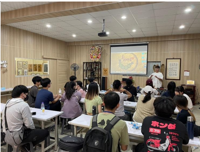
5月18日參訪 喜妹娜哇稻草藝品館