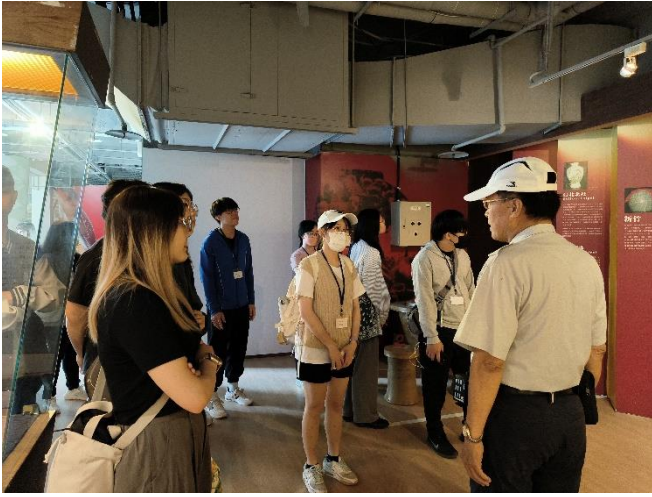
5月18日參訪 陶瓷博物館導覽員與學員解說