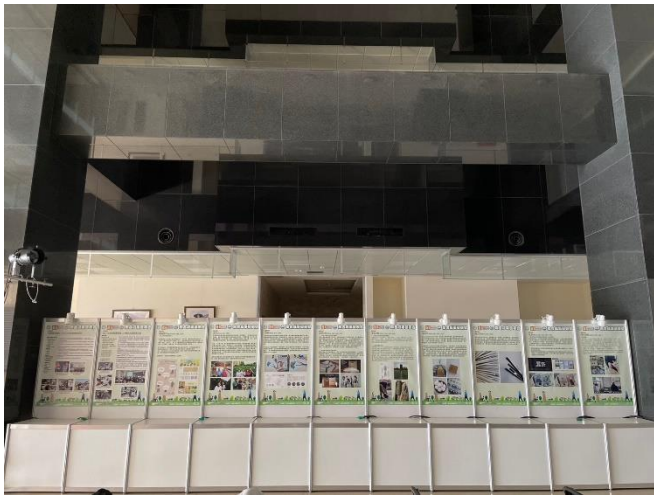
成果發表團隊展覽區