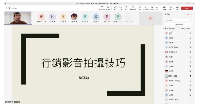
5月15日課程 行銷影音拍攝技巧