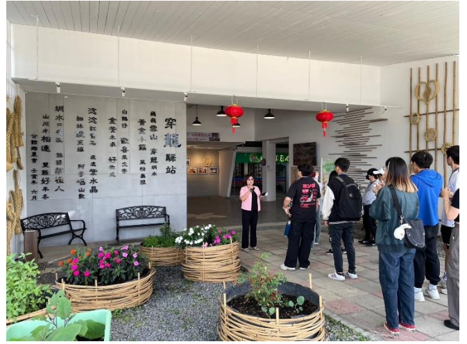
5月18日參訪 公館農會總幹事與學員解說