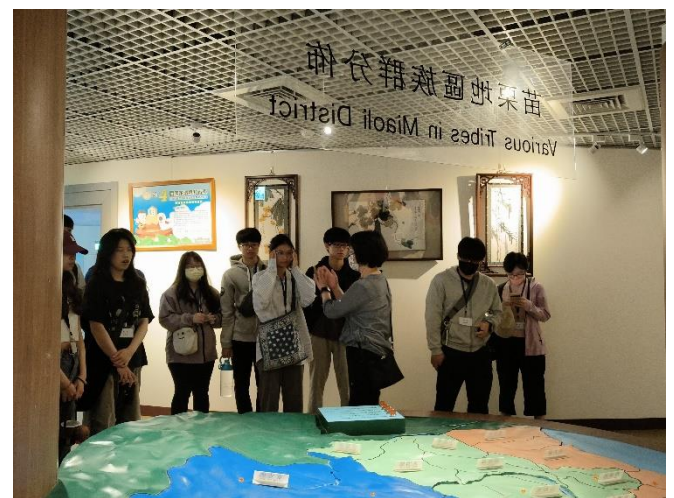
5月18日參訪 苗栗區農業改良場導覽員與學員解說