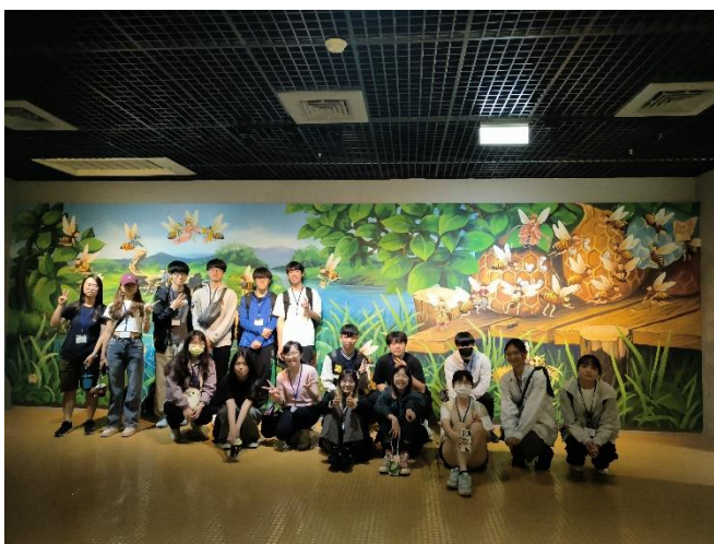
5月18日參訪 於苗栗區農業改良場合照