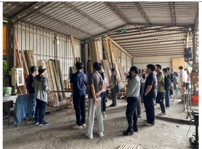
5月18日參訪 明安竹材行