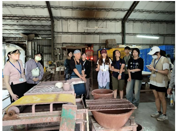
5月18日參訪 東億陶瓷