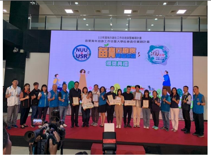
獲獎團隊頒發獎狀、獎金