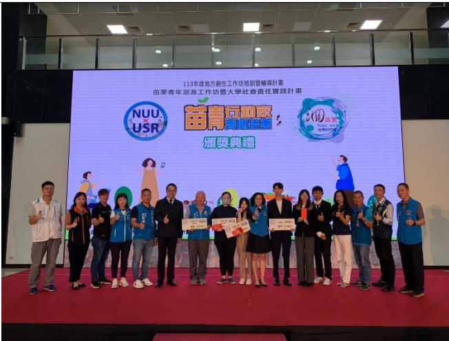
獲獎團隊頒發獎狀、獎金