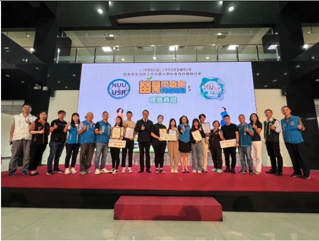
獲獎團隊頒發獎狀、獎金