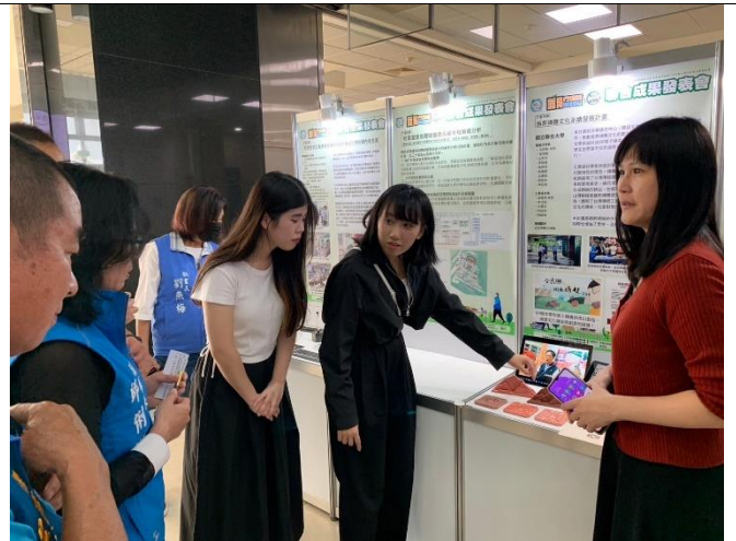
團隊解說及展示成果