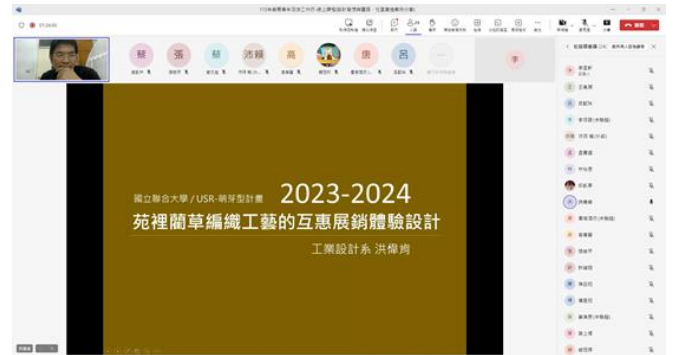
5月14日課程 苗栗物產與社區營造案例分享