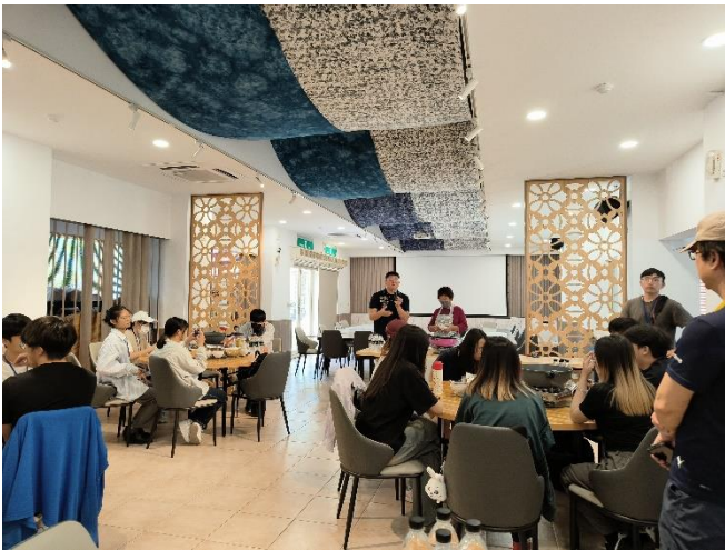
5月18日參訪 芋頭米粉DIY解說