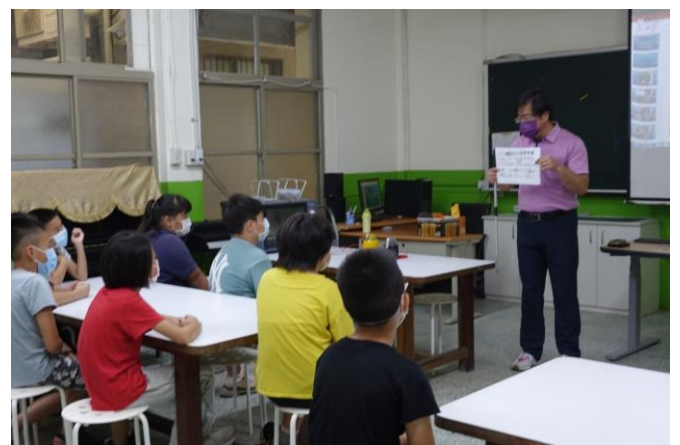
陽極處理製程說明