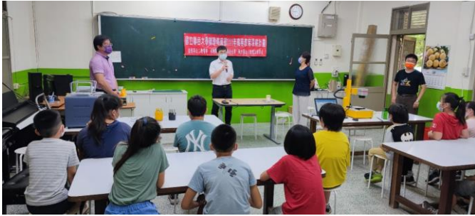
陳主任介紹計畫內容及課程說明