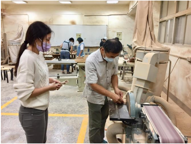
講師協助學員製作作品