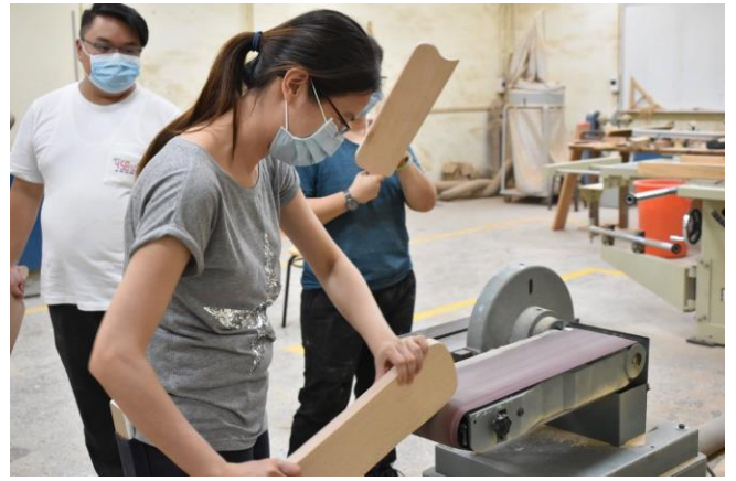
校內跨系學生共學工作坊上課情形