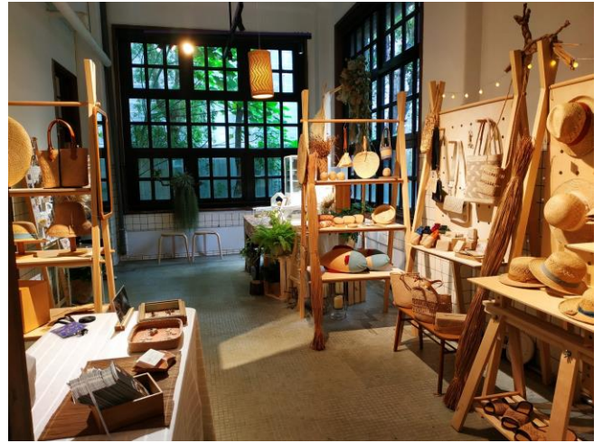
開發的展示木架實際於台北松菸職人市集通路供台灣藺草學會展示及銷售