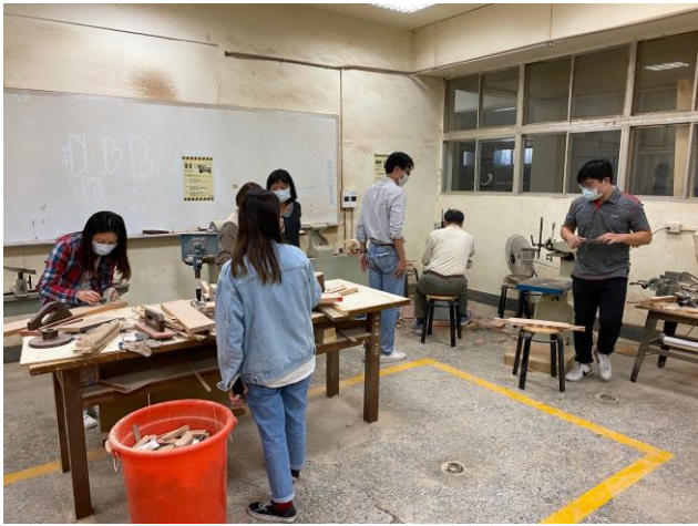
學員認真完成自己的作品