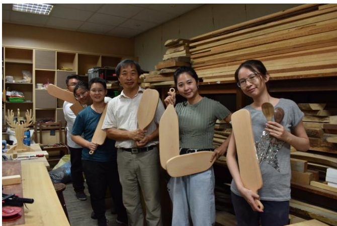
聯大師生帶領校外人士實作測試工 作坊