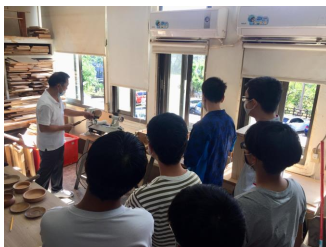
講師指導機台操作