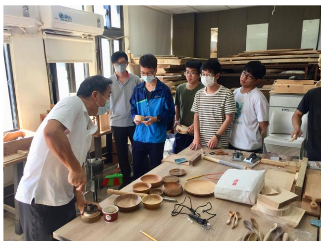
講師講解打磨過程