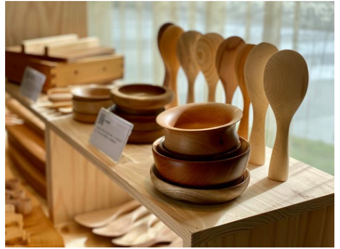
木作市集攤位展示