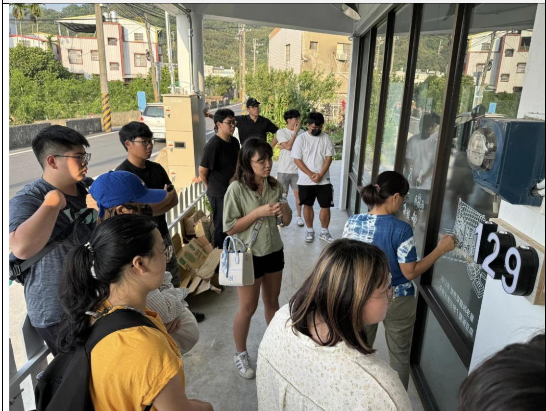
說明：參訪新成立的「田心129」基地