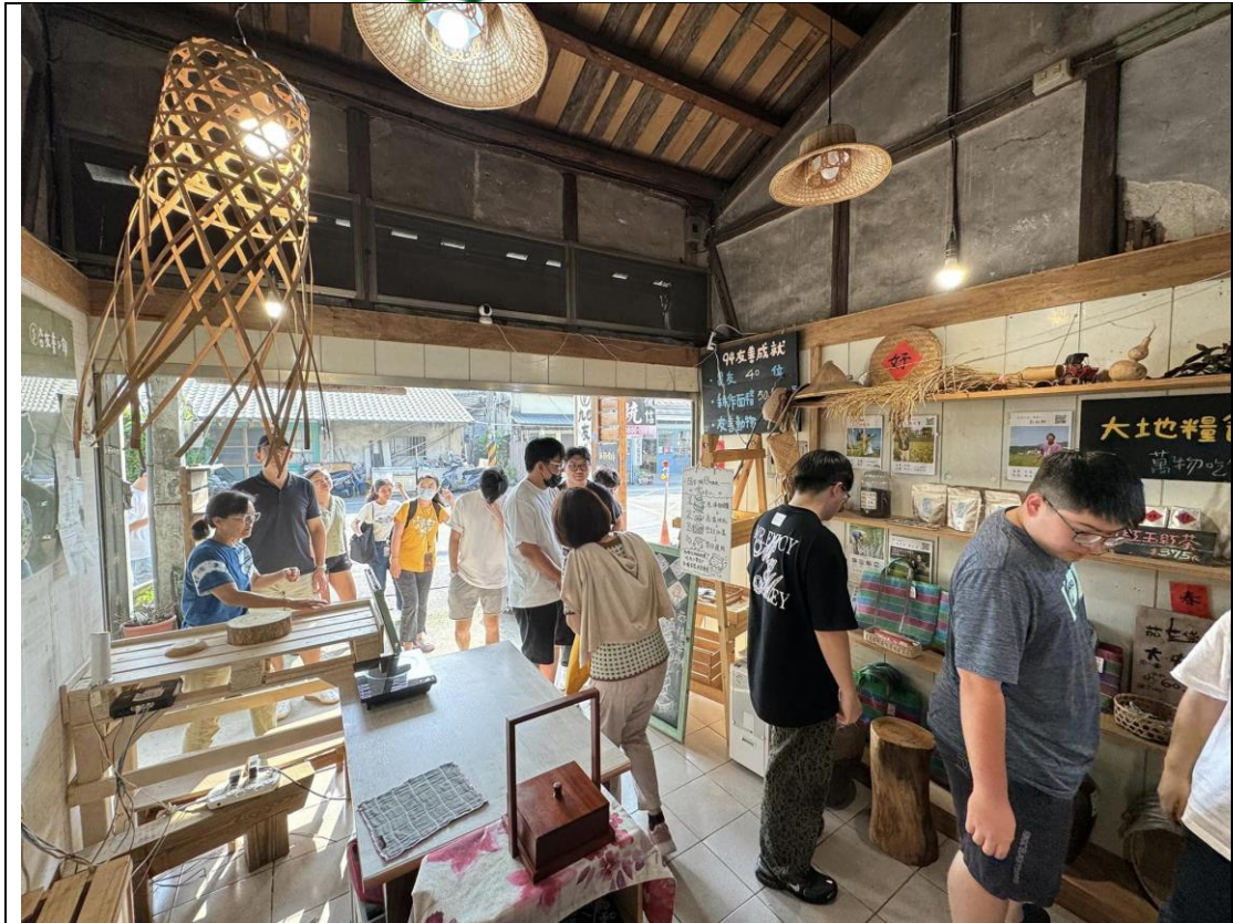
說明：在地農產品行銷及展示工具介紹