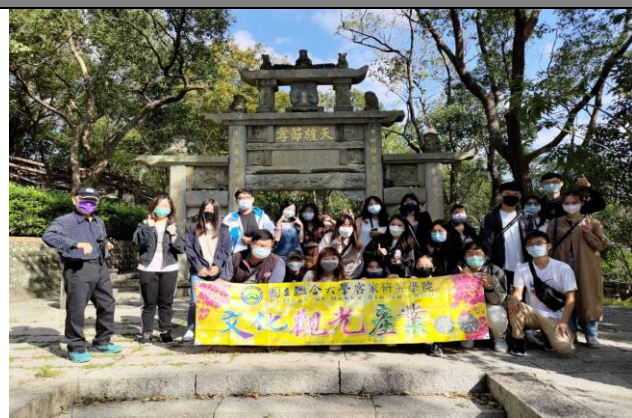
111/10/29 觀摩導覽-賴氏節孝坊、鄭崇和墓、竹南中港城、宣王宮