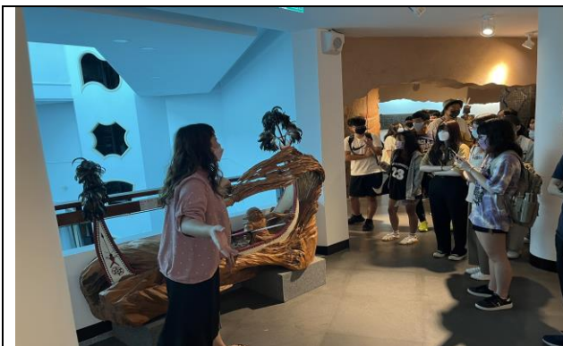
111/09/20 觀摩導覽-三義木雕博物館