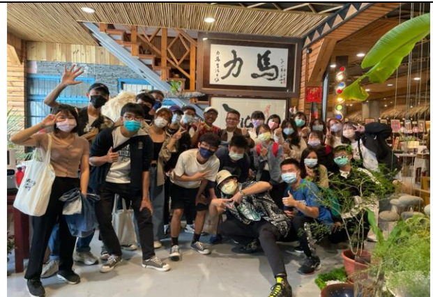
參訪-力馬工坊、賴興魁麵館、茅鄉炭坊、雙峰草堂