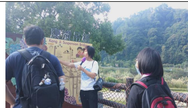
111/10/4 參訪-好客在一起工作坊地方產業