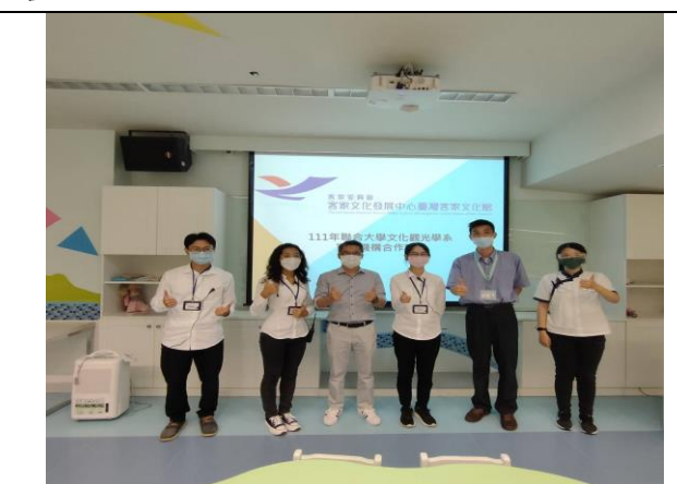
111/09/16 客家文化館實習學生始業式