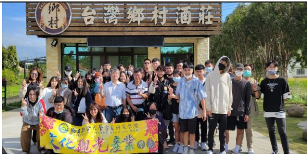
111/11/04 參訪-苗栗酒廠股份有限公司、雲端製酒股份有限公司、台灣鄉村酒莊