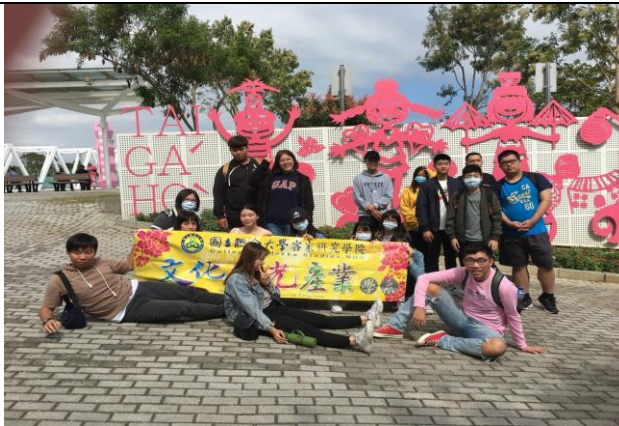
111/09/20 參訪-銅鑼客家文化園區