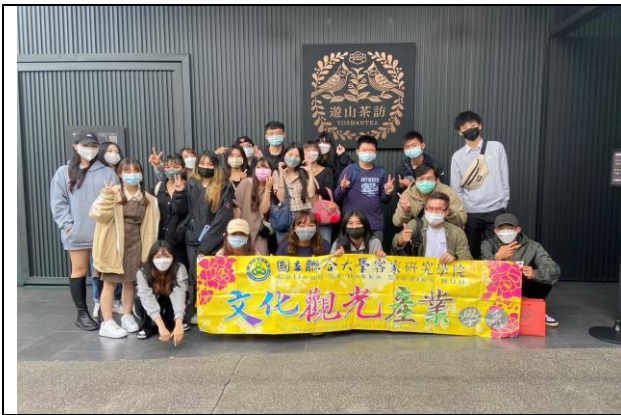
111/11/06 參訪-鹿谷茶廠、遊山茶坊、麒麟包裝總部