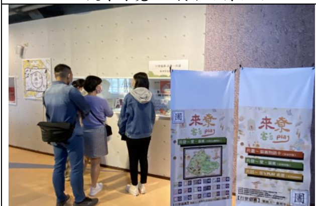
111/11/16 來寮科技素養工作坊