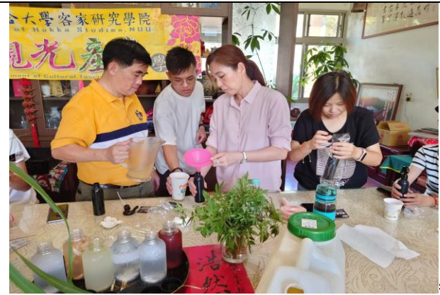
111/7/24 參訪-體驗客家防蚊液製作裝罐