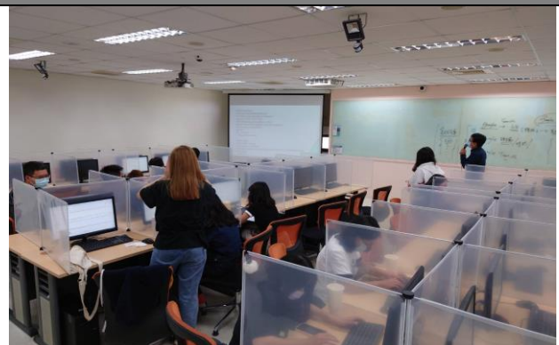
111/11/01 程式設計智慧工作坊-