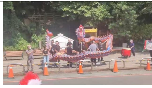
111/10/04 參訪-南庄苗栗火旁龍傳統文化