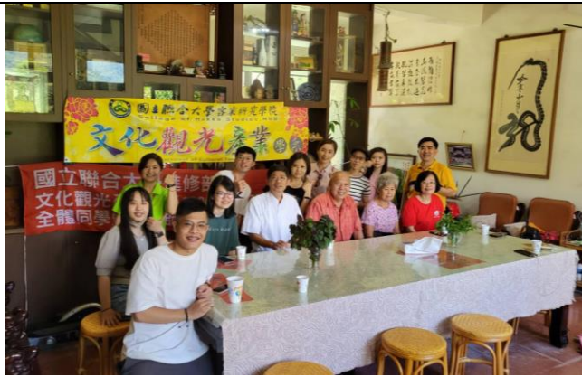
111/7/24 參訪-上安社區地方產業合影