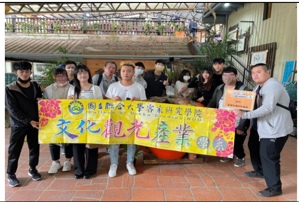
111/10/30 參訪-柿餅觀光農場、九芎湖休閒農場合影