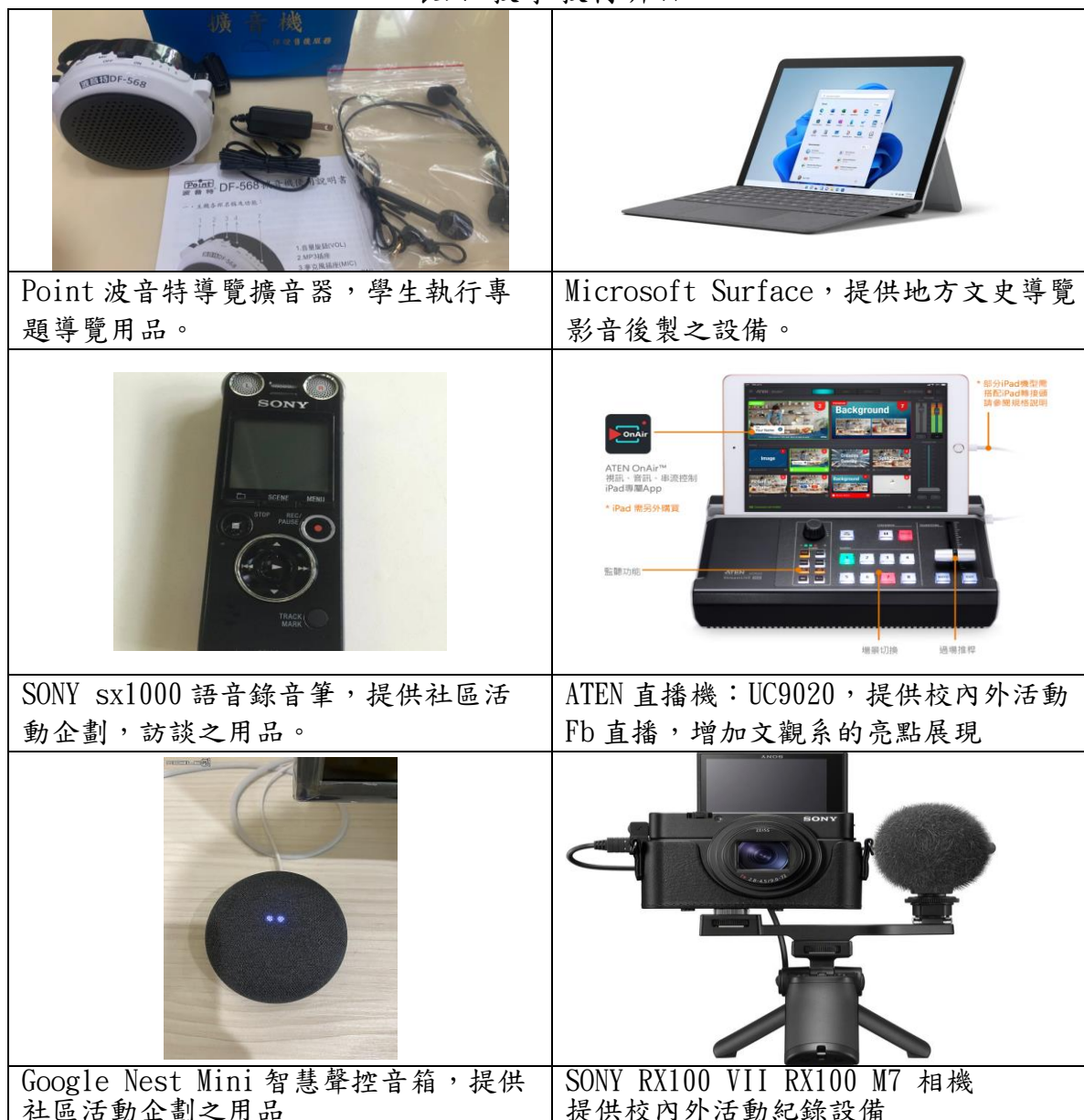
表六 教學教材介紹