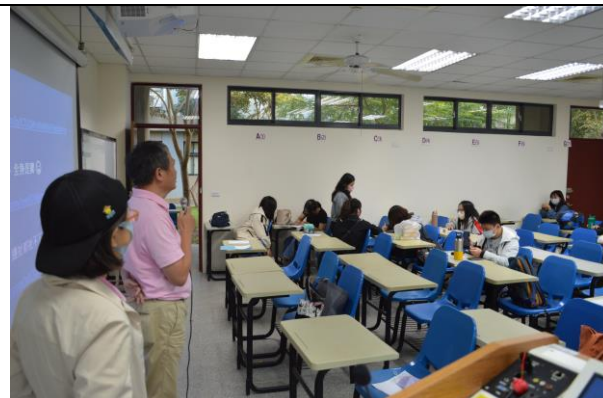
111/10/24 美仁，講題: 永續旅遊與農遊大使