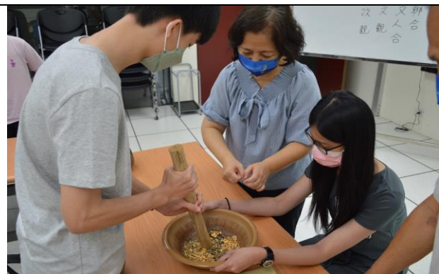
111/07/28 艸田西木體驗探索高中營