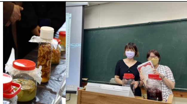
111/6/23 釀酒課程期末成果發表，