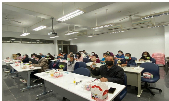
導師們對於手作課程參與踴躍