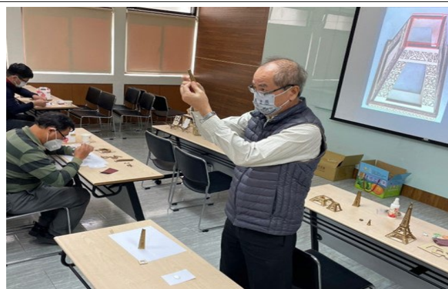
講師講解製作過程及老師在旁製作