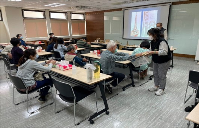
工作人員發放材料