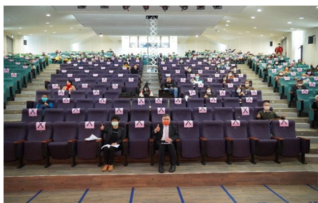
長官與師長們的大合照