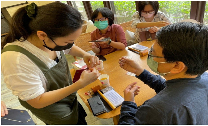
講師示範操作技巧