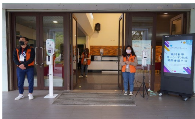
因應疫情影響，入口簽到處安排學生進行量測體溫與手部酒精消毒