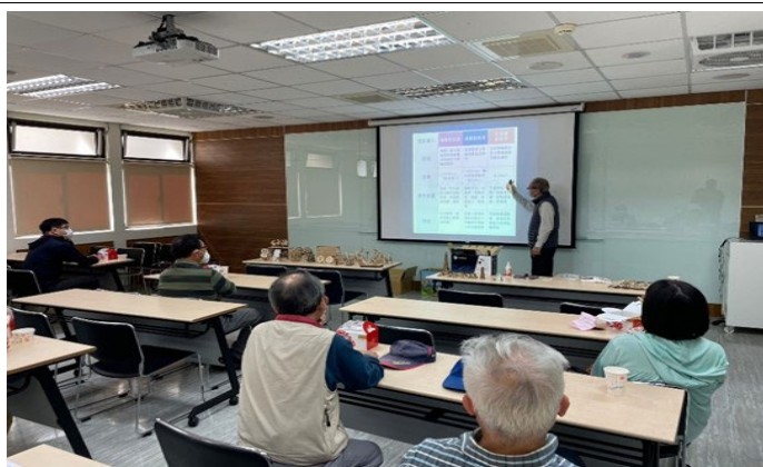
講師講解本次活動主題