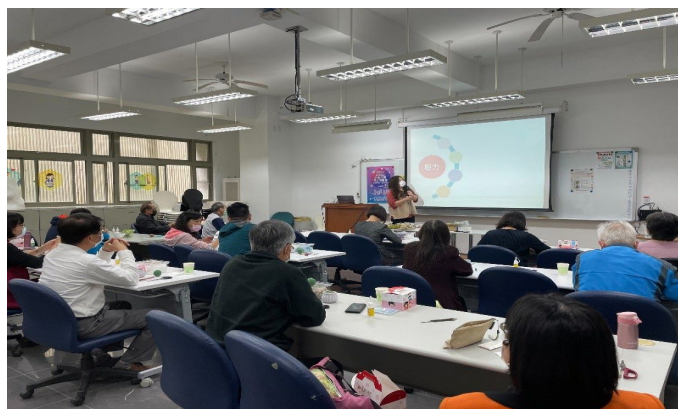
講師介紹壓力、身心覺察與調適