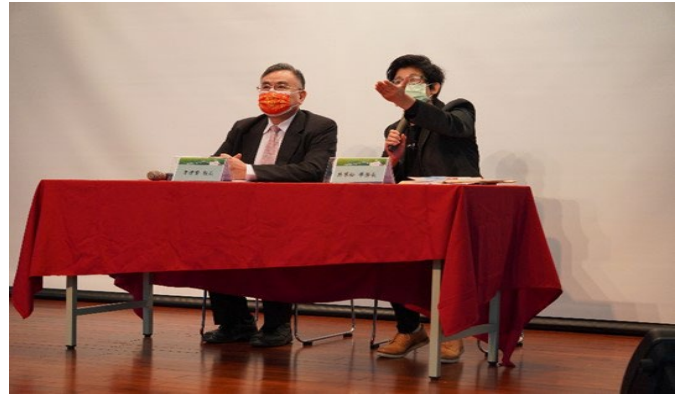
校長與學務長與各位老師們進行 Q&A