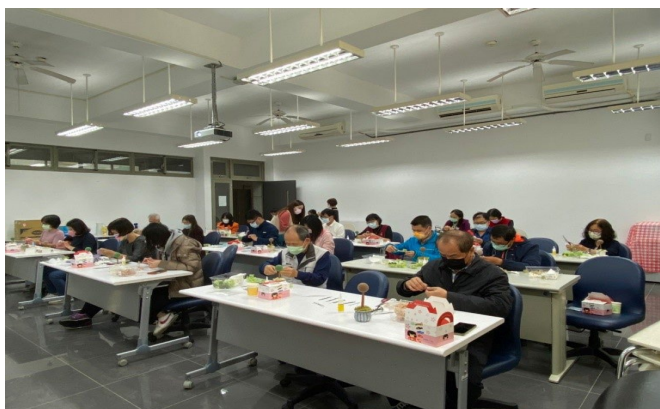
導師們專注在各自的手作