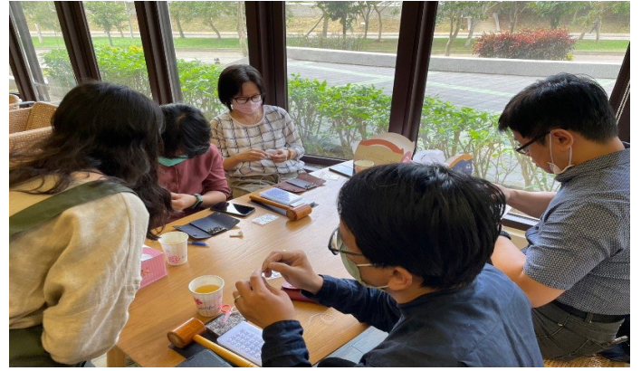
與會老師認真實作