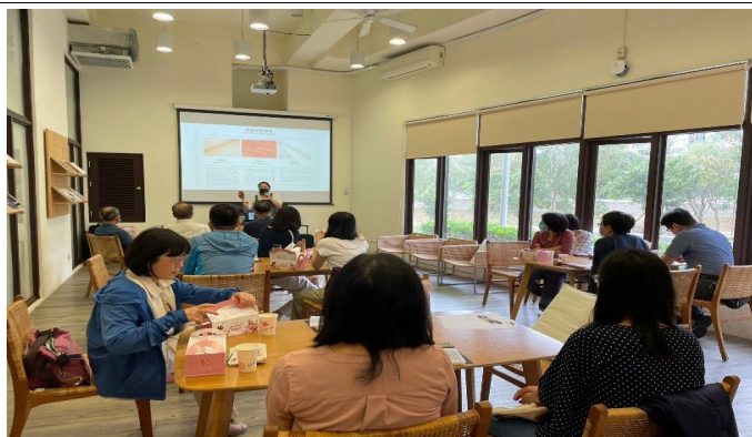
講師講解本次活動主題