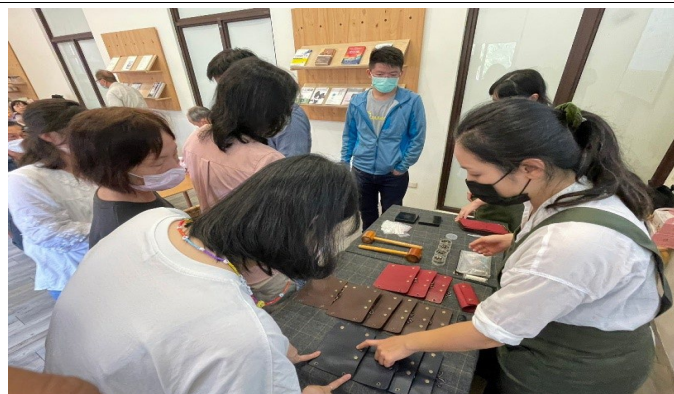
與會老師挑選活動皮件材料