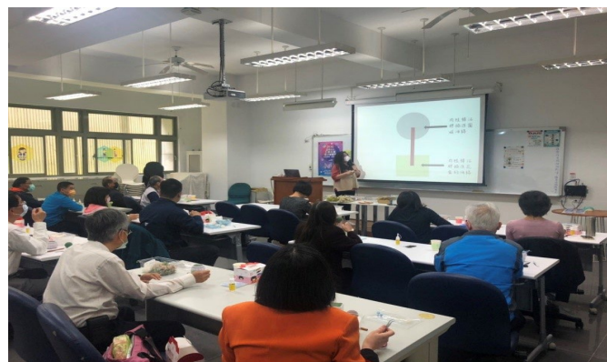
講師介紹花藝、對身心及生活的幫助