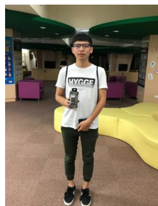
世界閱讀日活動頭獎得主