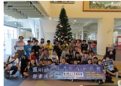
「圖 Night 與書同眠」夜 宿圖書館活動大合照

參加活動的學生對於夜宿活動非常興奮，認為比一般的營隊活動更為新奇、有趣，非常好玩；大學圖書館資源及設施較為多元，希望藉由營隊形式的夜宿活動，讓學生走進圖書館，親身體驗書香的魔力，並接觸數位閱讀及電子資料檢索的強大功能，啟發汲取新知的樂趣；圖書館未來也將會持續規劃提供偏鄉學生、弱勢學生、原住民學生及縣內各級學校學生和社區共享圖書館資源，提高學校能見度，助於招生，同時透過主動親近在地弱勢族群，瞭解其所需，引導其善用扶助弱勢招生管道就學，達到提升高教公共性之目標。