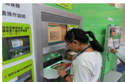
一日館員學習使用 自助還書機