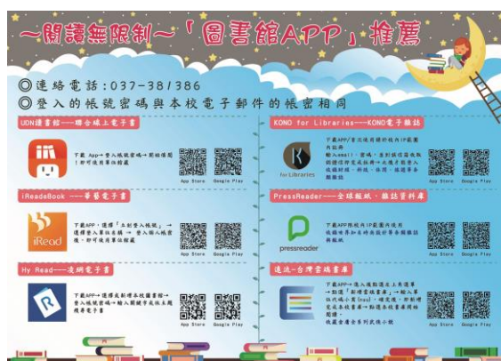
電子書 APP 宣傳海報

配合世界閱讀日舉辦電子書閱讀競賽，吸引學生加入電子書閱讀行列，利用大學導航課程加入電子書APP宣導活動，讓所有的大一新生都能了解電子書豐富的館藏資源，並學習手機閱讀電子書的使用方式。「E書有禮-電子書線上測驗」，善用數位學習平台，由館藏電子書中設計相關題庫題，提供全校師生進行線上測驗填答，每份試卷隨機抽取5題，答對3題以上者即可參加抽，輔以活動獎品的誘因提升參與人數，達成推廣目的。