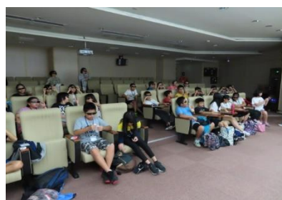
帶 3D 眼鏡觀看 3D 電影