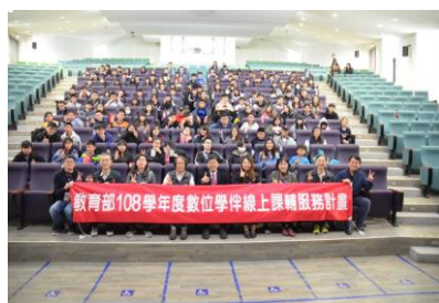
聯大偏鄉遠距課輔相見歡暨 夜宿圖書館活動大合照

另活動除了讓學生學習使用圖書館資源，安排學生擔任一日館員，並與本校人文社會學院合作，安排小朋友體驗攝影棚與空拍機，讓參與的偏鄉孩子對大學校園生活有親身的體驗。藉由數位學伴相見歡活動，在大學校園裏進行不一樣的學習體驗。除了讓大小孩子倘佯校園的團康外，更安排了結合人工智慧與程式設計的體驗，以及手作 DIY、時光開甕的溫馨活動，讓參與的偏鄉孩子對大學校園生活有親身的體驗。