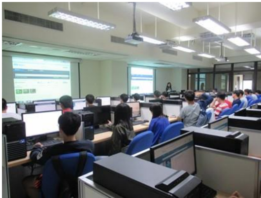
教導同學使用電子資料庫

最大效益。本次活動讓師生能更有效率地利用圖書館電子資料庫資源，瞭解”如何以最經濟的時間蒐集到最切合所需的研究資源”，電子資料庫教育訓練讓同學有不同的體驗及收穫。