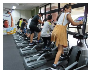
體適能中心健身器材 體驗活動