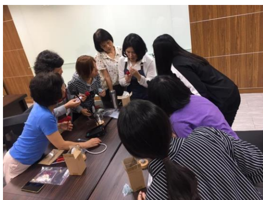
老師示範如何將玫瑰花展開

讓美感有感，就必須讓人面對它、有所感，面對不好和不美，可以產生希望更好、更美的想法。理想中的美感教育是可以帶給人有自我滿足感和成就感，透過發現問題意識、以美感邏輯思考方法、問題得到實證的過程，讓人感覺滿足和獲取成就，藉由動手做、動腦想讓世界更美。有鑒於此，本校特規劃此次活動，其方式是採用永生花花材，來製作花盅，永生花指的是透過特殊加工的鮮花，通過特殊處理，它的保存期間比鮮花更長久，且顏色變化豐富，參與的教職員及學生透過參與、實做的過程，除了可以陶冶心性之外，也藉由視覺及觸覺的經驗，提升美感素養，將美放在核心，去作為整合德智體群的鑰匙。