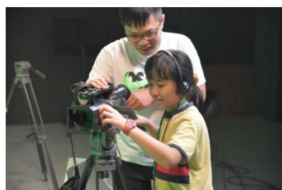
與人文社會學院合作，安排 小朋友體驗攝影棚