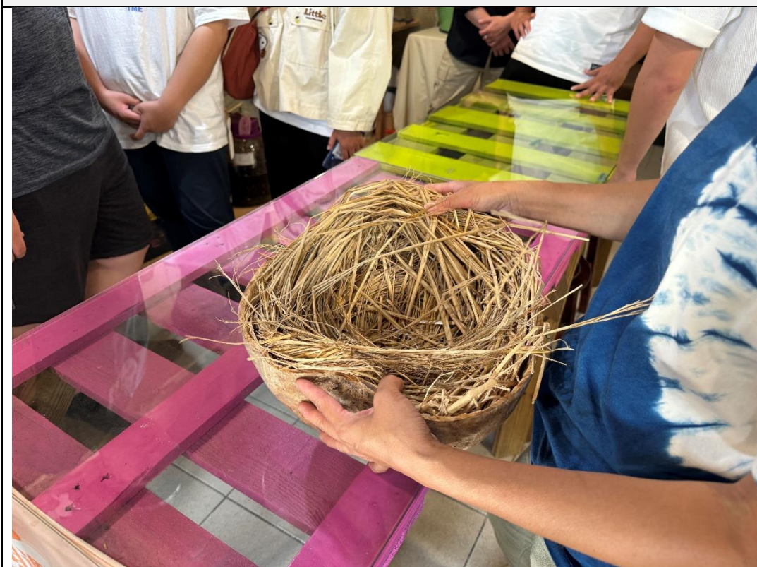
說明：討論農業廢棄物及包裝的運用現況