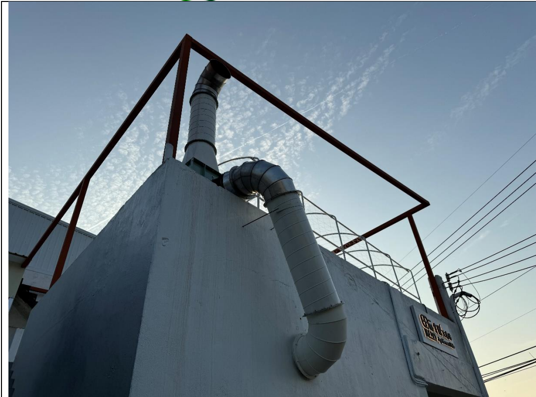
說明：踏查地景裝置藝術的可能設置地點及空間