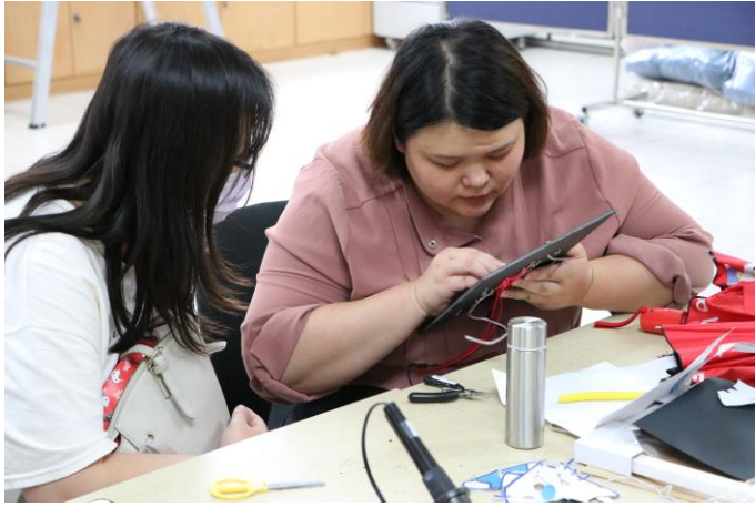
講師下場巡視學員製作過程，給予協助