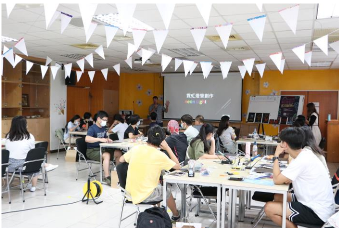
講師講解冷光線原理