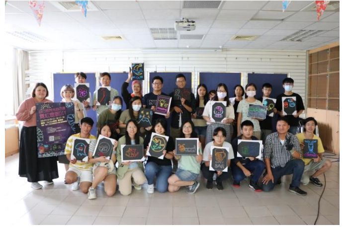
全員與自己的作品大合照