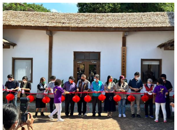
2022/10/29 獲邀參與農村生活館開 幕式