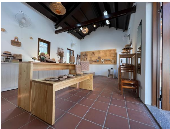
整修後的「農村生活館」空間及木工 展示家具