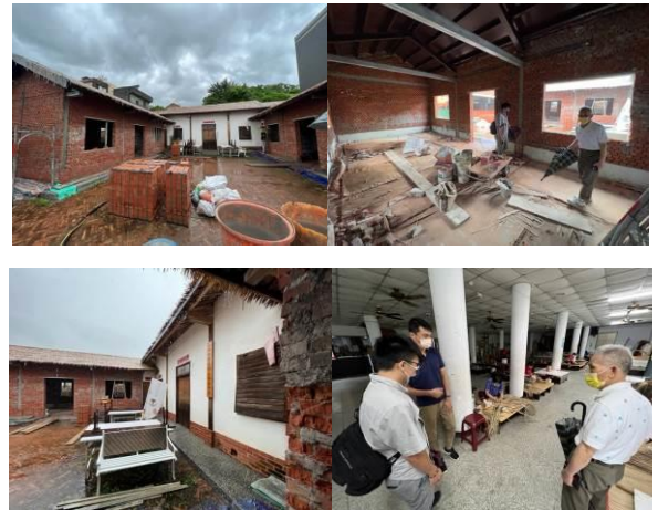
整修前的三合院「農村生活館」展售中心