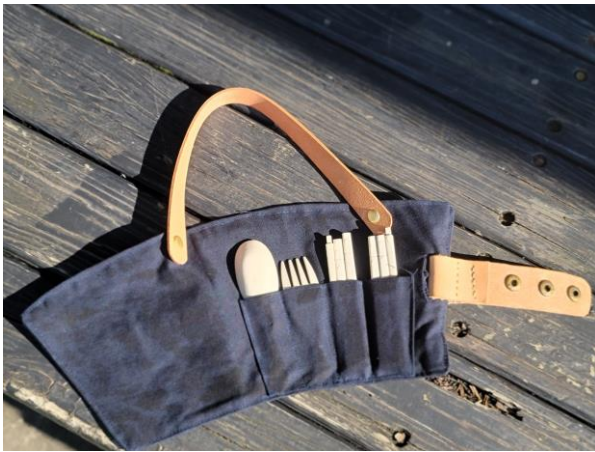
開發的藺編午餐袋