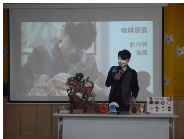
講師分享自己的作品