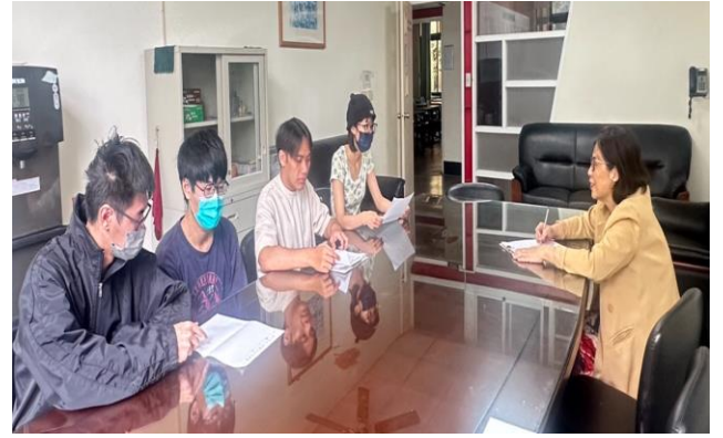
客家文化基因詞條小組檢核(第一組)