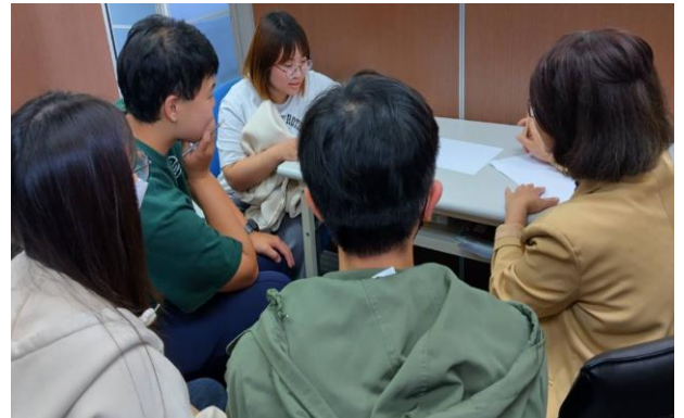
客家文化基因詞條小組檢核(第二組)