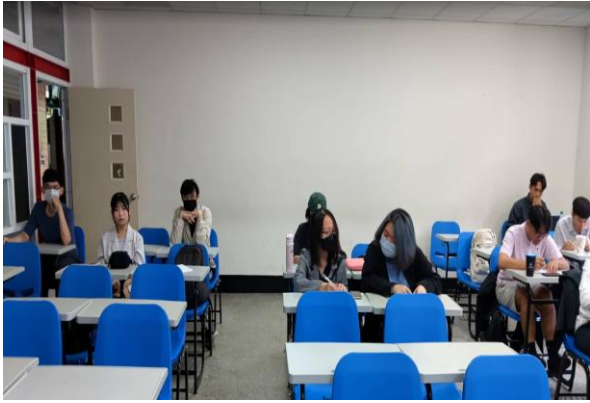
客家文化基因詞條撰寫 (說明)