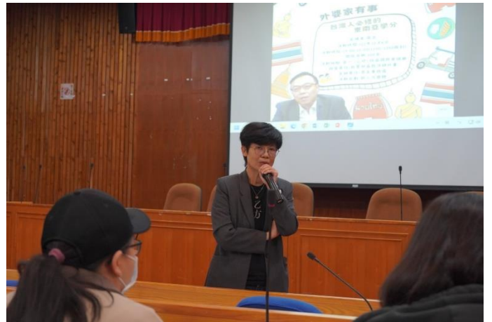
作家講座《外婆家有事：台灣人必修的東南亞學分》課程相關海報