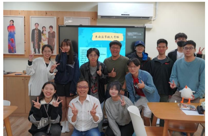
經驗共享工作坊-東南亞常識大考驗課程相關合照