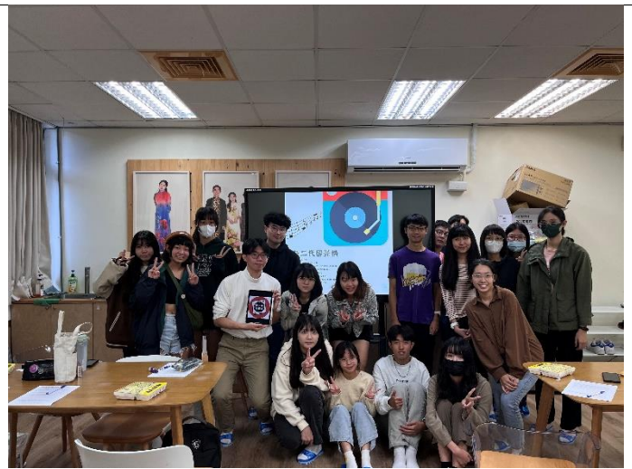
新三代同學個人經驗分享