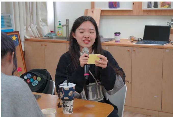
新二代學生分享設計的測驗題目