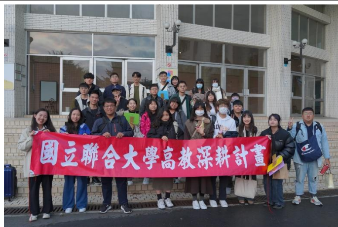
「新二代集合!」文化交流參訪課程合照