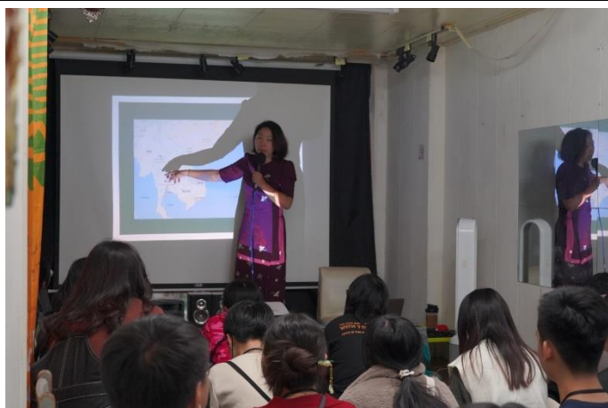
燦爛時光屋書店講座