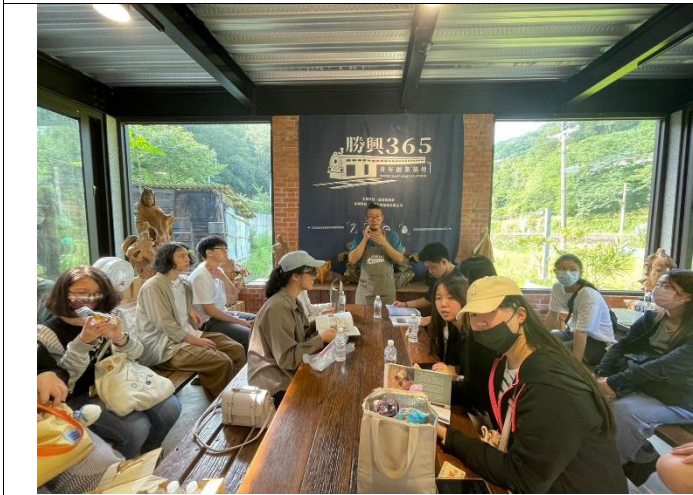
5月28日參訪 勝興365青創基地