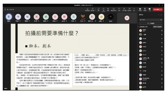
5月24日課程 行銷影音拍攝技巧