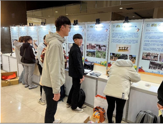
團隊成員布置展櫃