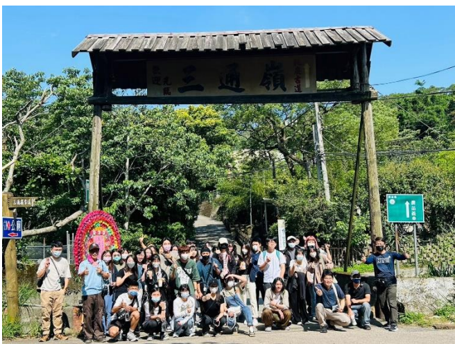
5月28日參訪 於挑炭古道前合照