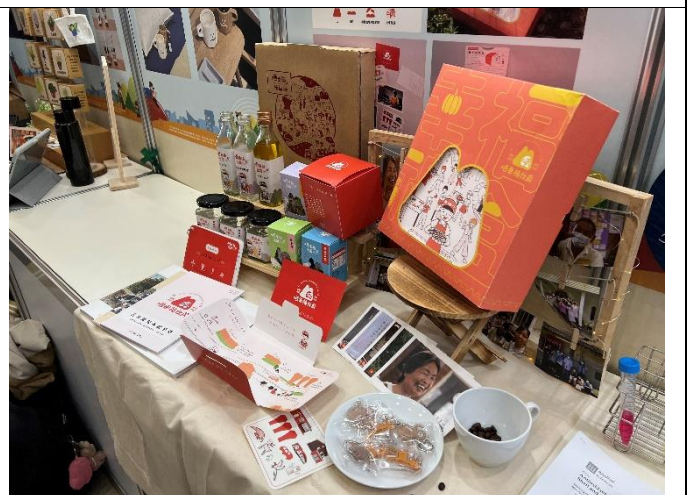
成果發表團隊展覽區