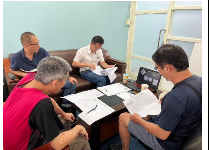
7月5日 第一階段線上審查會議