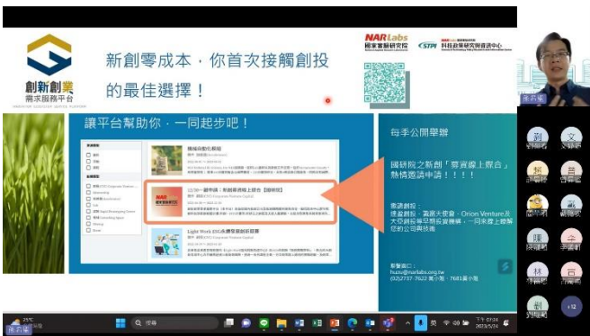
5月24日課程 創業基本功-創業營運計畫書撰寫