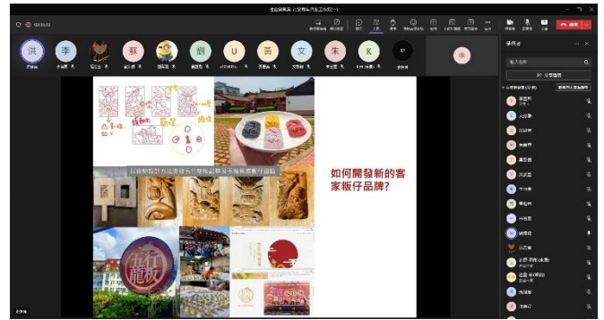
5月17日課程 苗栗物產與社區營造案例分享