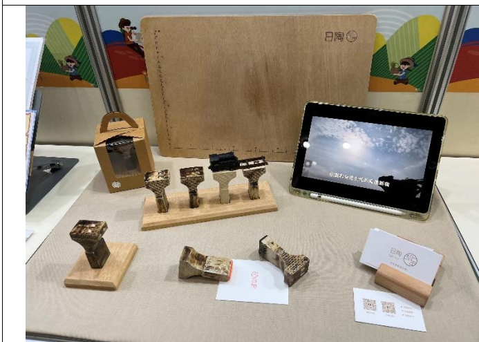
成果發表團隊展覽區