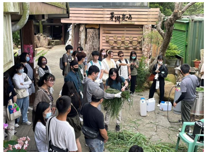
5月28日參訪 學員體驗剪香茅草