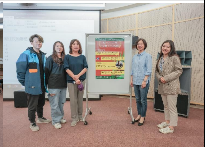
主講者、主持人與工作人員於活動後合影