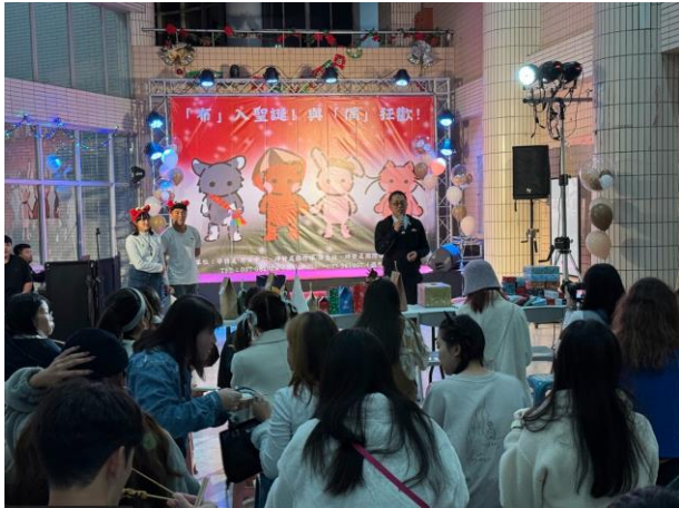
副校長進行活動開場

(請提供解析度 300dpi 以上 JPG 檔照片至少 4 張，且附上每張 30 字內之說明)