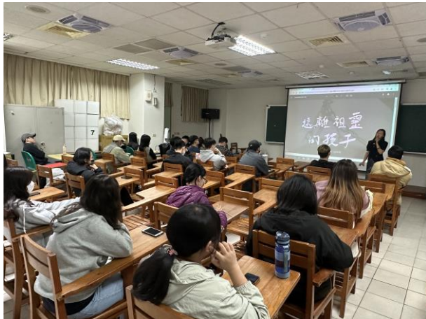
導演為記錄片分享賞析