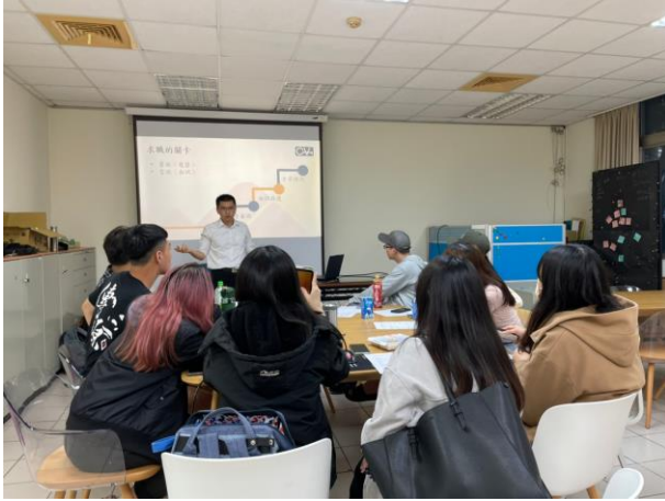
講師分享求職可能遇到的問題

(請提供解析度 300dpi 以上 JPG 檔照片至少 4 張，且附上每張 30 字內之說明)