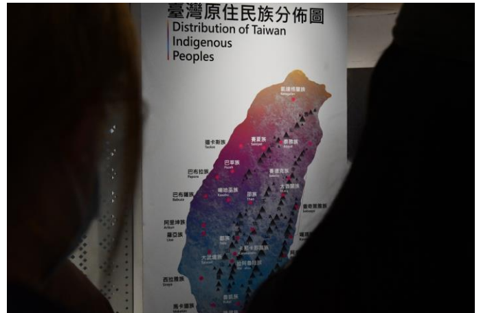
認識臺灣原住民族分布