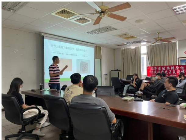
講師介紹轉型正義的意義