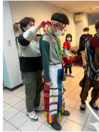
原住民學生協助日本交換生體驗原住民族服