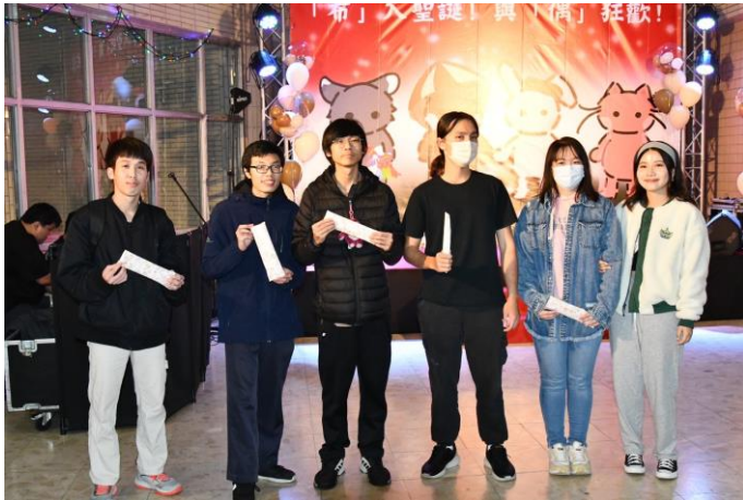
活動抽獎得獎者合影