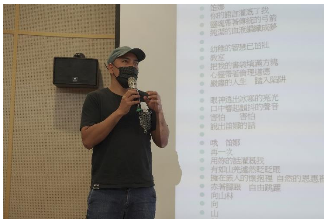
作家沙力浪介紹詩作〈笛娜的話〉