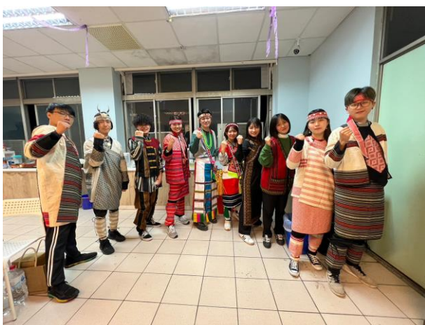
日本交換生體驗穿著原住民族服