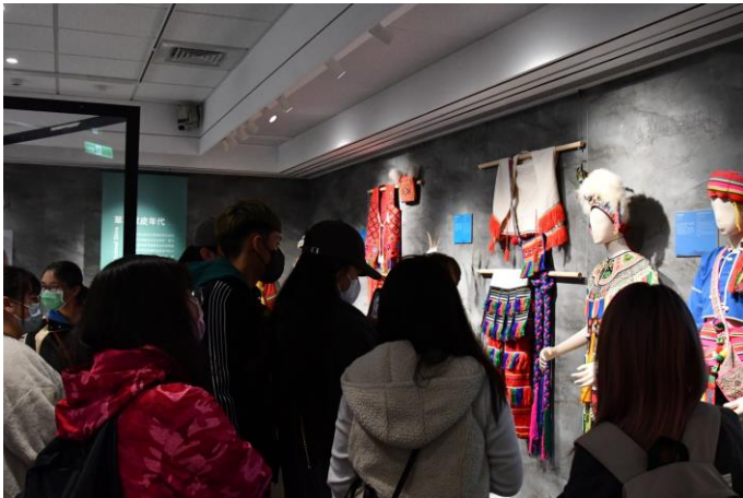
聽專業導覽員介紹族服