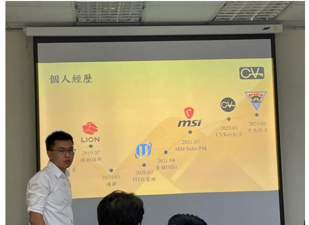
講師分享個人求職經歷