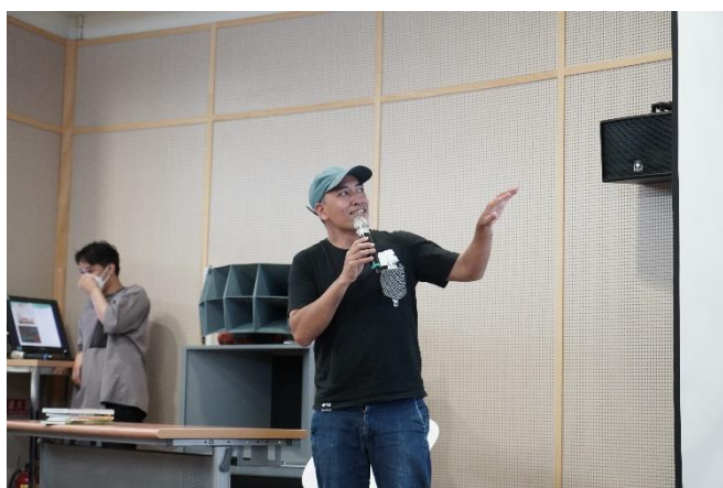
作家沙力浪生動精彩的演講