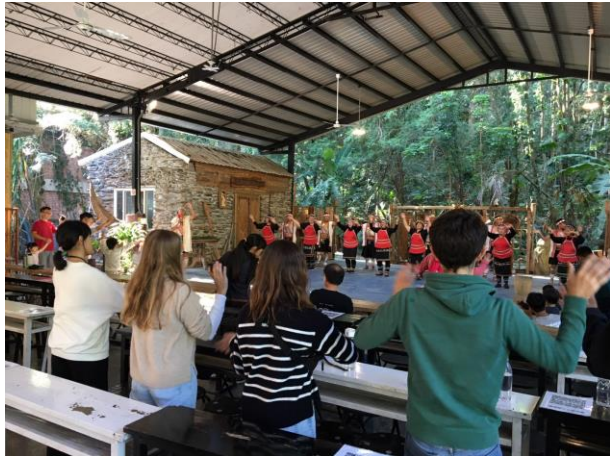
欣賞布農文化表演

(請提供解析度 300dpi 以上 JPG 檔照片至少 4 張，且附上每張 30 字內之說明)