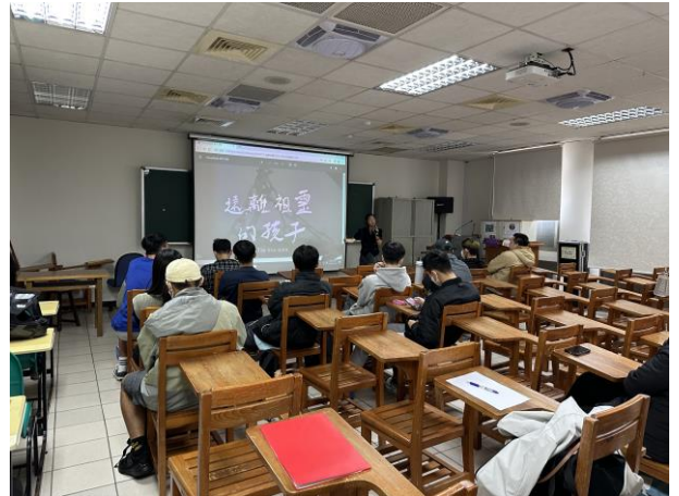
講師介紹拍攝的觀點