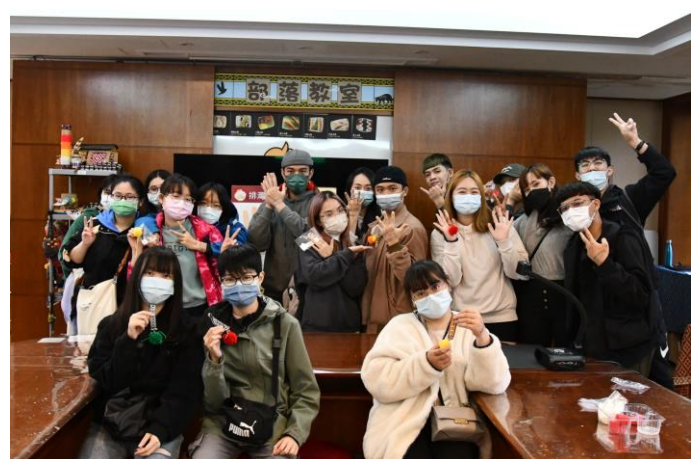
與圖騰手腕帶手作體驗成品合照