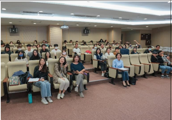
出席人員的大合照