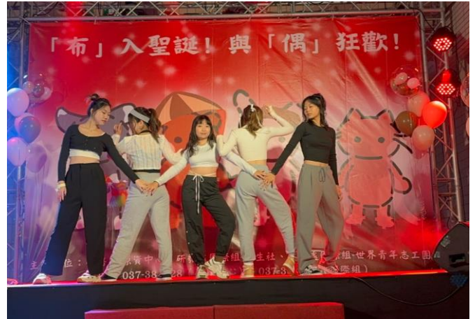
僑生進行熱舞表演