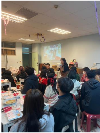
講師介紹小米酒製作過程