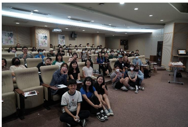
作家沙力浪與出席師生的大合照