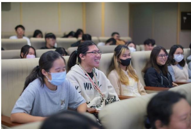
生動的演講獲得同學們的熱烈回響