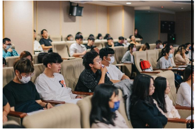
出席學生專注聆聽演講內容