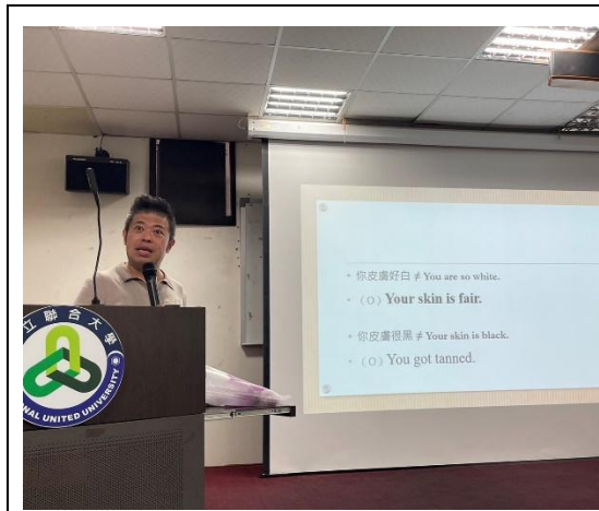
「文化密碼」講者授課情形