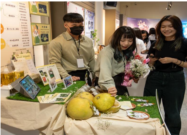
草田-植物再利用與設計