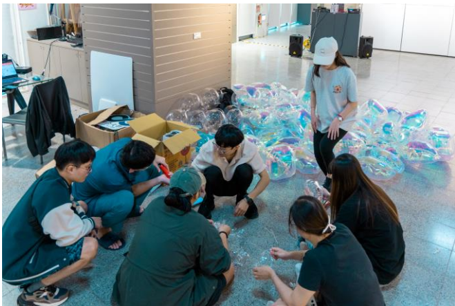
新苗-自然資源生態再運用實作體驗