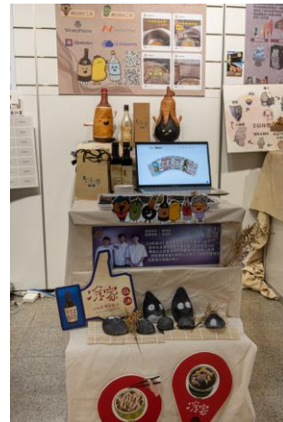
吉軒農場-植物再利用與設計