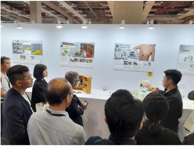
入圍金點新秀評審實地評圖