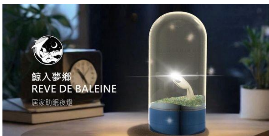
以療癒為核心設計目的而設計的居家燈飾。

國立聯合大學工業設計系 32 位畢業生，透過應用所學的設計，改善生活中或大或小的不便之處。經過一步一步的設計方法、流程，讓同學們充分展現四年來在設計歷練中，淬煉出的精彩成果。除了校內實體展出，也在台北南港展覽館的新一代設計展展出。