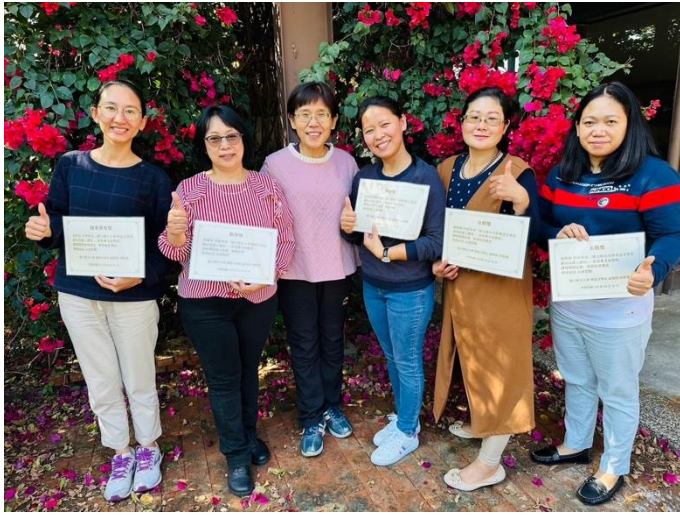
此照為頒獎勉勵新住民八週認真學習線上中文教材，以頒此狀，以茲鼓勵。