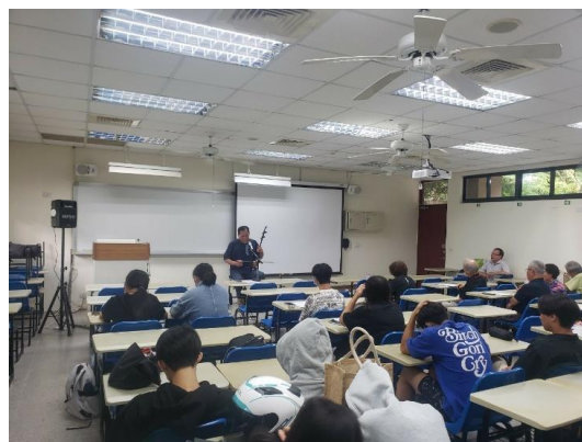
1009 學生先熟悉老山歌曲調