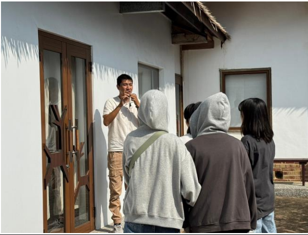
導覽五感體驗其中的嗅覺，門上的孔 透出藺草香氣