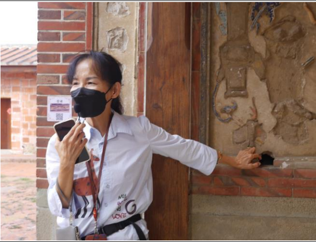
導覽蔡氏濟陽堂百年古蹟(一)