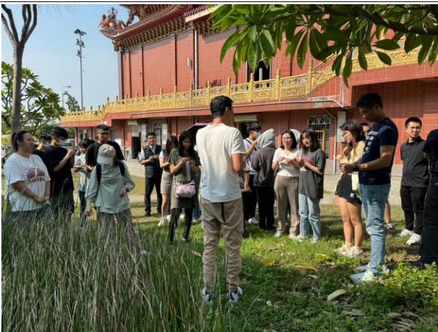
蘭草學會介紹蘭草的外觀(一)