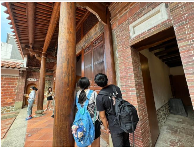
學生仔細觀察古蹟的建築架構