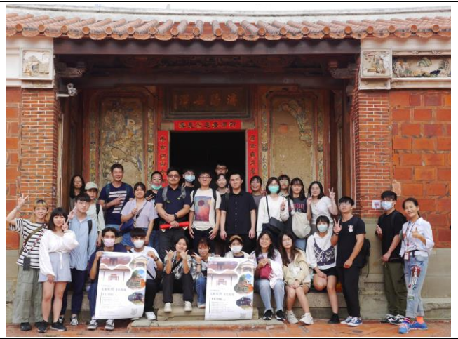
蔡氏濟陽堂活動大合照