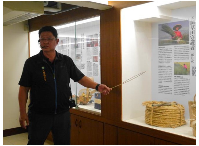
蘭草文化館理事長為本校師生講解 蘭草文化由來(二)