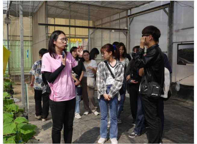
導覽人員介紹愛情果園種植植物