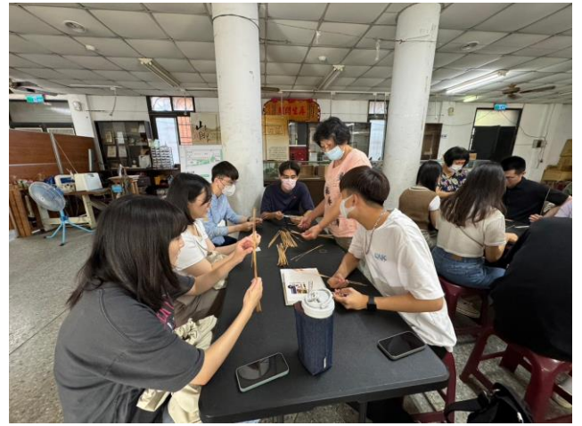
由工藝師帶領師生製作 DIY(二)