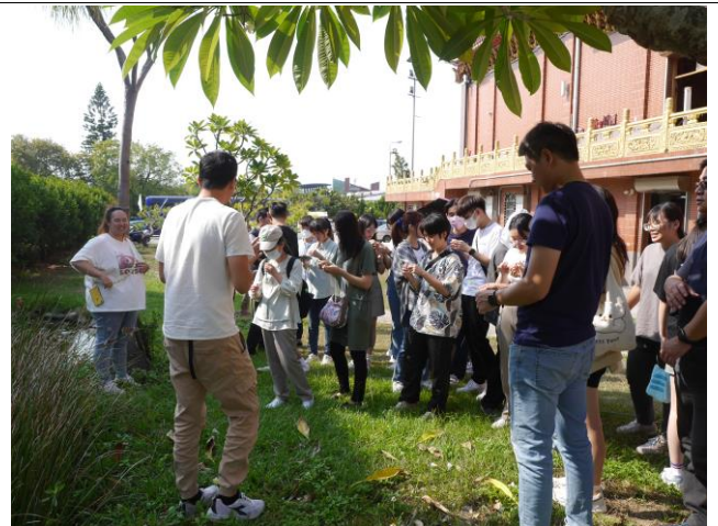
蘭草學會介紹蘭草的外觀(二)