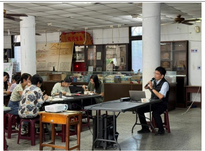
工設系洪老師分享 USB 計畫