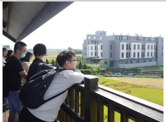
師生於觀景台俯瞰稻穗繪畫