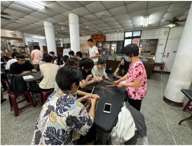
由工藝師帶領師生製作 DIY(一)