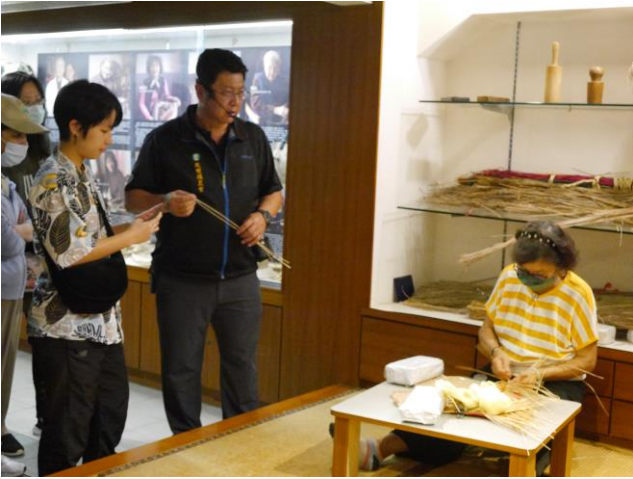
蘭草文化館現場工藝師展演編織