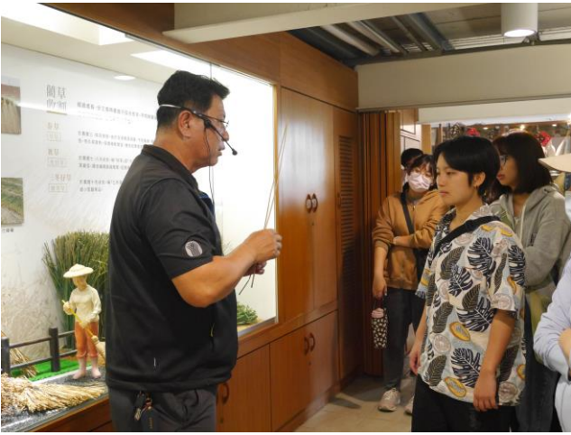
蘭草文化館理事長為本校師生講解 草文化由來(一)