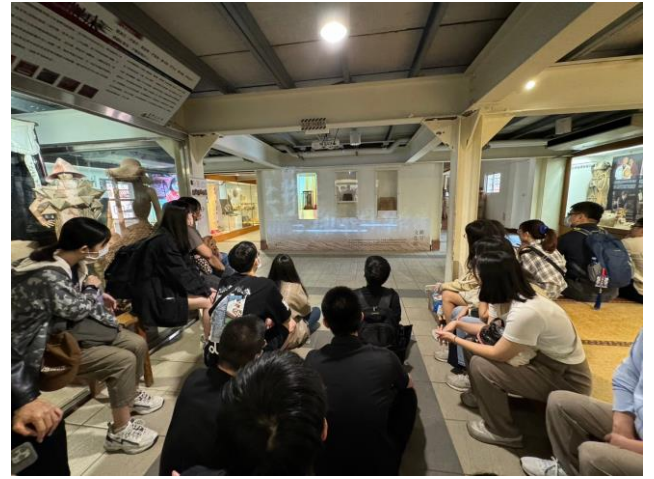
觀看本校工設系製作的光雕影片