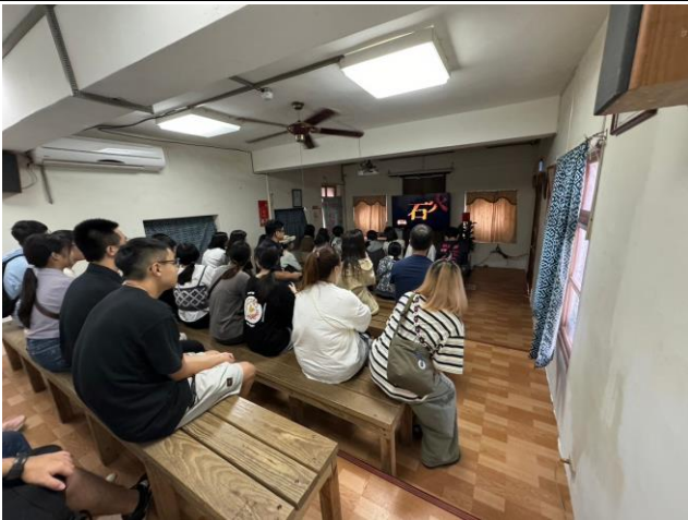
金良興磚廠導覽影片