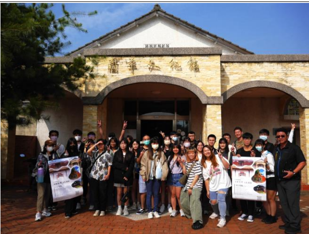
蘭草文化館活動大合照