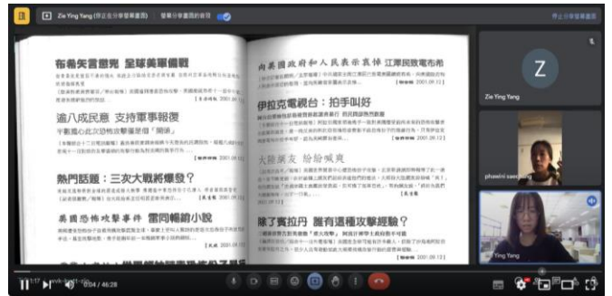
新住民華語教育課程內容— 新聞華語