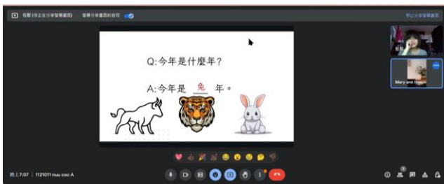
新住民華語教育課程內容— 生活華語