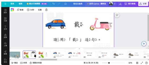
新住民華語教育課程內容— 詞彙認識