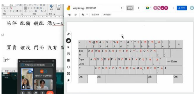
新住民華語教育課程內容— 注音打字練習