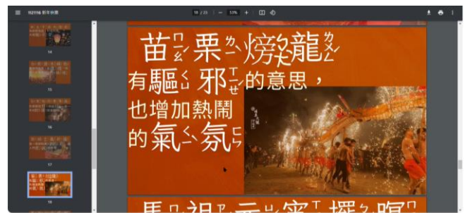
新住民華語教育課程內容— 臺灣文化