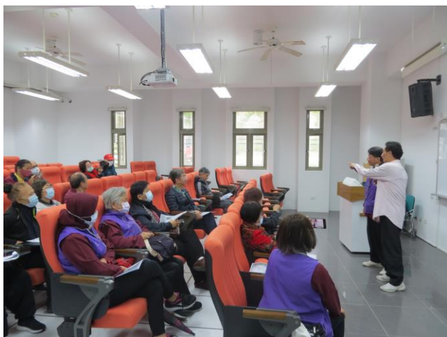
主講與聽者的互動開場