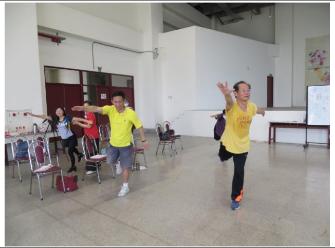
努力練習的學員們