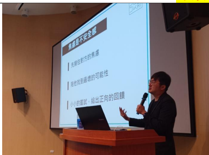
講師講解本次課程活動內容(1)