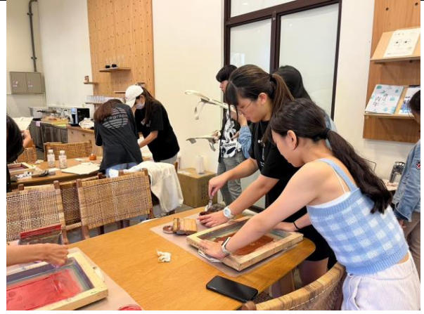
學生進行拓印手提便當袋(一)