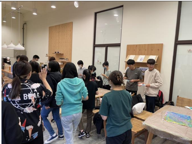
學生們換桌完成別組的畫作