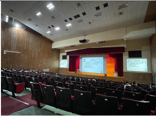
學生進行測驗(二) 二坪山校區大禮堂