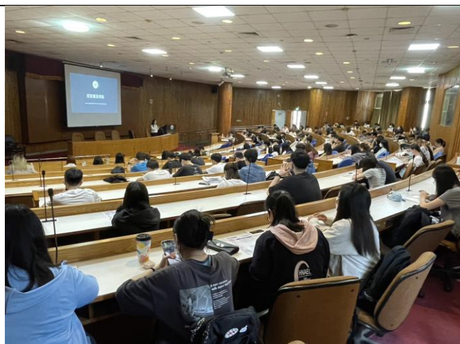
帶領學生探索職涯規劃