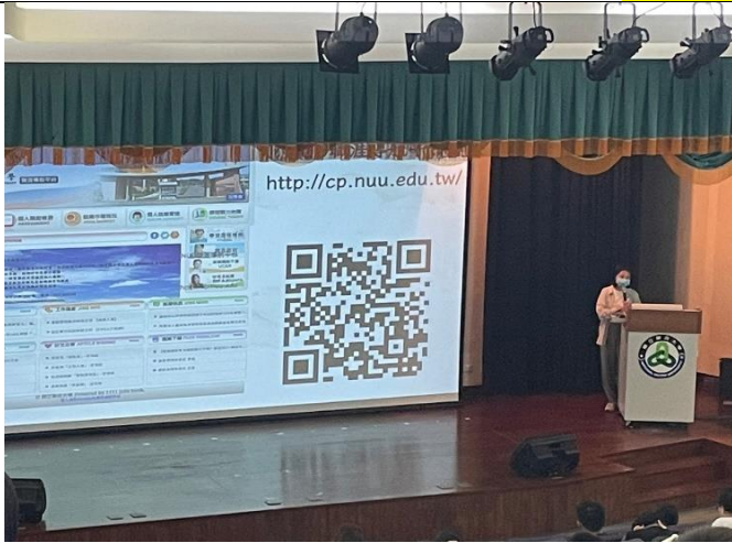
介紹 UCAN 大專校院就業職能平台-職業 興趣探索測驗