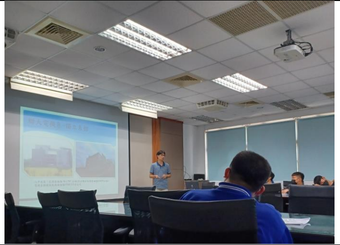
系主任講解本次參訪內容