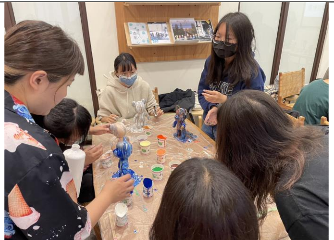
學生各自製作流體熊