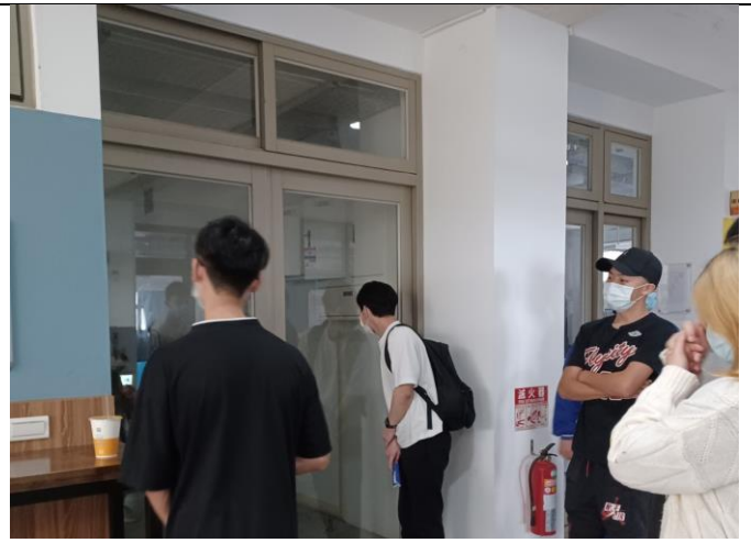
帶領學生參觀系上專業教室