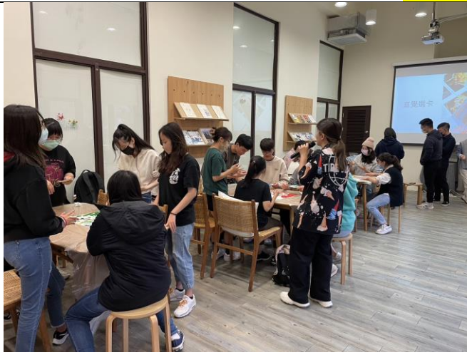
講師講解本次課程活動