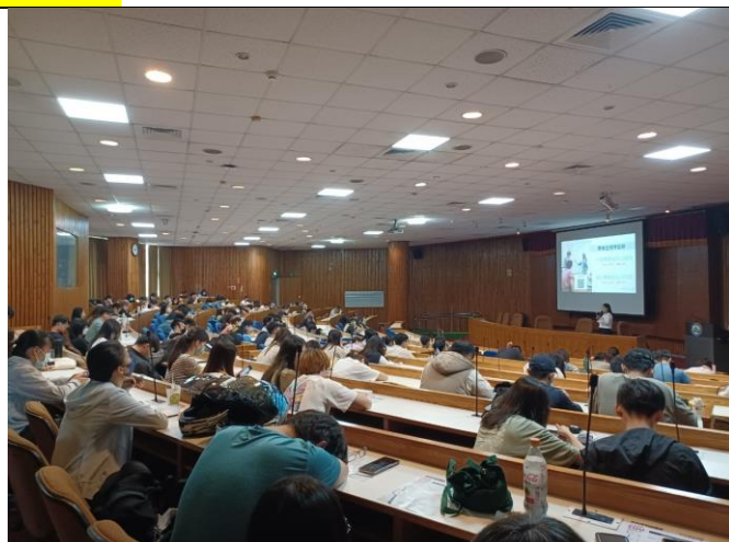
講師講解本次課程活動內容(2)