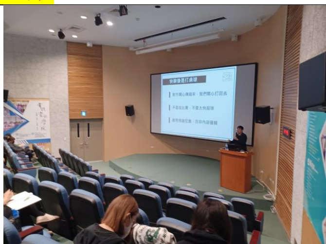
講師講解本次課程活動內容(2)