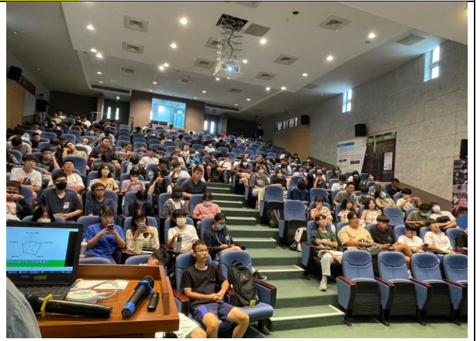
學生進行測驗(一) 八甲校區 B3-228 演 講廳