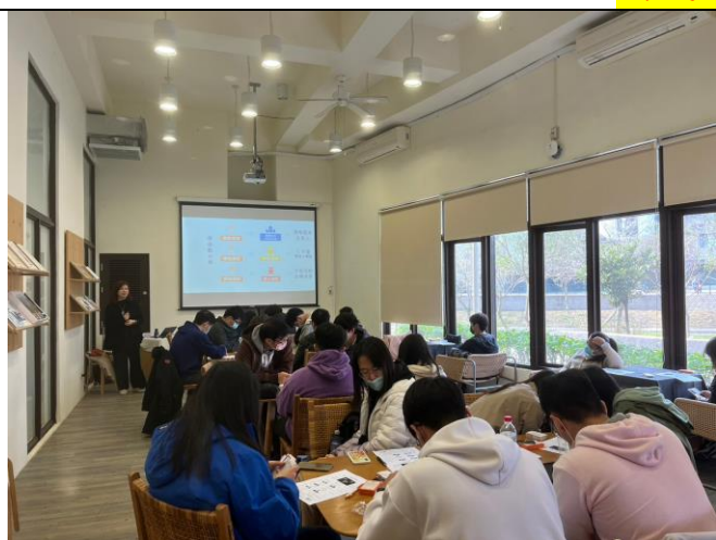
講師講解本次課程活動內容