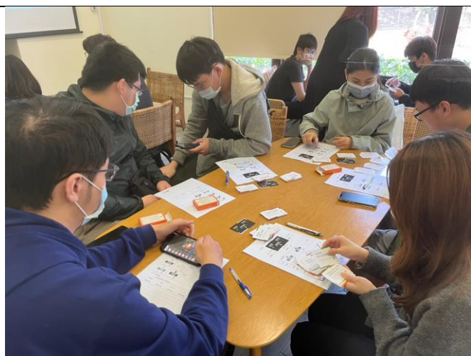
學生們利用小卡填寫學習單