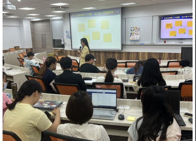
講師針對課程進行講解