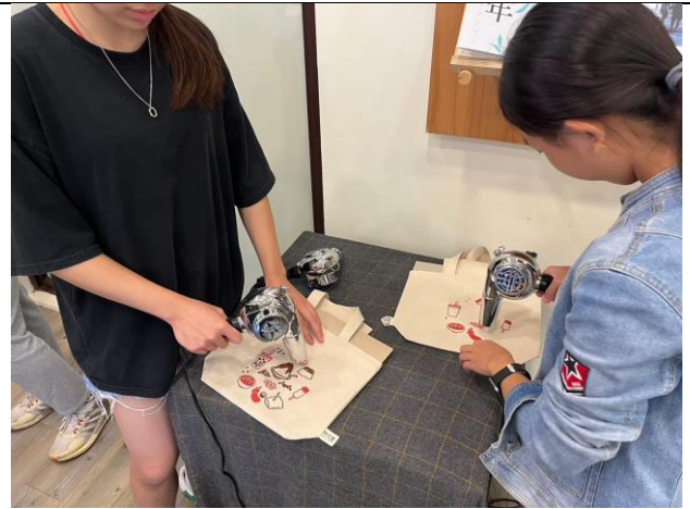
學生透過吹風機加熱作品