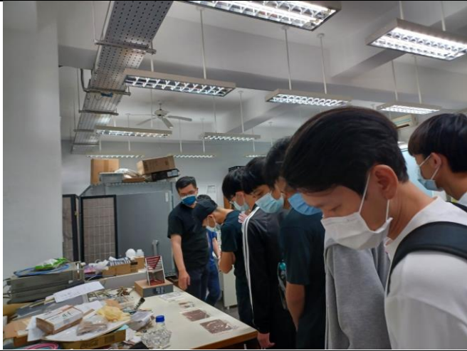
帶領學生參觀實驗室