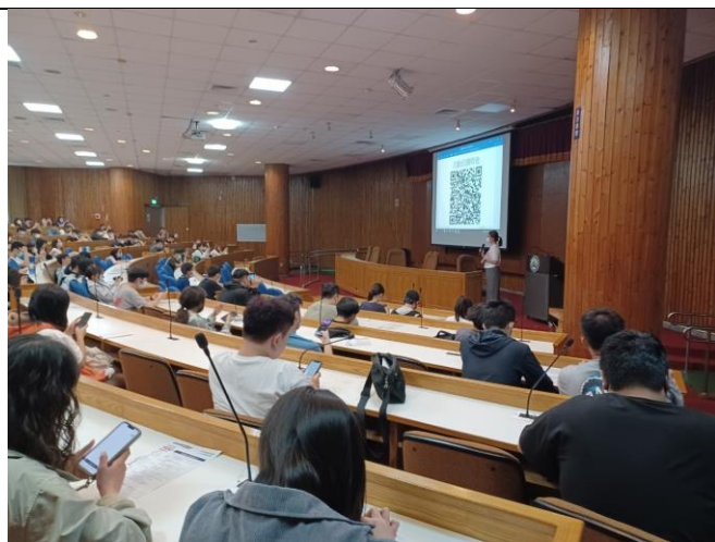
學生填寫回饋問卷