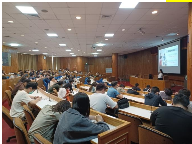
講師講解本次課程活動內容(1)