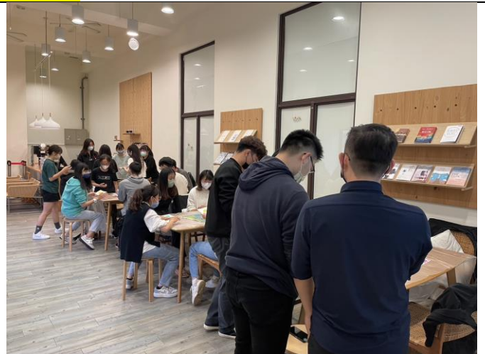
學生們合作完成一幅畫