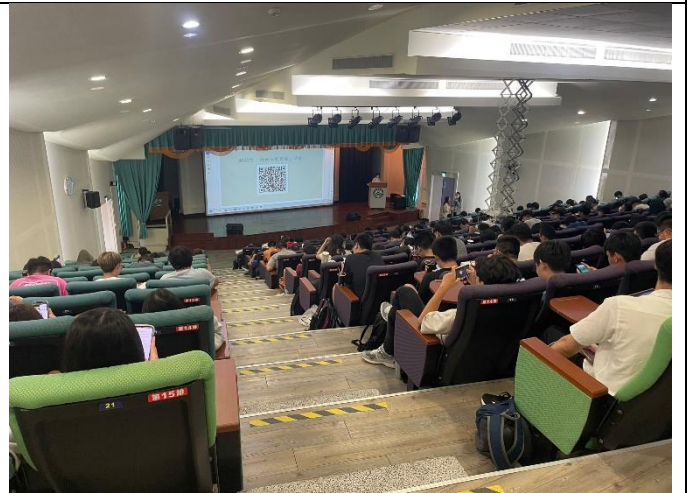
學生進行測驗(三) 八甲校區國際會議中 心