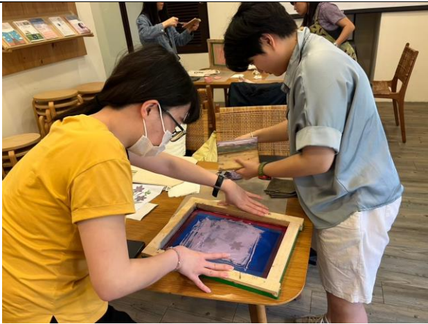
學生進行拓印手提便當袋(二)