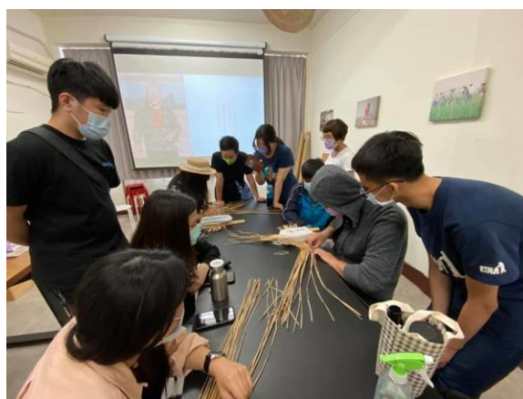
實作工作坊及藺編技藝實作