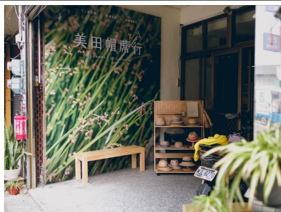
協助美田帽蓆行設計的藺編故事牆以及藺編商品展示架(讓過路客易於辨識及試戴商品)