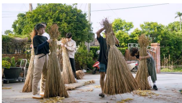
學生參與藺草採收及曬草