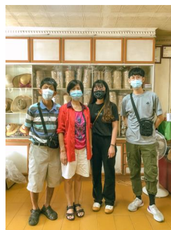
學生訪談美田帽蓆行的合照