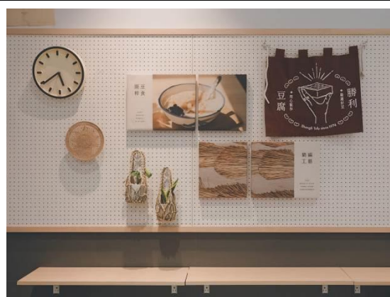
協助原豆粹食設計的藺編故事牆及藺編道具