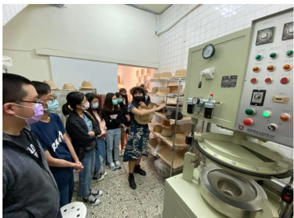
參訪苑裡藺子工作室及特色店家