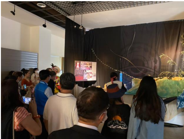
畢業成果展覽〈祈·視〉作品解說