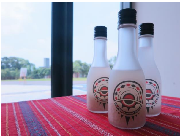
畢業成果展覽〈祈·視〉公關品—小米酒