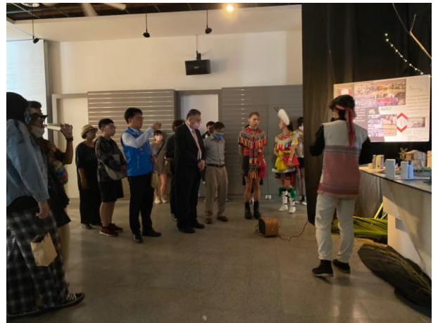
畢業成果展覽〈祈·視〉作品解說