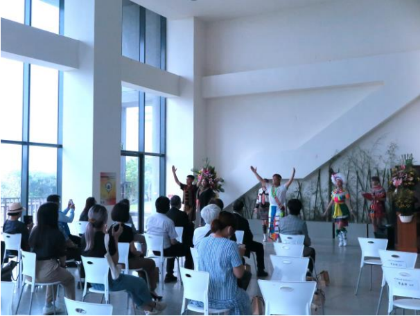
畢業成果展〈祈·視〉開幕儀式