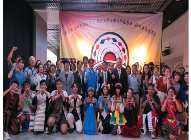
畢業成果展〈祈·視〉開幕合影