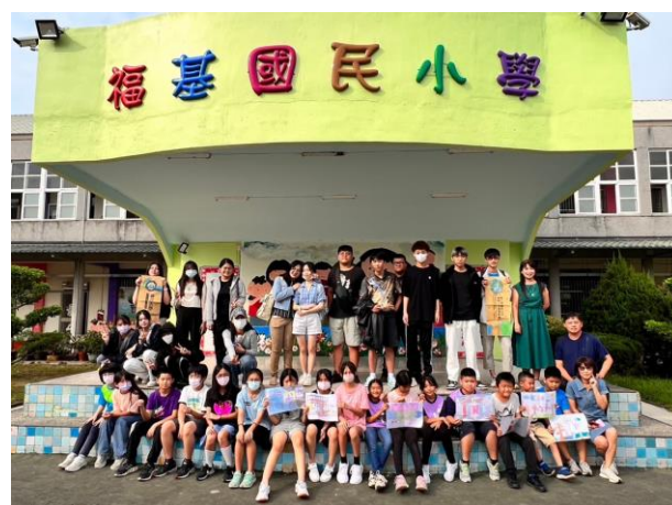
與拿著成果圖片的小學生團體合照