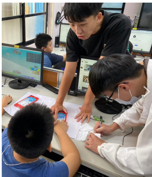
利用 ArcGIS StoryMaps 製作地方故事地圖