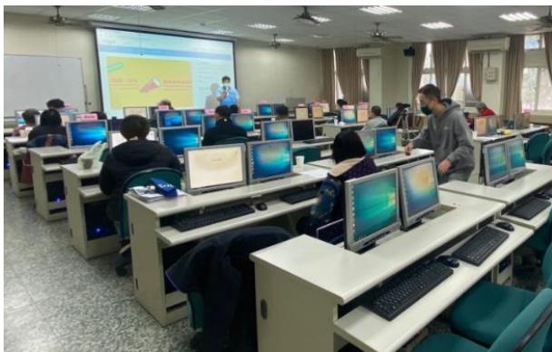
企業知識數據訓練課程(三)