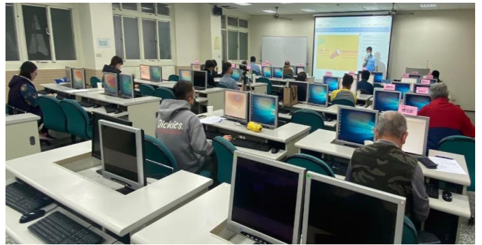
企業知識數據訓練課程(三)