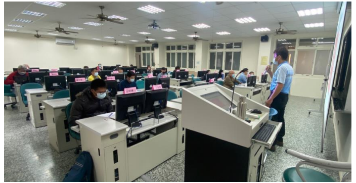
企業知識數據訓練課程(三)