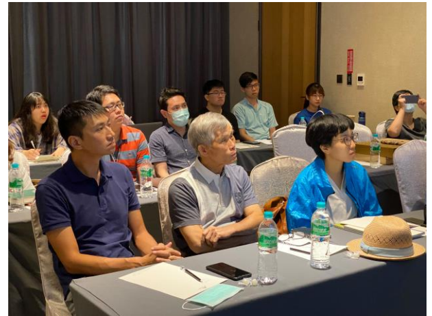
台灣藺草學會黃理事長及經理蒞臨 參與