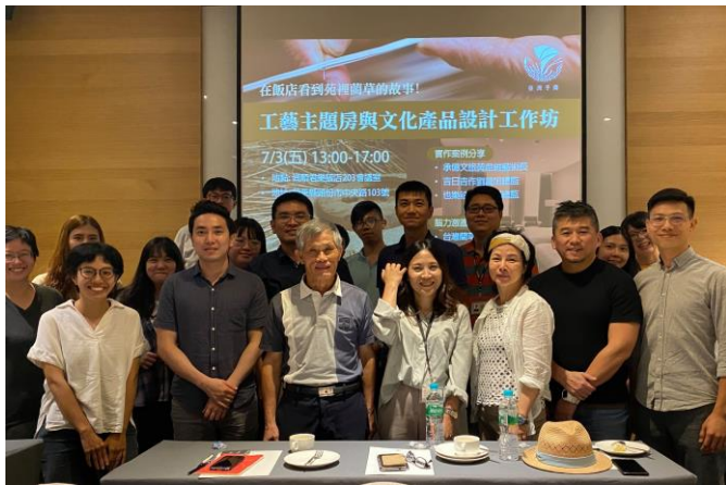
7/3 工作坊活動參與者合照