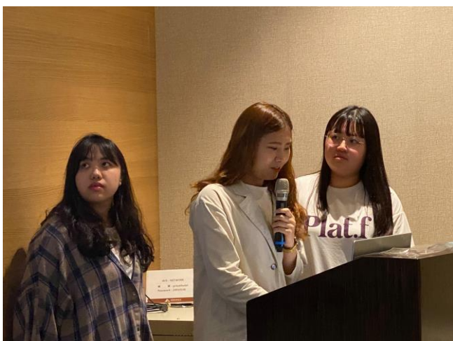
聯大工設系學生簡報初步規劃