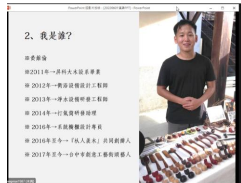
講師介紹自身經歷