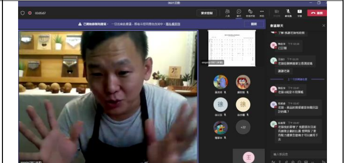
Q&A 時間學員提問情形