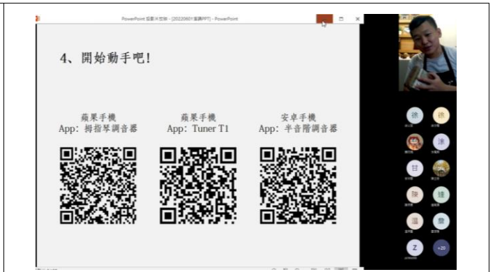
介紹條音器及如何調音