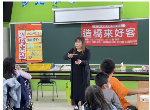
竹板節奏搭配客語唸謠和客家棚頭。