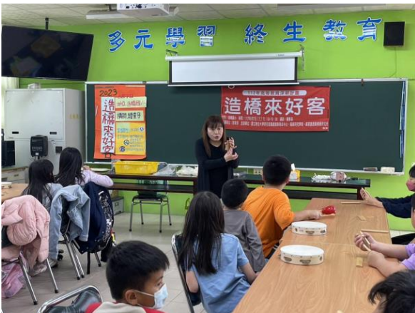
客家竹板如何操作之教學。