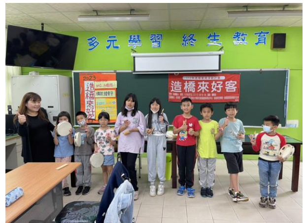
「羊咩咩」鈴鼓演奏和「月光光」竹板表演，2組演出都很棒。