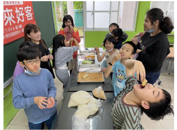
「客家糍粑當好食」說出通關密語立即享用。