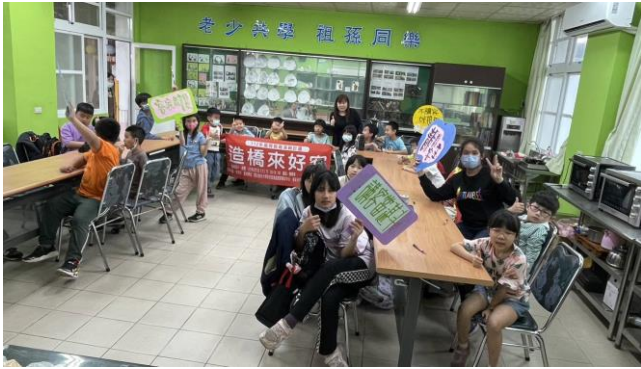
過關的小朋友拿著通關密語勝利合影。