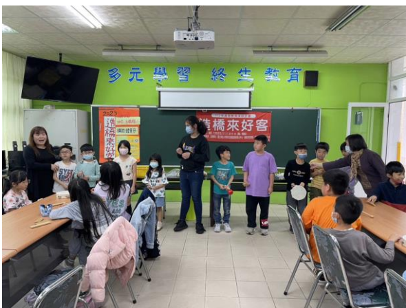
一人一句客家棚頭「問卜」邊說邊笑好有趣。