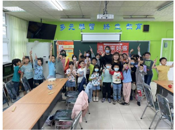
小朋友都學會如何打竹板了，演出後開心的合影。