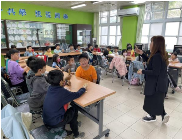
「羊咩咩」唸謠說起客家米食與習俗信仰。