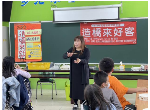
竹板節奏搭配客語唸謠和客家棚頭。