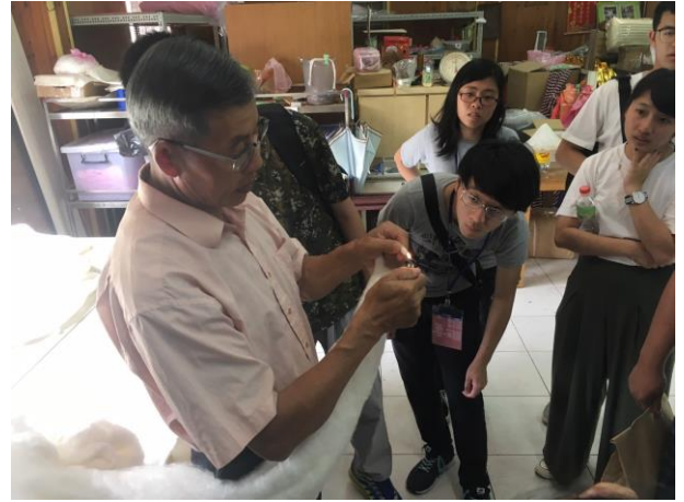
產業參訪：獅潭泉明蠶寶寶生態教育農場