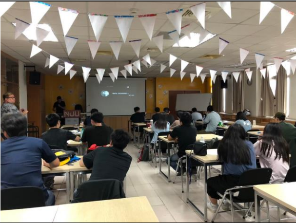
創業基本功：手機拍攝、剪輯教學