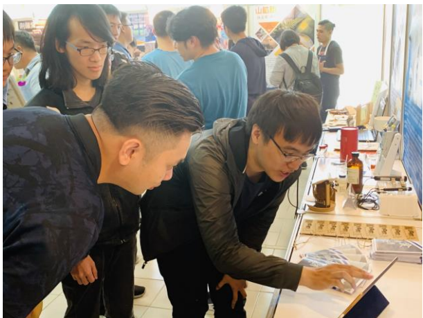
團隊解說及展示成果