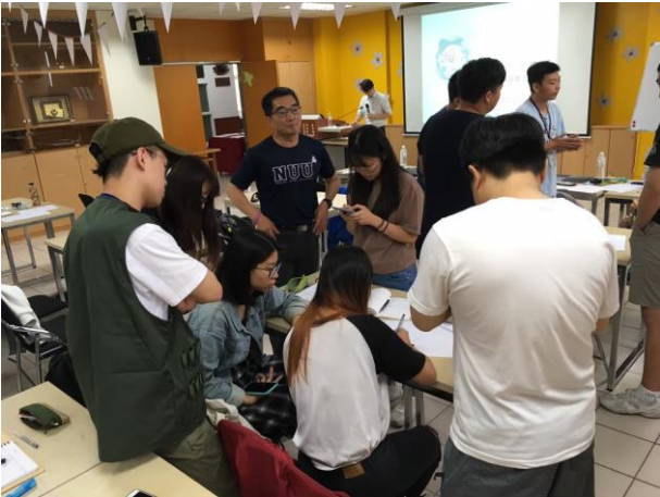
創業基本功：創業營運計畫書撰寫