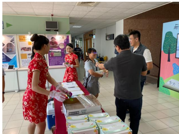
苗栗縣政府長官出席