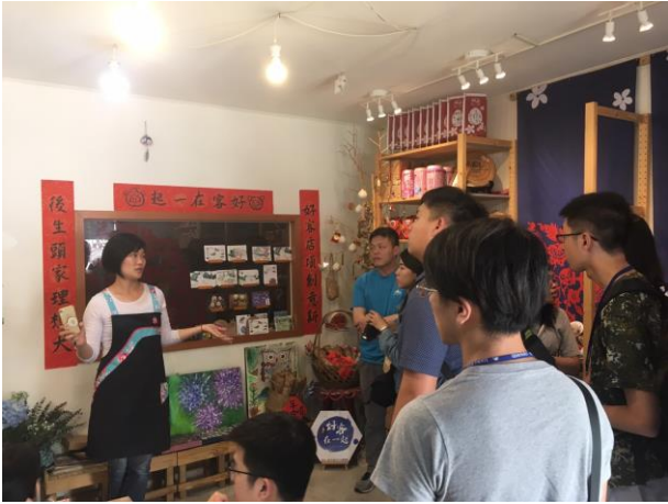
產業參訪：南庄好客在一起