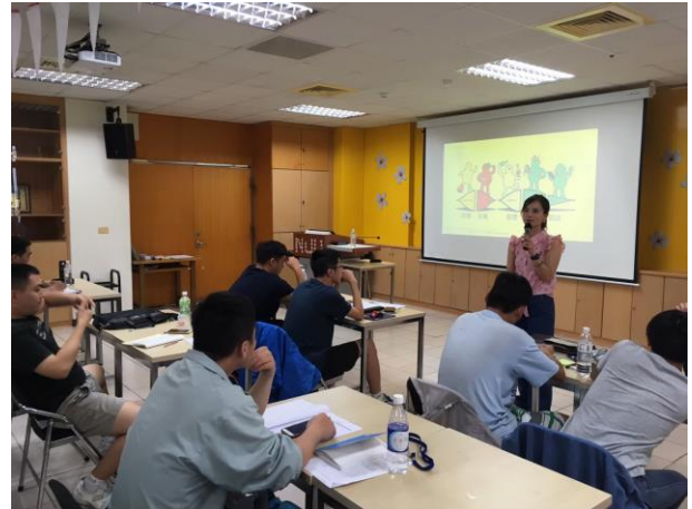
創業基本功：產品設計發想與實踐