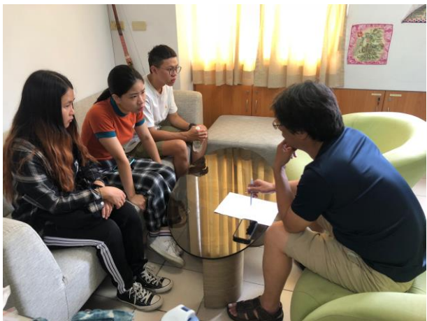
第二階段執行團隊諮詢服務