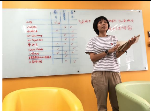
第二階段執行團隊工作會議