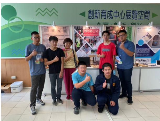
團隊與指導老師開心地於展區前合影