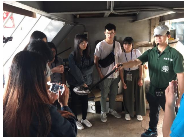
產業參訪：銅鑼東華百年樟腦廠 (綺緣觀光園區)