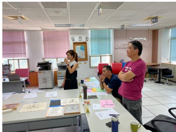
第二階段執行團隊成果評審會議