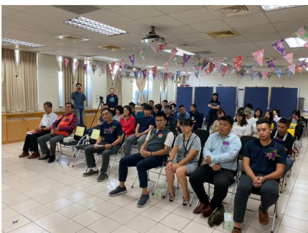
頒獎典禮出席嘉賓