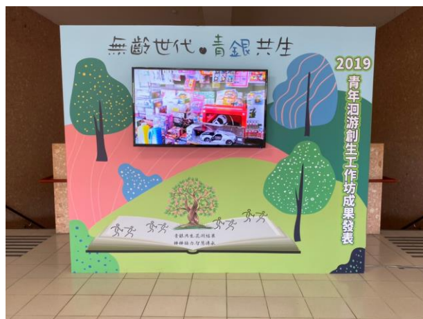
成果發表會影片展示區電視牆