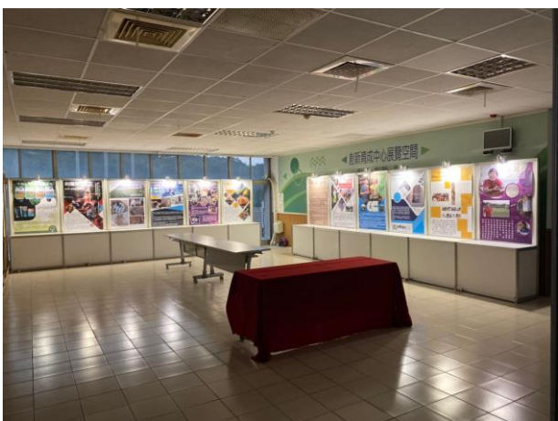
成果發表團隊展覽區