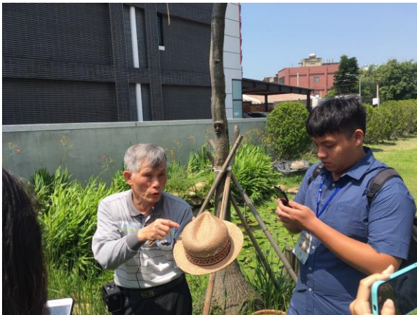
產業參訪：苑裡台灣蘭草學會