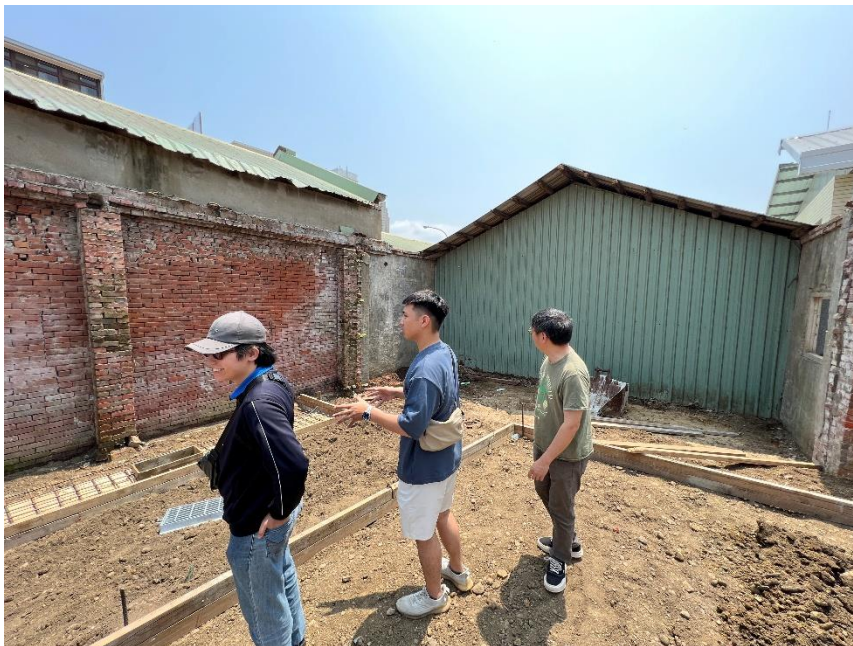
說明：瞭解銅鑼 1895 文化生活館的整修目標與需求