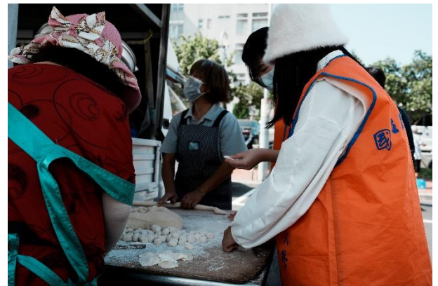
活動前協助攤位準備