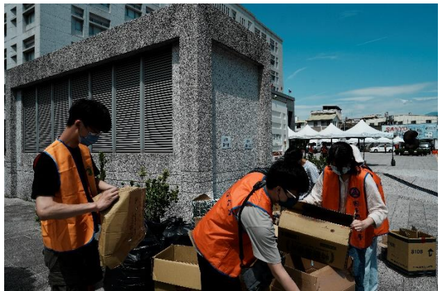
活動結束後，協助環境整理