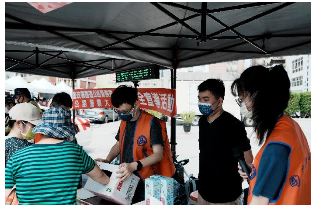
聯合大學的宣導攤位