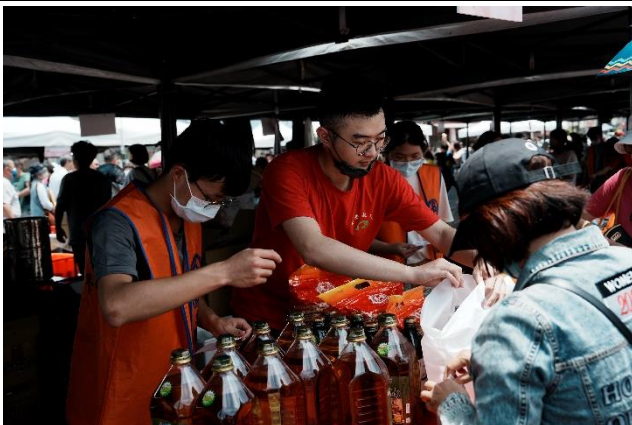
協助攤位義賣的志工同學