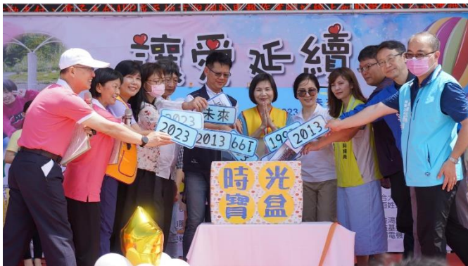
嘉賓進行歷史回顧儀式