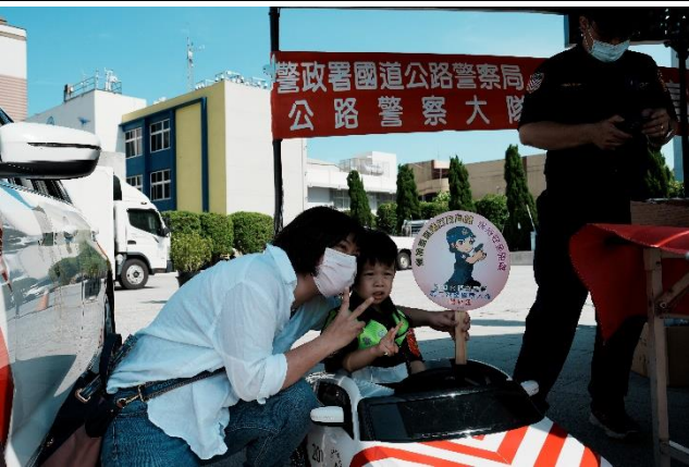
交通安全宣導單位與民眾互動