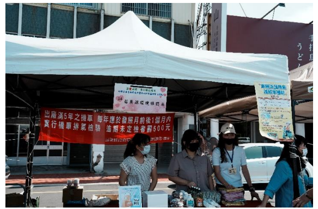
宣導環境保護的攤位