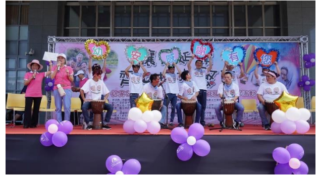
幼安住民的團體表演