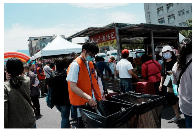
活動中協助場地整潔的同學