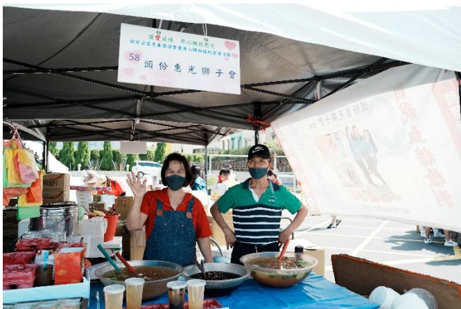
義賣攤販向民眾展示商品