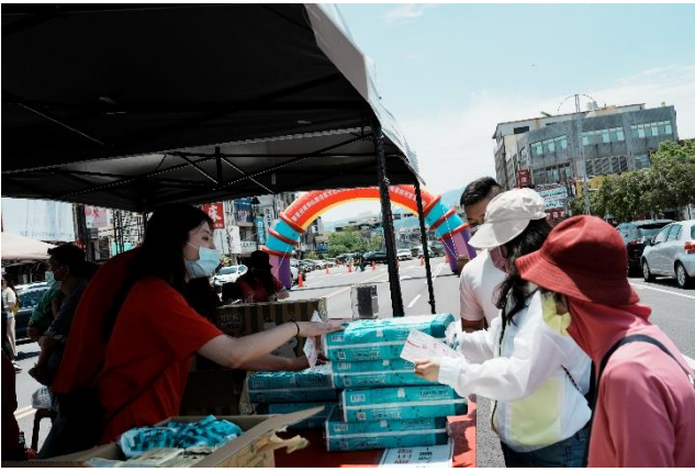
民眾使用園遊卷購買商品