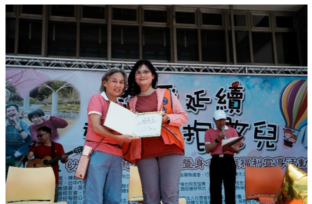
雅愉老師代表聯合大學 接受感謝狀