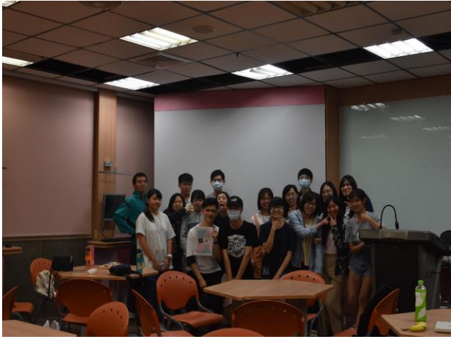
培訓營全體大合照