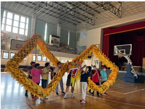
8/30~為 9/1 舞龍表演彩排