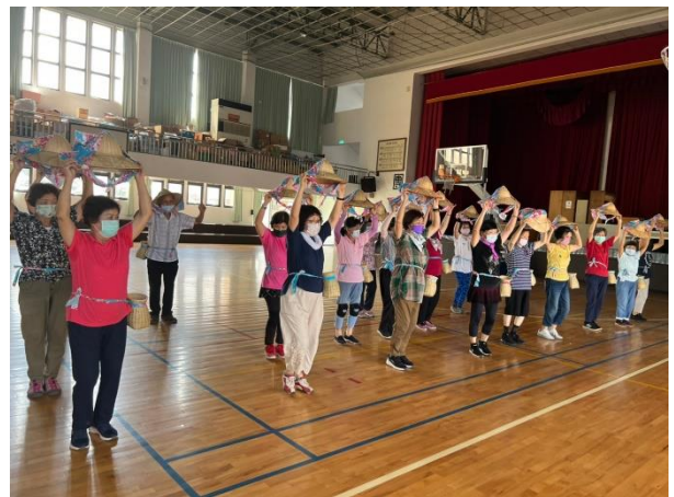
8/30~為 9/1 採茶舞表演彩排