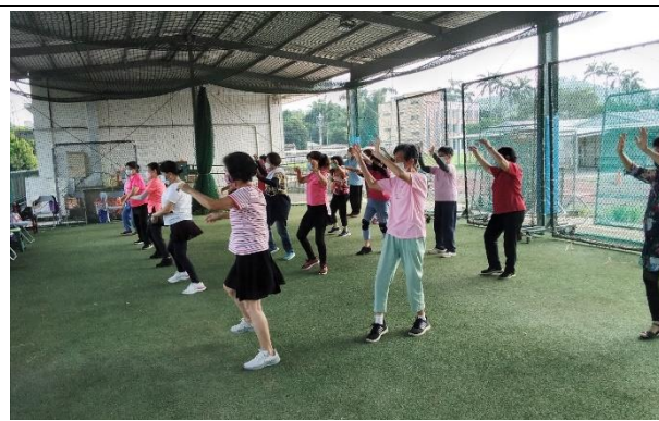
8/9 啦啦隊舞自主練習