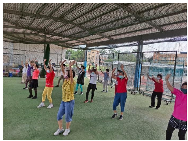
8/16 啦啦隊舞蹈自主練習