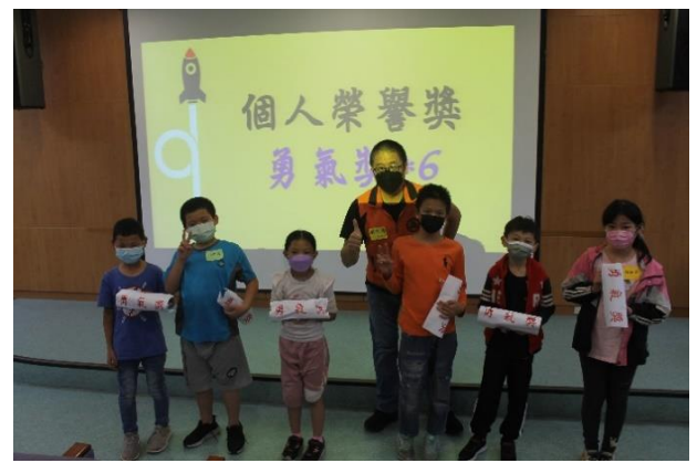
榮耀時刻~個人榮譽-勇氣獎