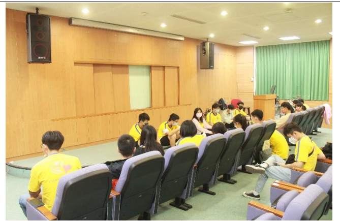
雅愉老師帶領志工進行活動反思