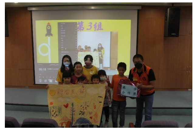
榮耀時刻~團體競賽—最佳合作獎