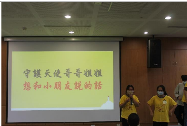
守護天使姐姐雅晴瑋瑋 肯定小朋友的努力