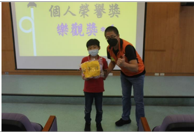
榮耀時刻~個人榮譽獎-分享獎