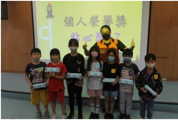
榮耀時刻~個人榮譽-貼心獎