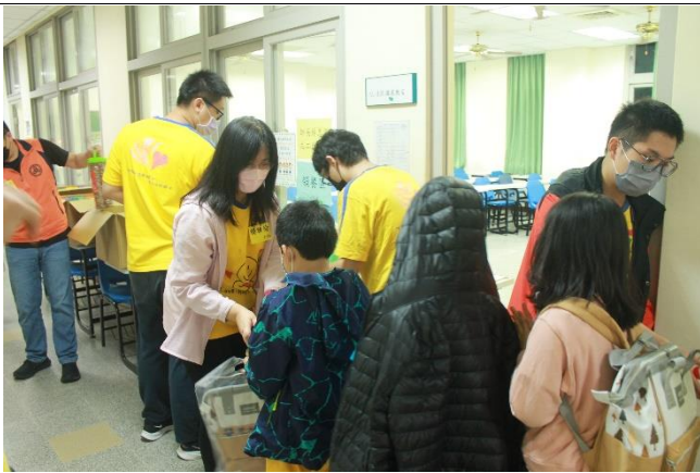
雅愉老師發送餐點給小朋友