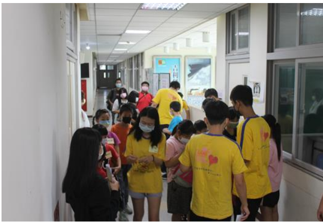
隊輔帶領小朋友分組