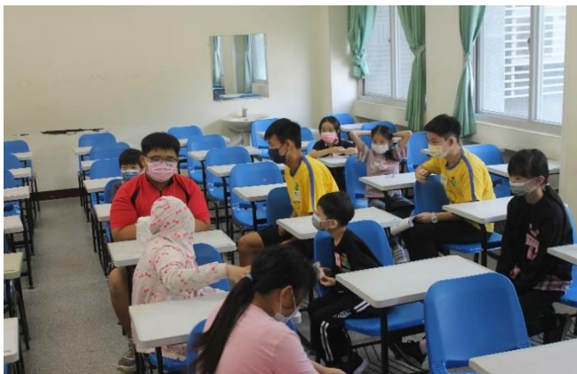
小組時間—彼此自我介紹