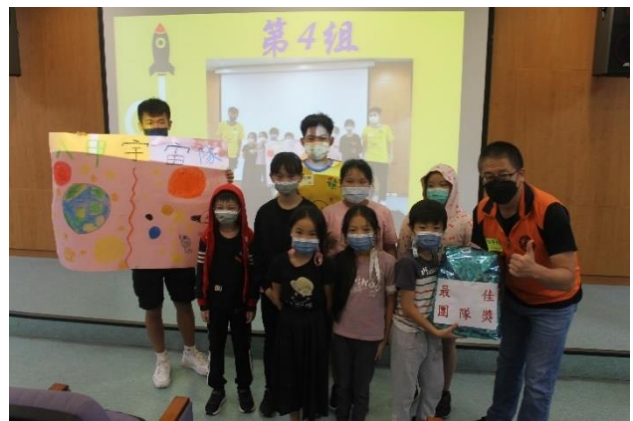
榮耀時刻~團體競賽—最佳團隊獎