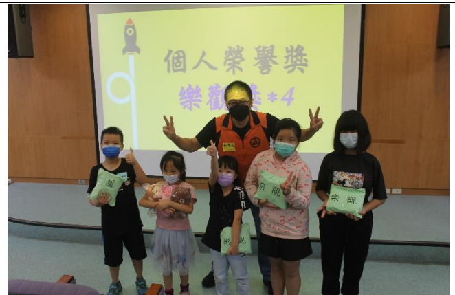
榮耀時刻~個人榮譽-樂觀獎