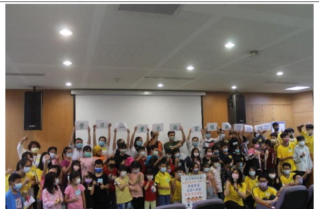
大朋友小朋友開心大合照