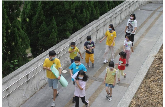
隊輔帶領小朋友跑關