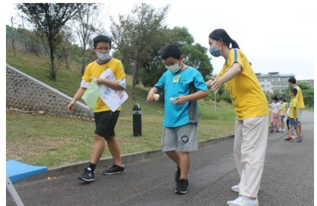
大地遊戲—十拿九穩