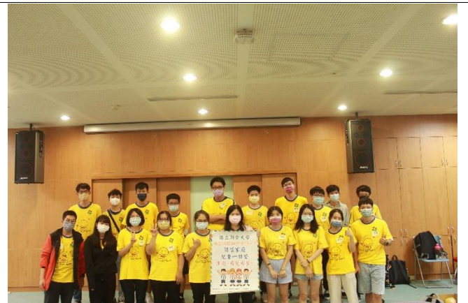
守護天使志工大合照~大家辛苦了!