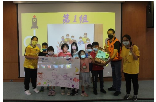
榮耀時刻~團體競賽—最佳活潑獎