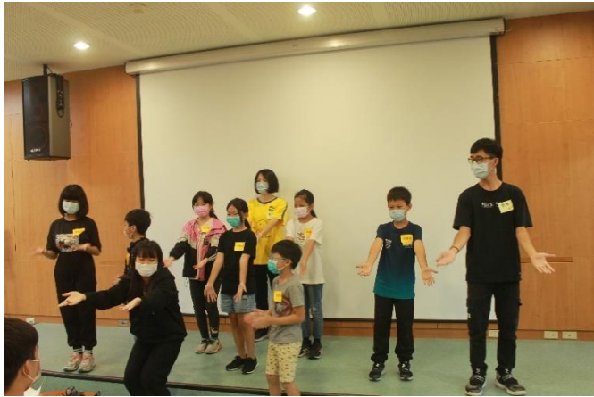
隊呼 show time