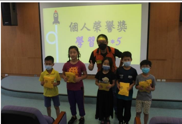
榮耀時刻~個人榮譽-學習獎