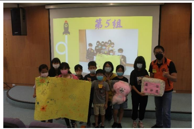
榮耀時刻~團體競賽—最佳精神獎