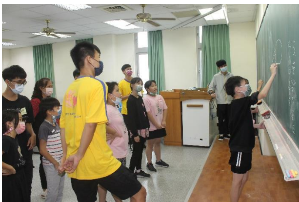
大地遊戲—猜猜畫畫