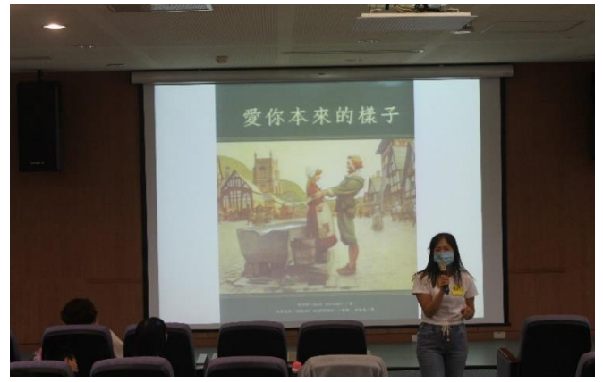
品格教育—說故事時間