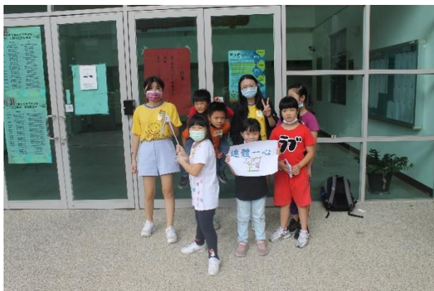
大地遊戲—連體一心