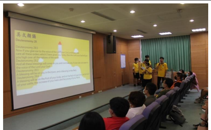
表演節目—守護天使志工英文朗誦