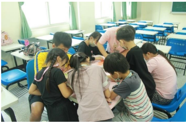
小組時間—設計隊旗