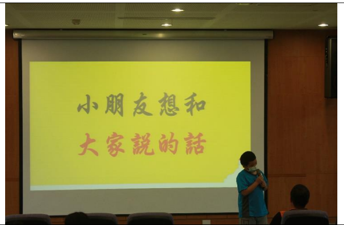
小朋友分享今天的學習 與感謝聯大師生