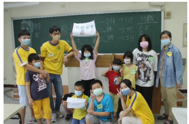
大地遊戲—百發百中