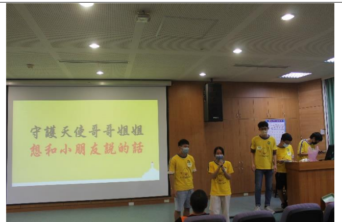
守護天使志諺哥哥秣瑄姐姐 鼓勵小朋友繼續加油