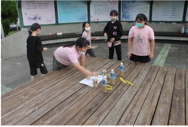
大地遊戲—套住夢想