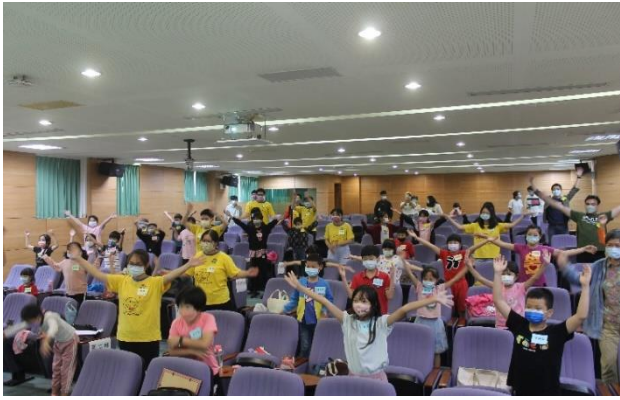
表演節目—小朋友跳健康操