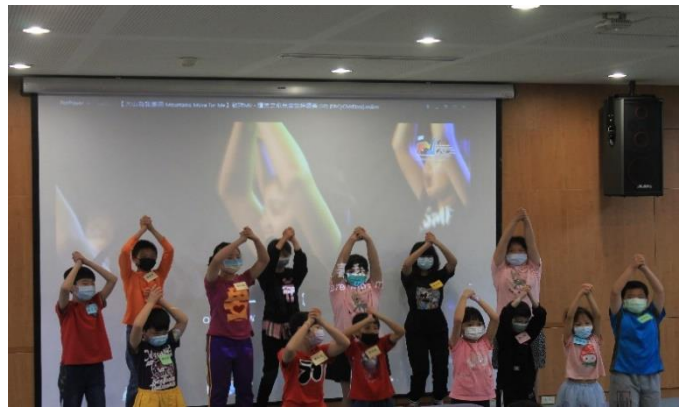
表演節目—福星小朋友表演