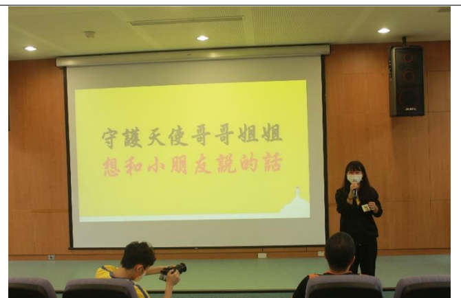
守護天使韶恩姐姐 為小朋友的表現喝采