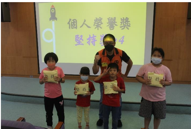
榮耀時刻~個人榮譽-堅持獎