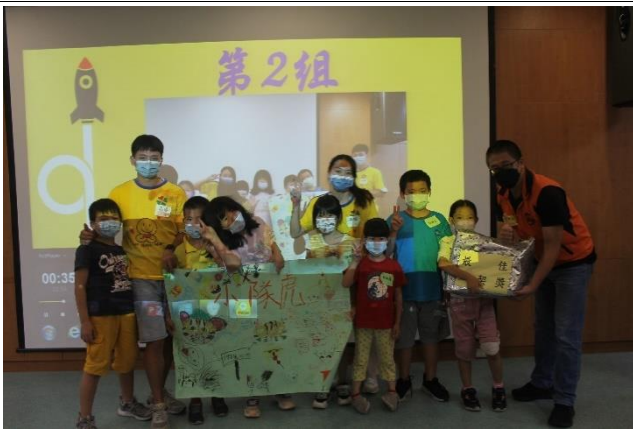
榮耀時刻~團體競賽—最佳默契獎