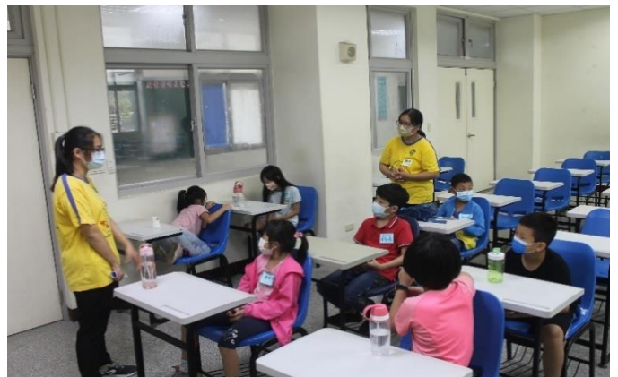
小組時間—隊名發想