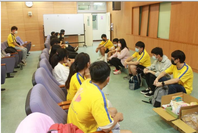
志工分享活動心得