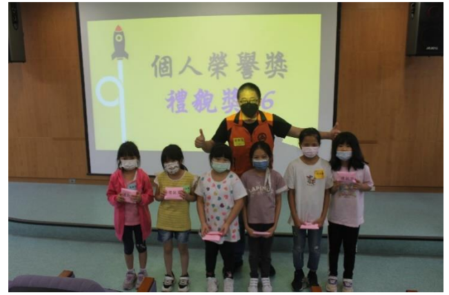
榮耀時刻~個人榮譽-禮貌獎