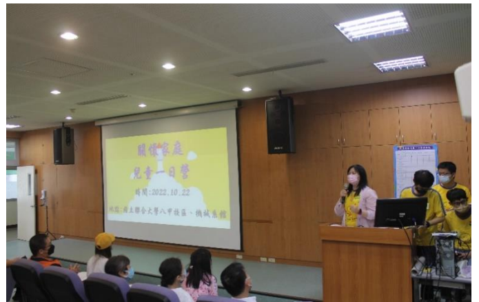
開幕式—雅愉老師介紹團隊