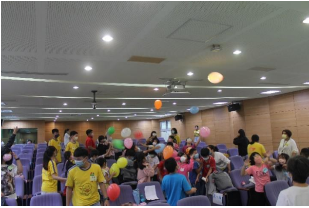
品格教育—破冰遊戲