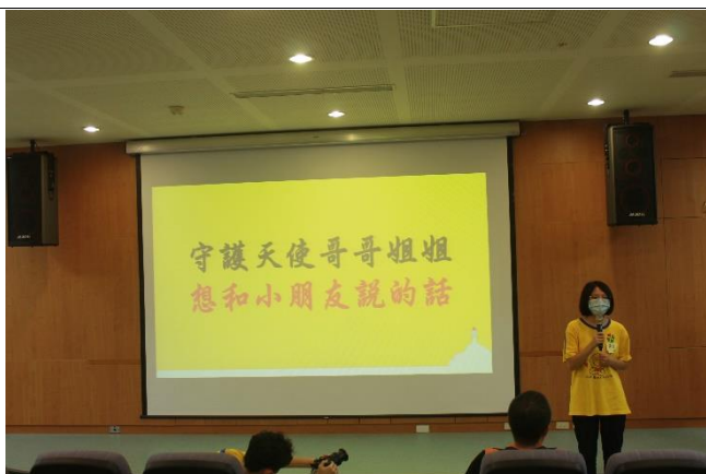
守護天使佳怡姐姐 欣賞小朋友的認真