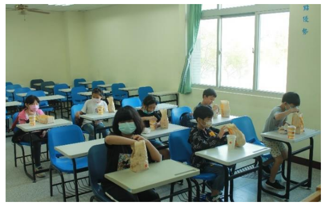
吃午餐還是有做好防疫距離喔