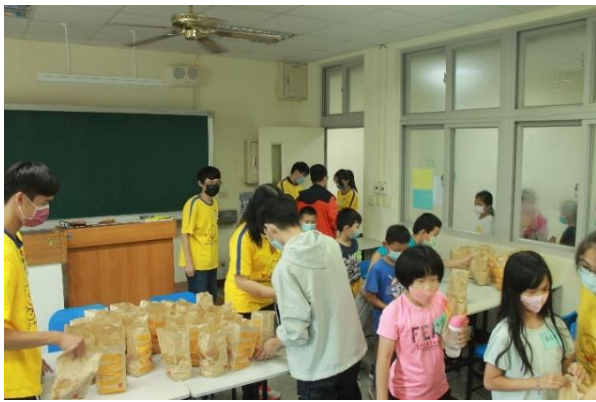
小朋友排隊領取好吃的麥當勞