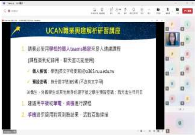
講師講解本次課程活動內容