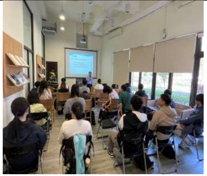
來至不同系所同學踴躍參與本次講座