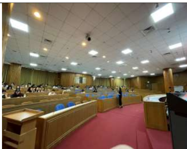
講師介紹職涯測評工具