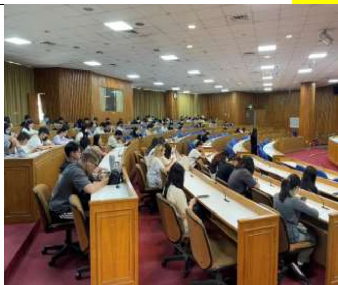
講師講解本次課程活動內容