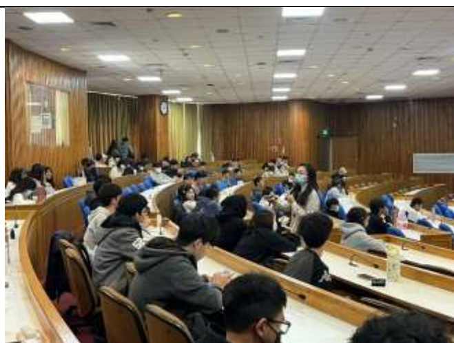
講師與學生互動有獎徵答