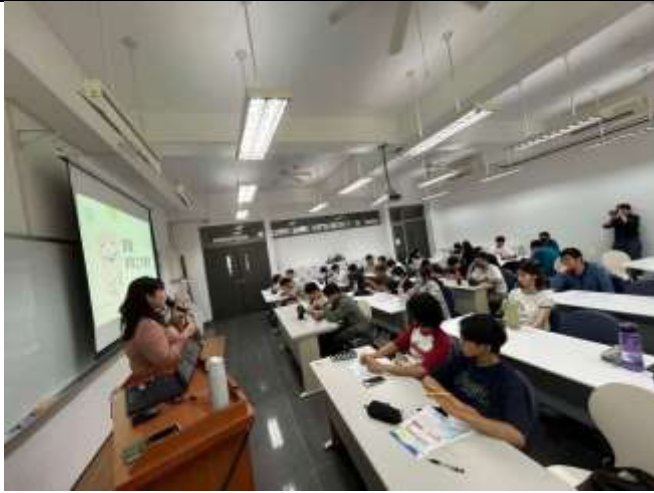
講師講解本次課程活動內容