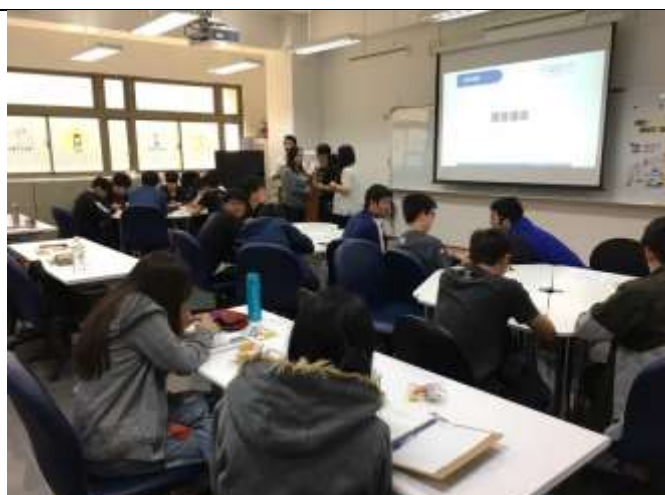
學生課後與老師交流