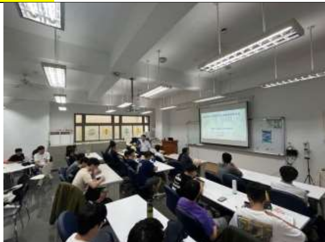
學生針對課程主題選課並積極參與