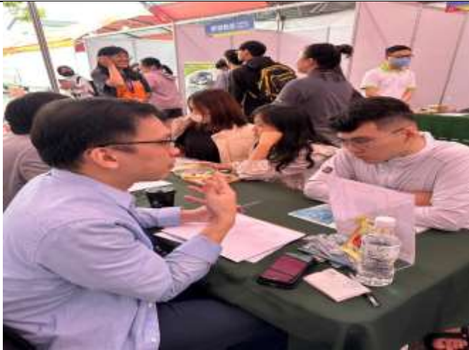
企業主管與學生進行履歷健檢