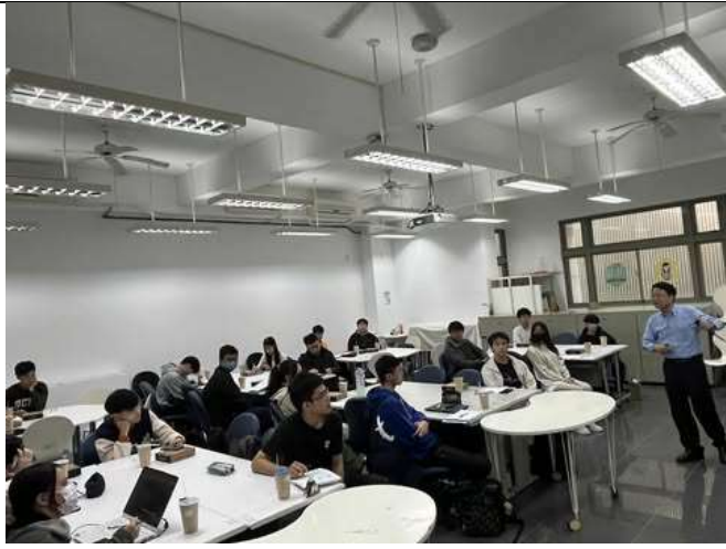
講師講解本次課程活動內容