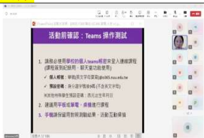
活動開始前的各種測試