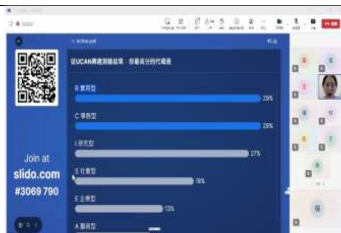
同學們線上投票自己屬於何種職業類型