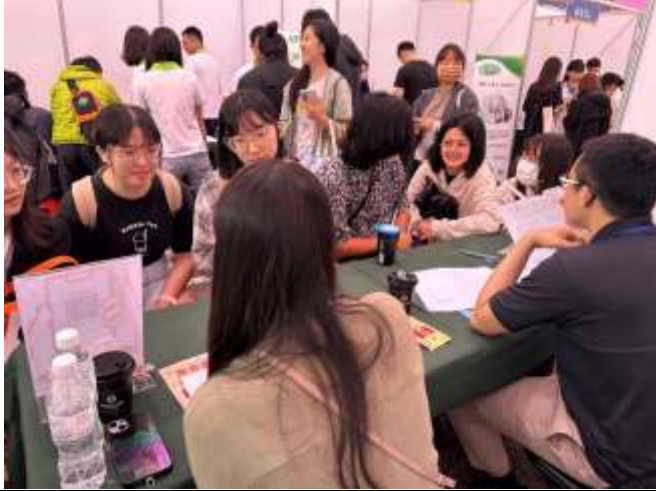
企業人資與資深工程師給予履歷建議