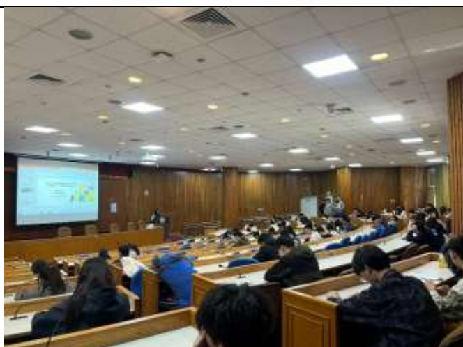
課程尾聲講師向同學介紹政府就業相關資源