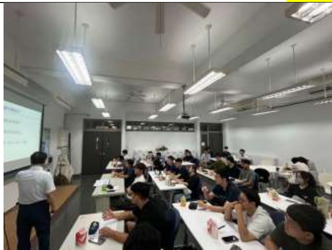
講師講解本次課程活動內容