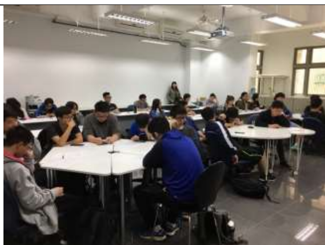
學生仔細聽講本次課程