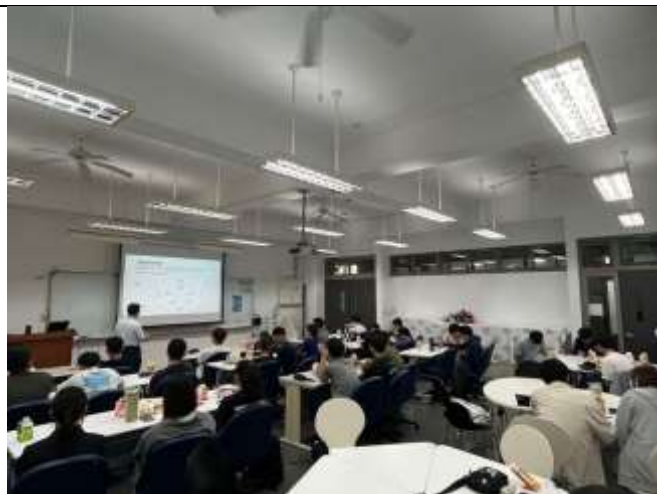
活動課程流程進行順暢