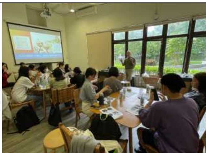
講師於課程中也分享自己創業歷程