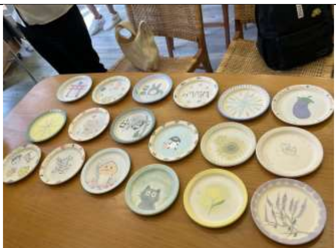
同學們的作品需燒製後分發給同學