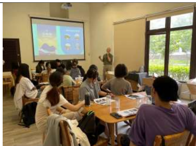
針對花草茶調至進行說明