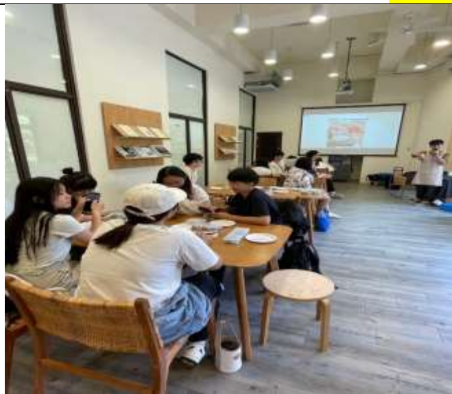
講師介紹波蘭陶&釉下彩的由來