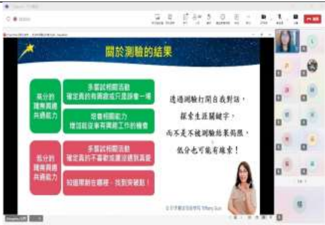
講解關於 UCAN 測驗的結果