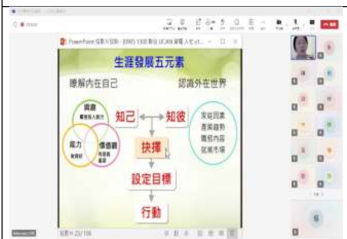
與同學們討論生涯發展五元素