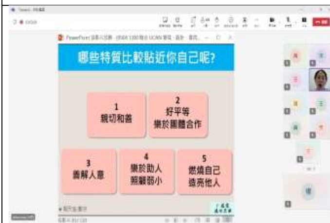
與同學們討論哪些特質較貼近自己