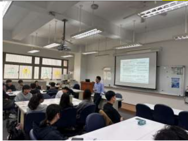
講師講解本次課程活動內容