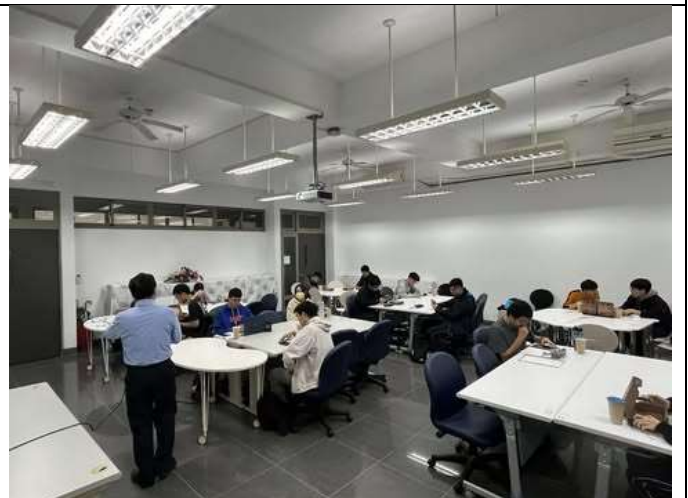
學生們與講師互動良好