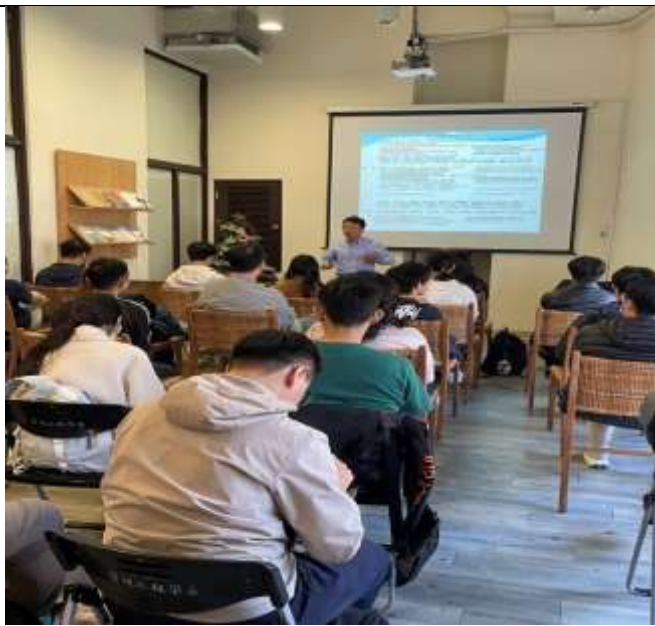
講師針對學生常見的生涯規劃問題進行解析