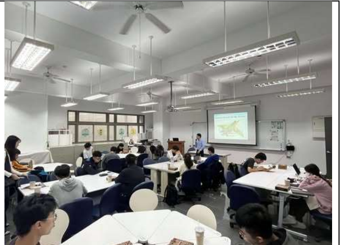
本次講座吸引無數系所同學參與