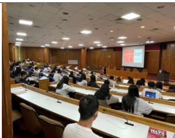
課程尾聲講師介紹政府職涯就業資源