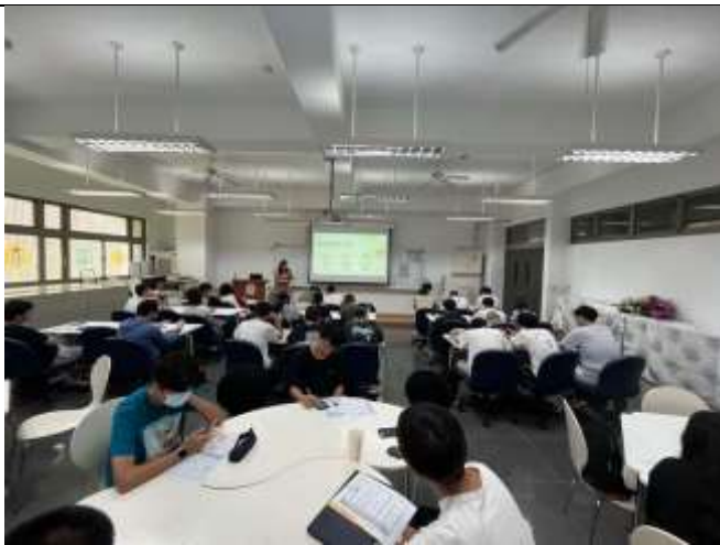
課程針對個人優勢進行探索