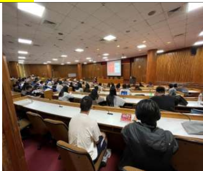
同學們認真聆聽講座