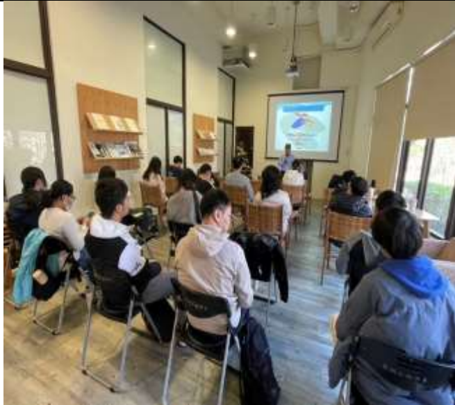
講師開場介紹課程主題