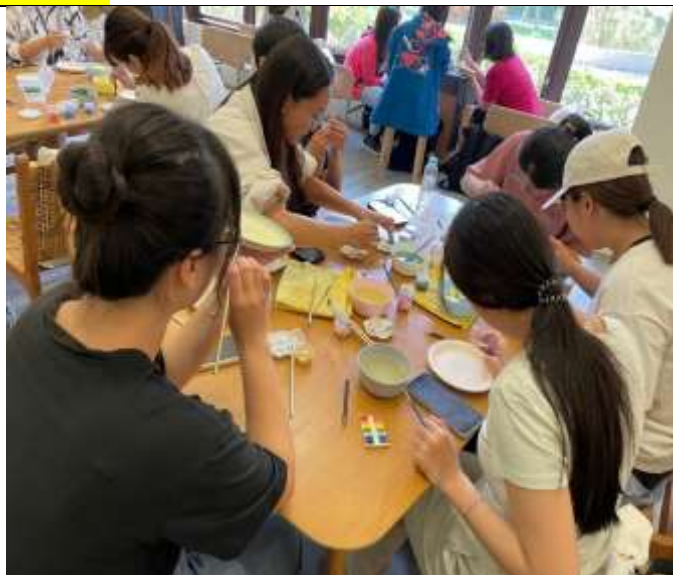
同學們透過本次課程多了許多互動