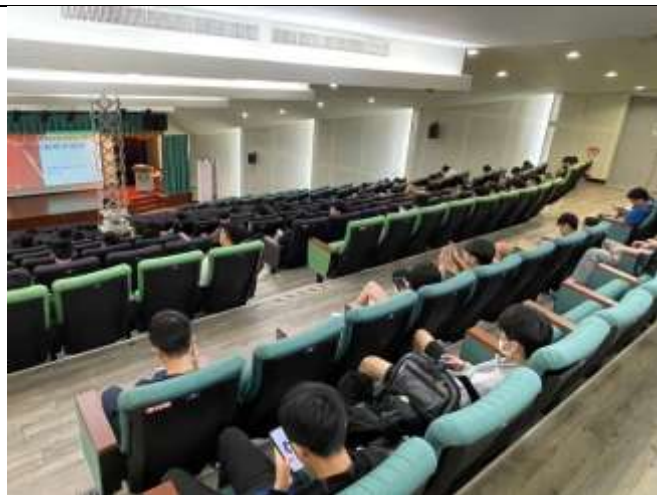
分別來至不同學院、學系同學