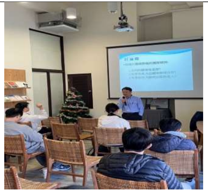
同學們仔細聆聽本次講座受益良多