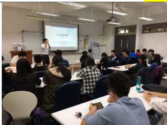
講師針對課程主題做介紹