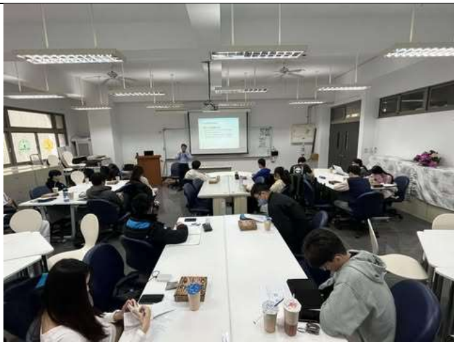
以分組方式來進行本次課程