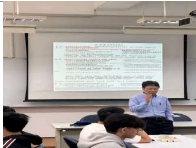
本次課程讓學了解職場需求有哪些