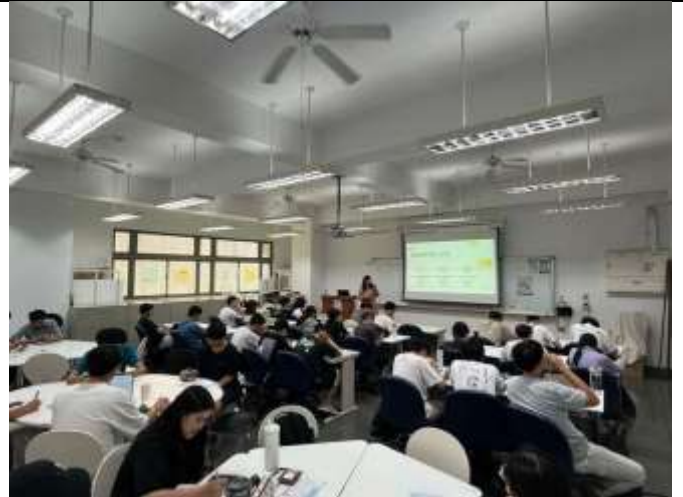
透過課程幫助學生建立職涯發展藍圖