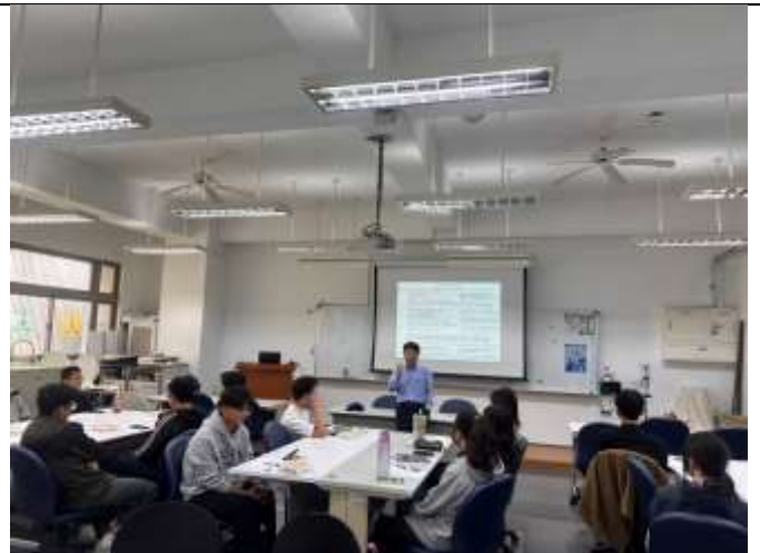
學生們認真聆聽課程