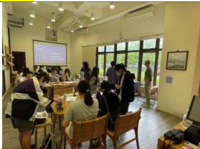
學生分組進行手作體驗