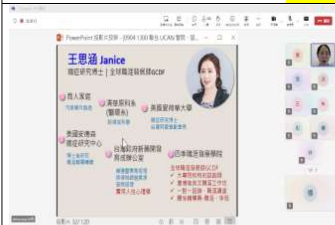
本次課程講師介紹