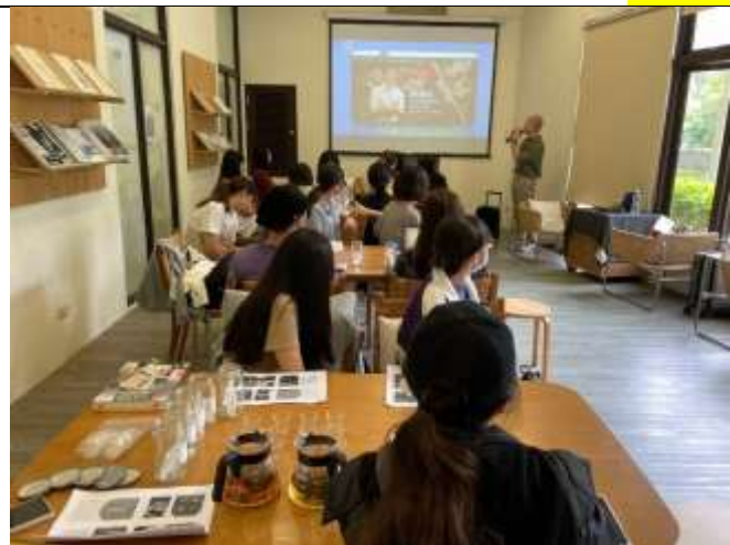
講師課程開始前先自我介紹