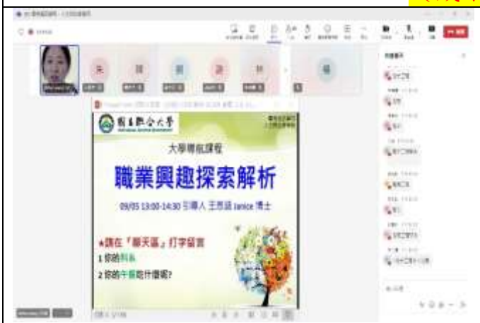
本次活動課程主題