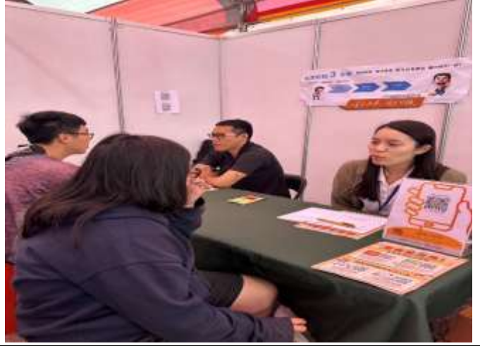
企業人資與資深工程師給予履歷建議