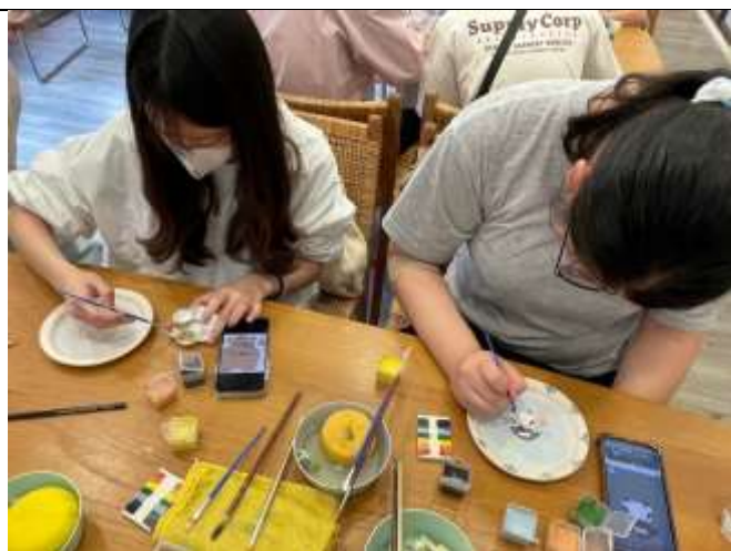
每位同學的創意無限