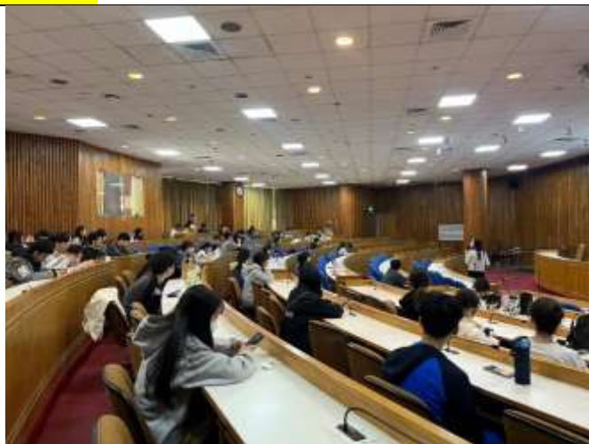
講解針對 UCAN 平台架構、資源