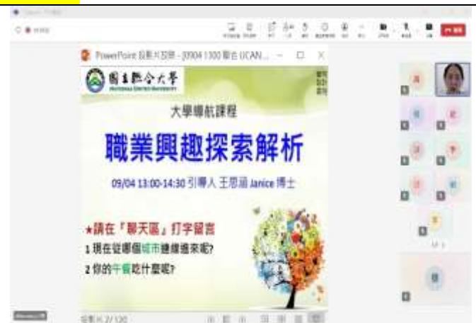
本次活動課程主題