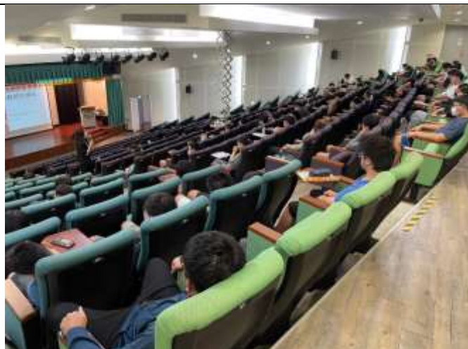
講師與學生互動良好學生回饋極佳