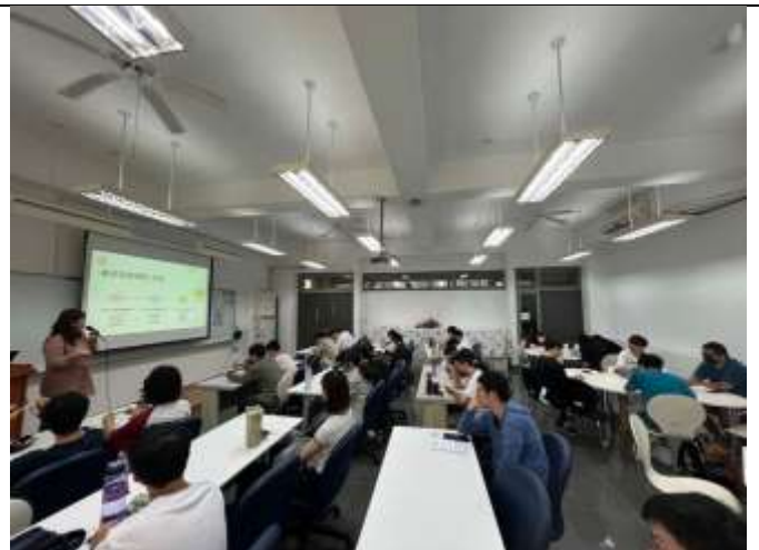
本次課程可提升未來的競爭力