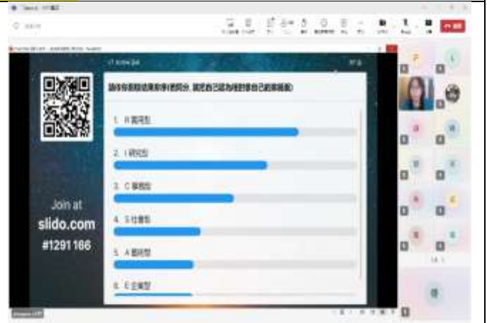
透過線上功能了解學生施測結果