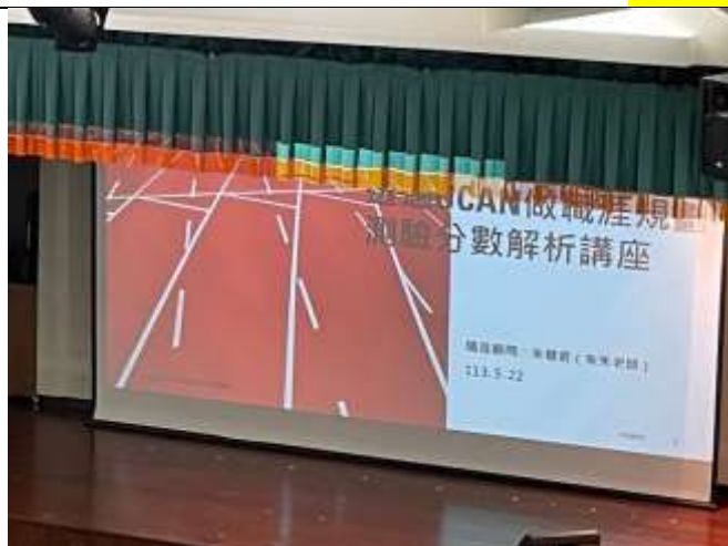
講師針對本次課程主題介紹