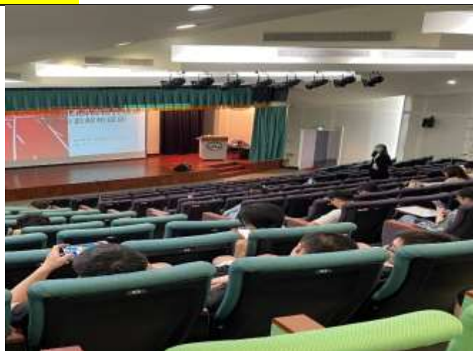
本校針對 UCAN 解析有興趣的學生 選課聽講