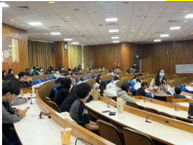
講師講解本次課程活動內容