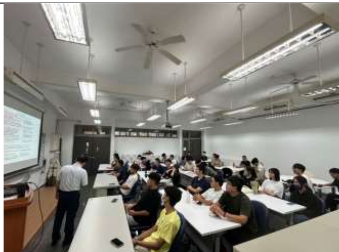
學生認真仔細聽講受益良多