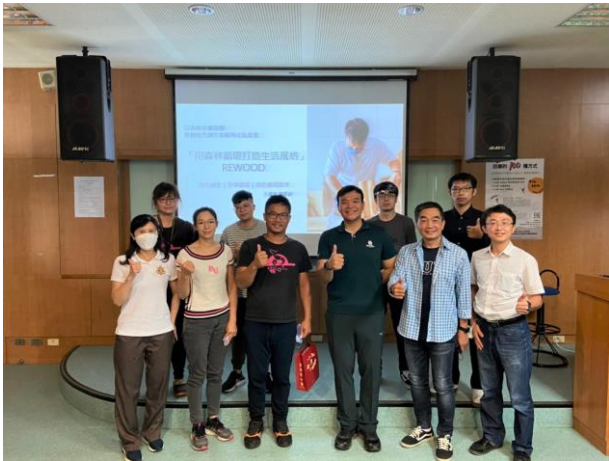
兩位講師與現場學員合影