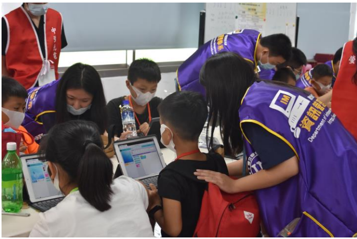
志工耐心指導學童學習