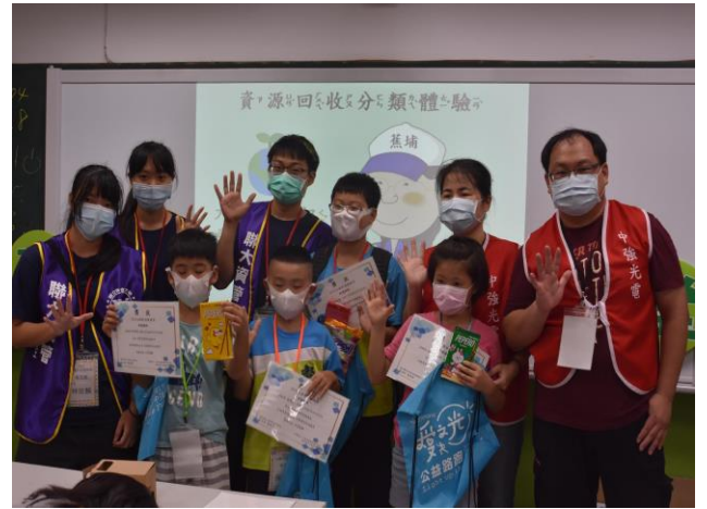
志工與獲獎學童合影